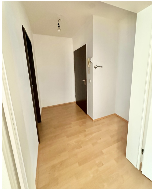
Diele / Eingangsbereich