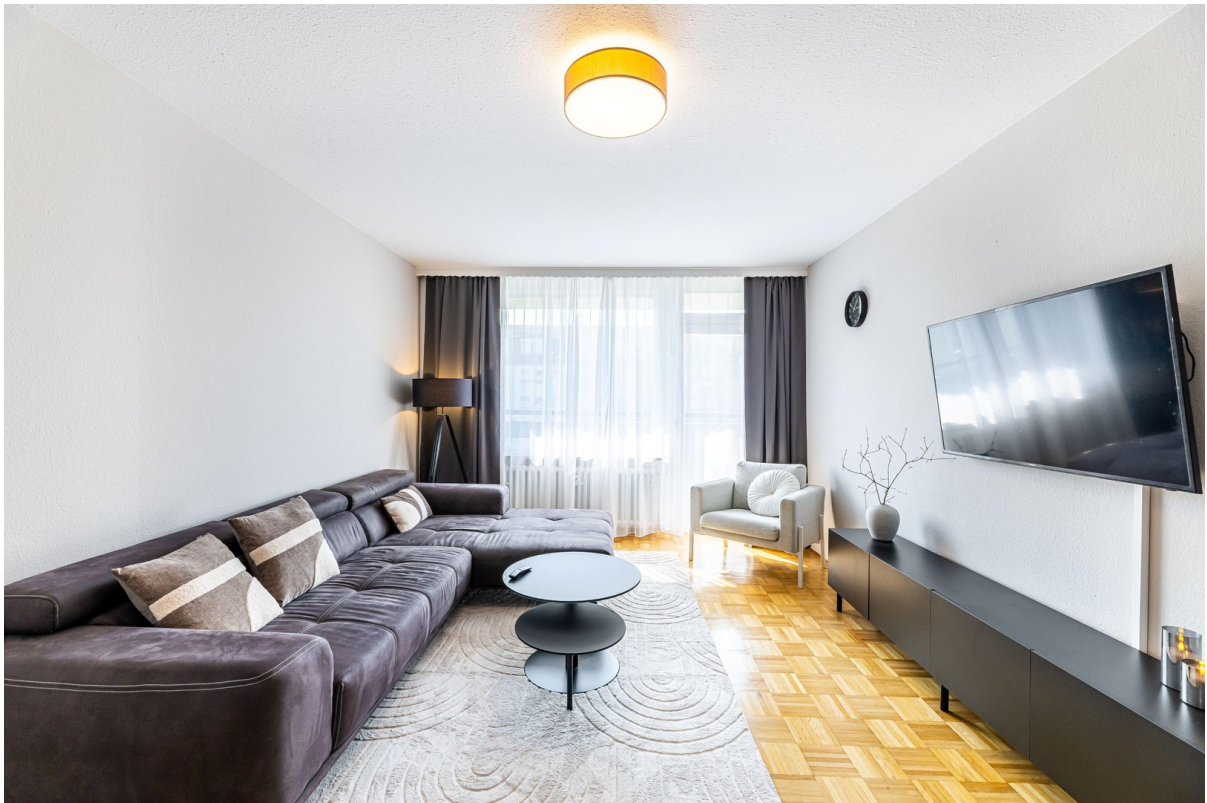
Wohnzimmer mit Balkonzugang