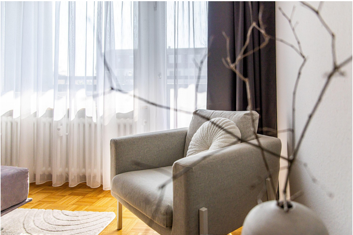
Stilvoll möbliertes Wohnzimmer