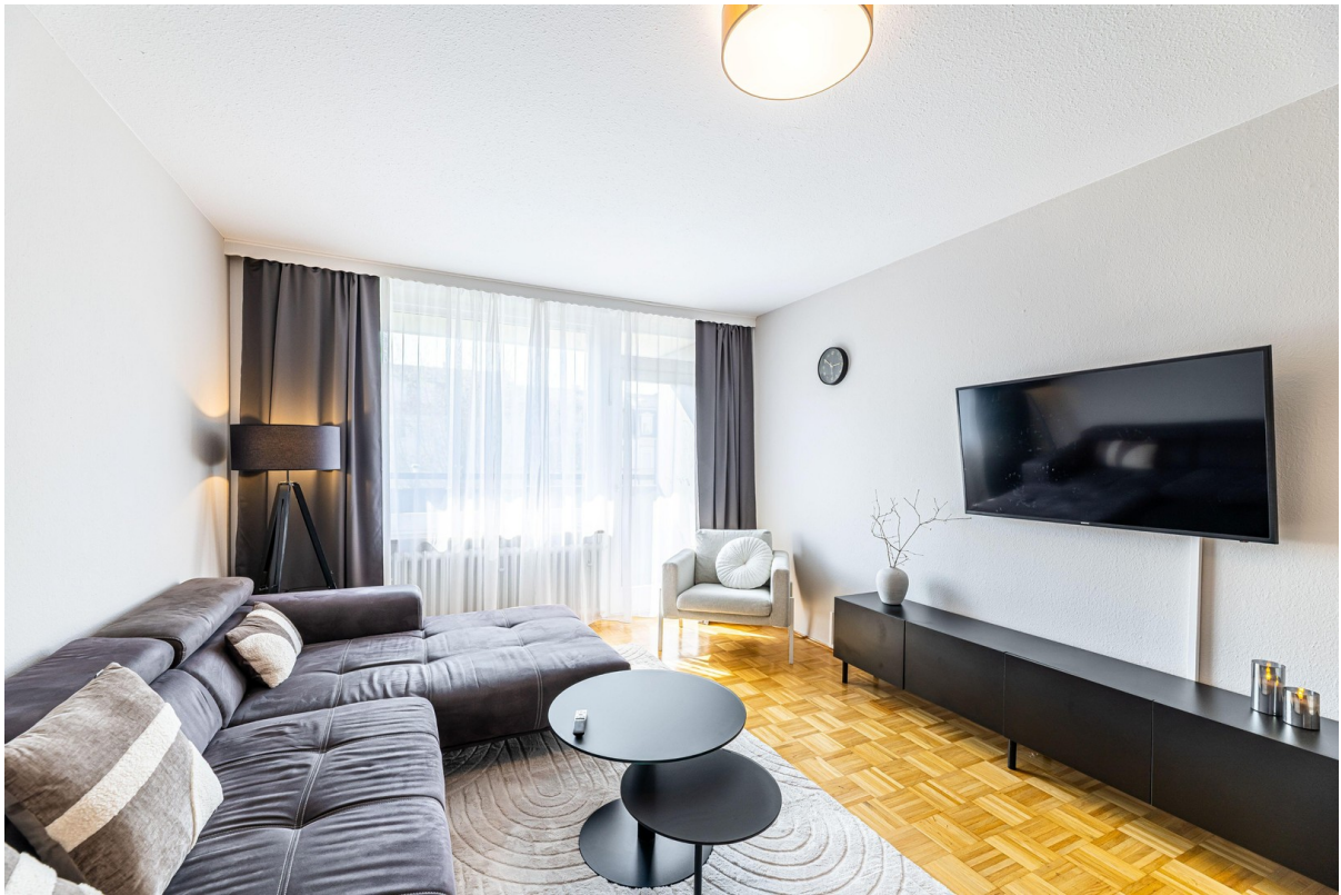
Stilvoll möbliertes Wohnzimmer