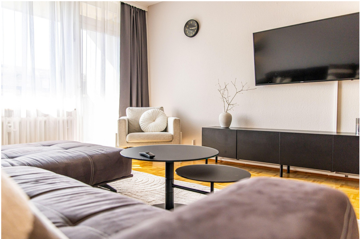
Stilvoll möbliertes Wohnzimmer