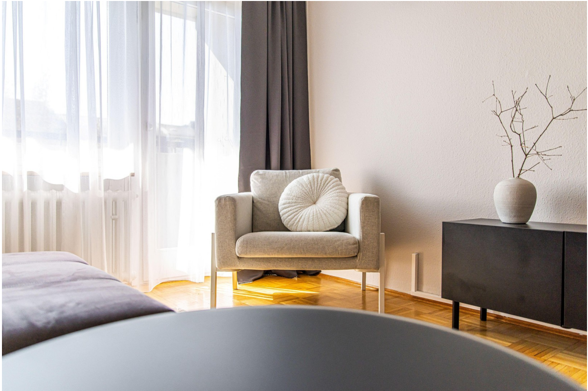
Stilvoll möbliertes Wohnzimmer