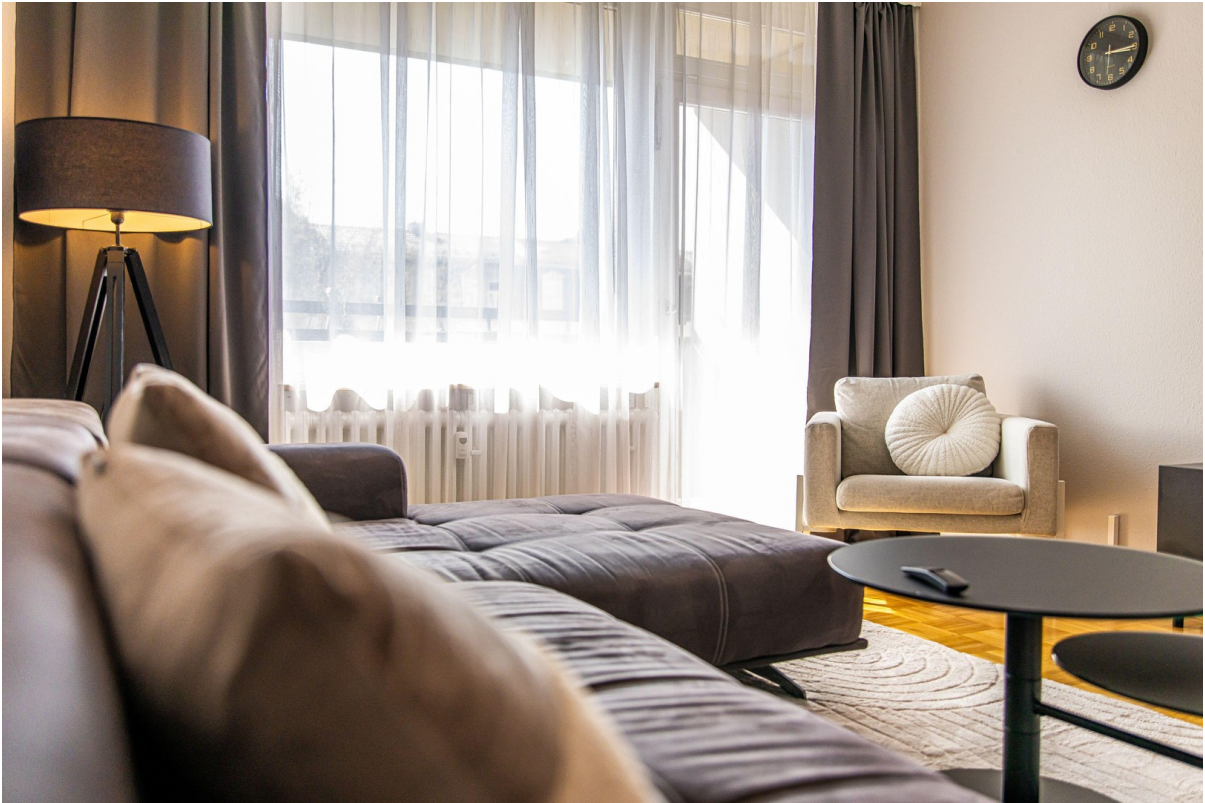
Stilvoll möbliertes Wohnzimmer