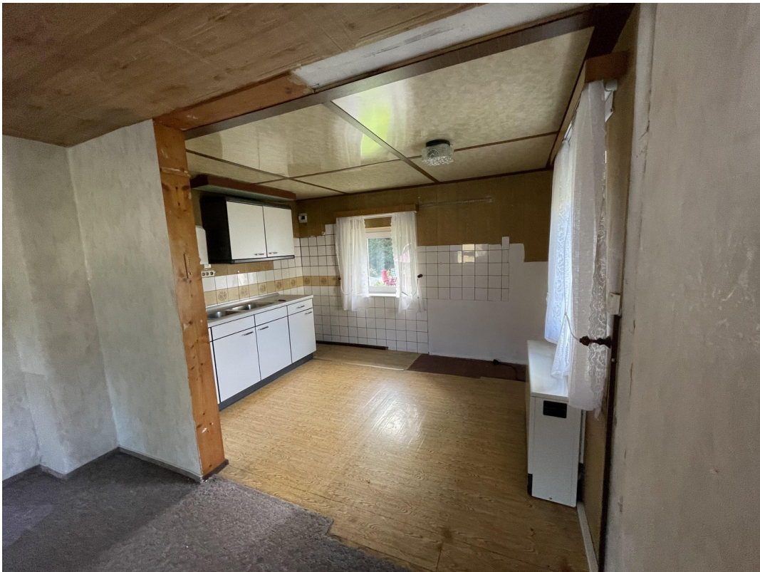
Blick in Küchenbereich