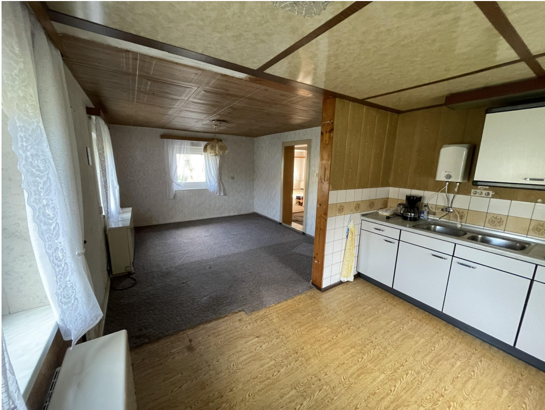
Blick in Essbereich