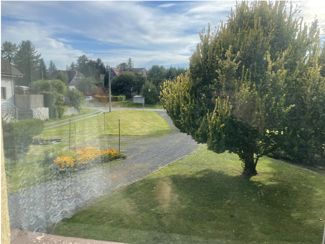
Blick aus Schlafzimmer