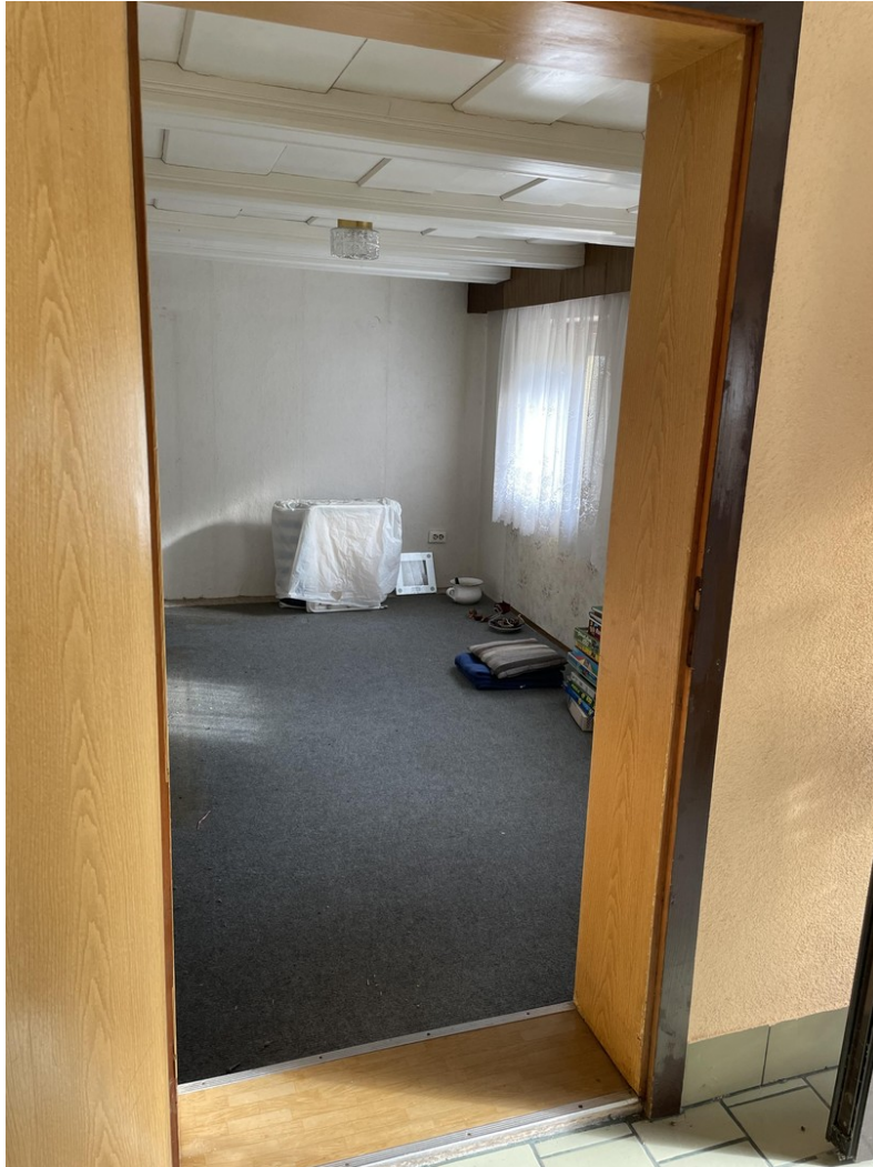
Kind / Hobby EG