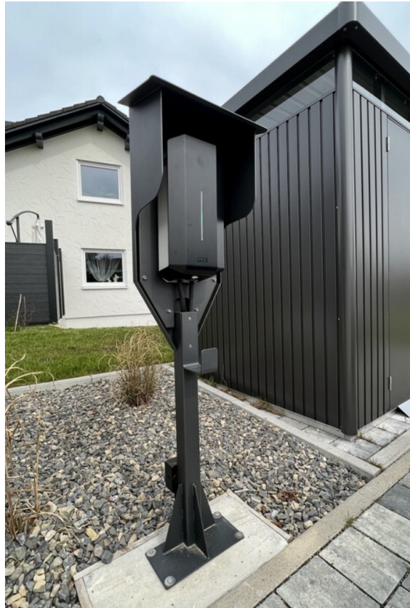
Lademöglichkeit Wallbox für DG