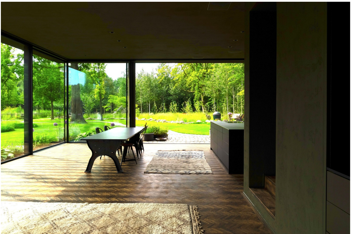
Blick von Küche EG