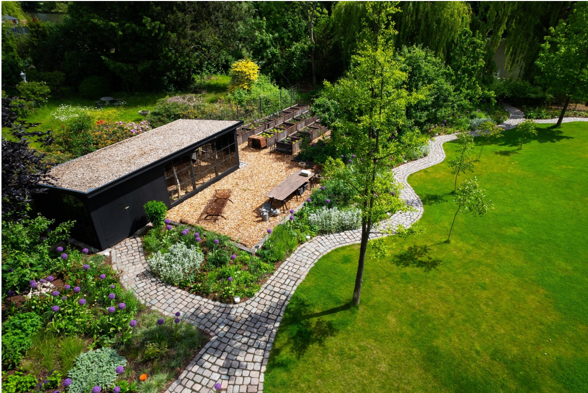
1 OG Zimmer