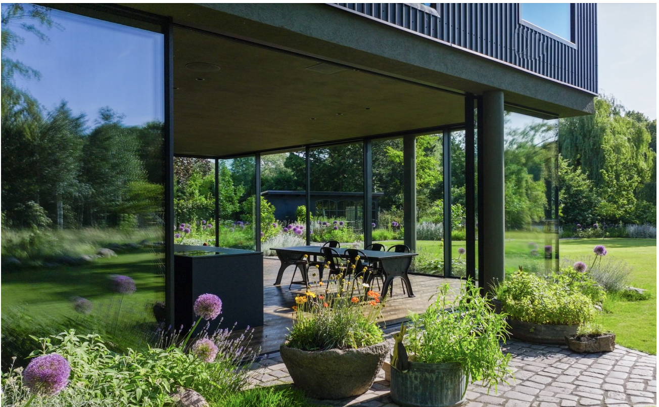
EG / Süd