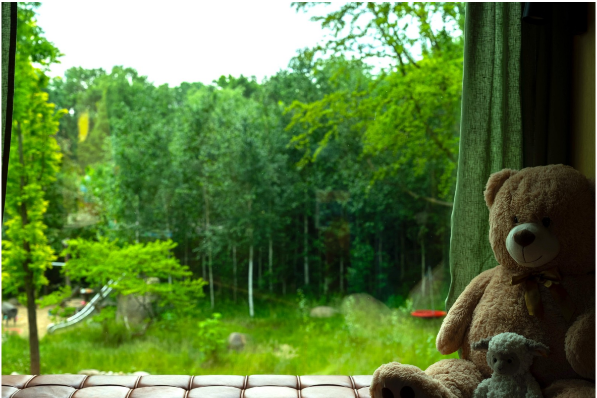
1 OG Zimmer