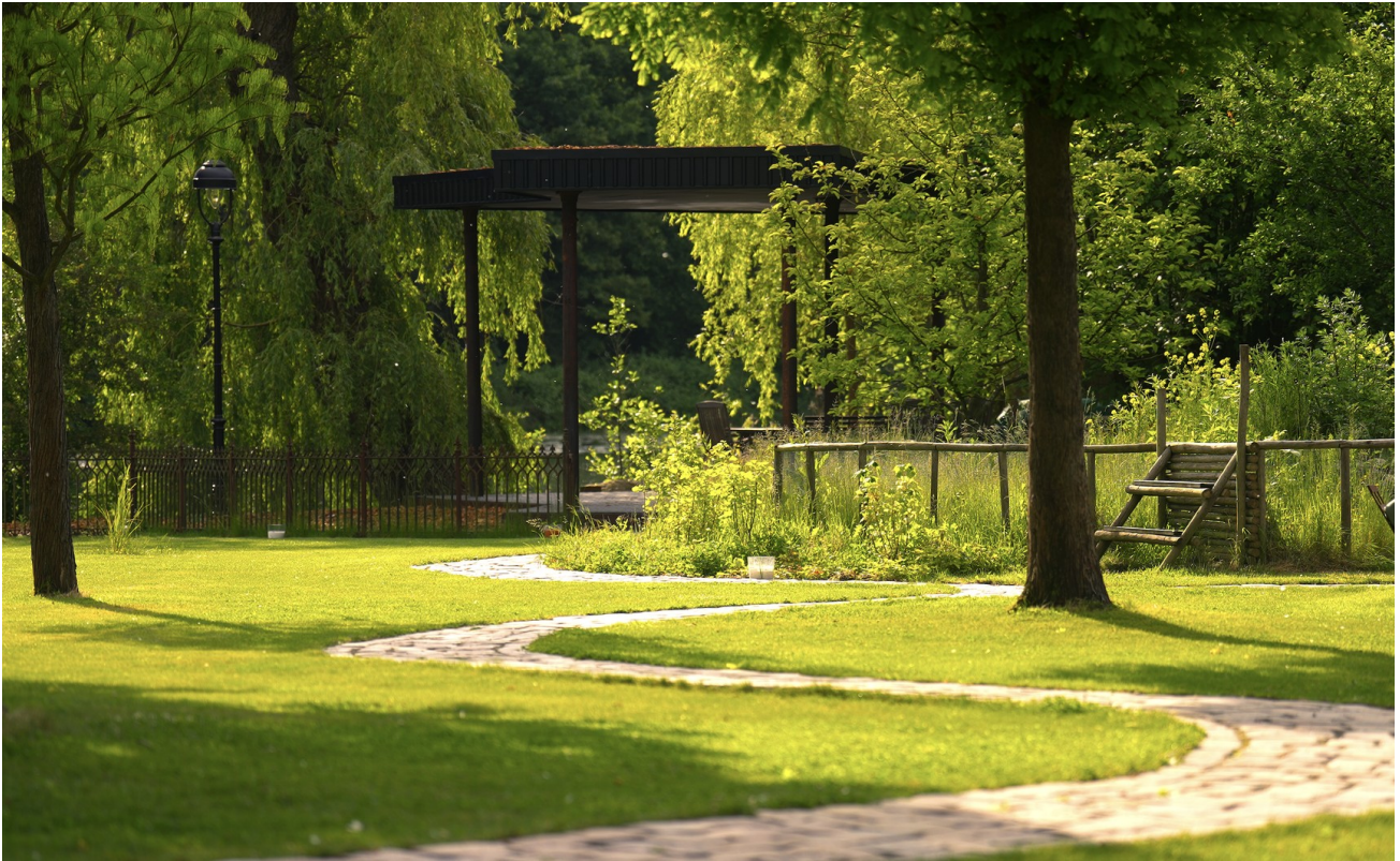
Weg zum Pavillon