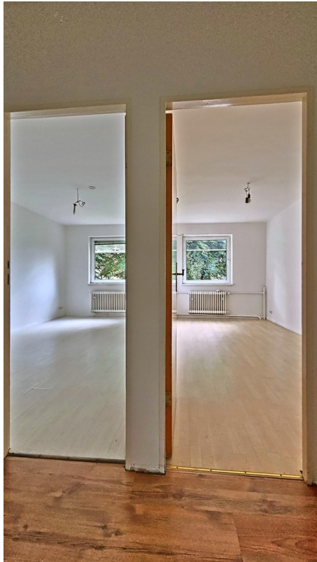
Blick in beide Schlafzimmer