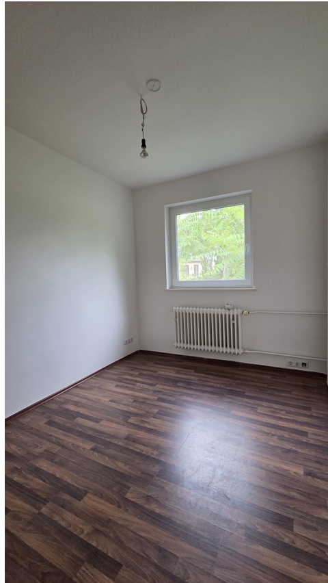
Blick in kleines Schlafzimmer