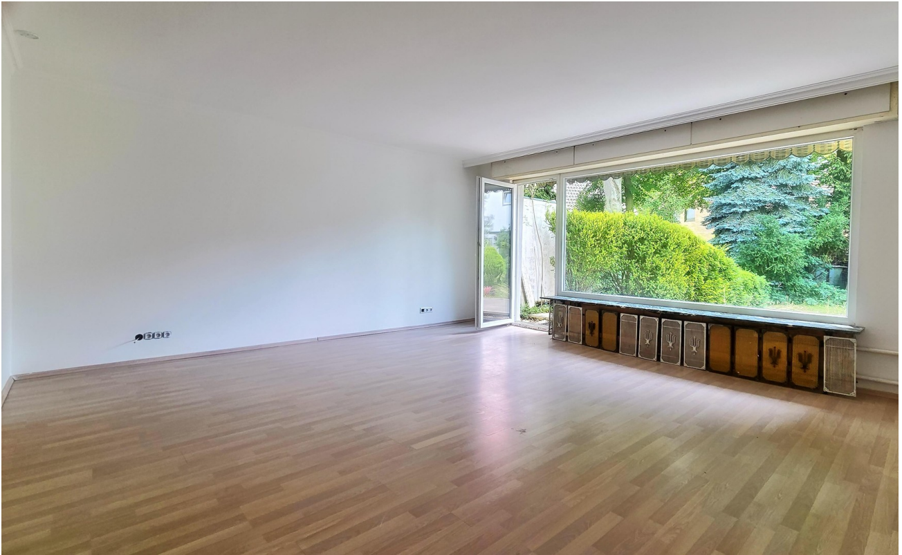
Wohnzimmer / Panoramafenster