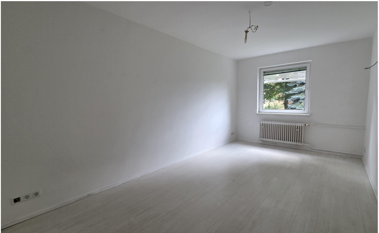
Blick in erste Schlafzimmer