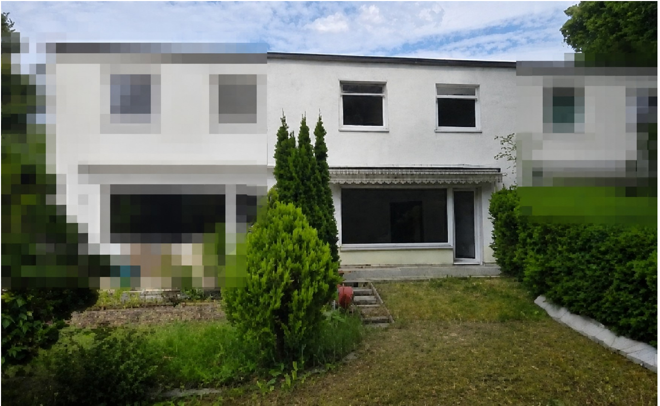
Blick vom Garten auf Terrasse