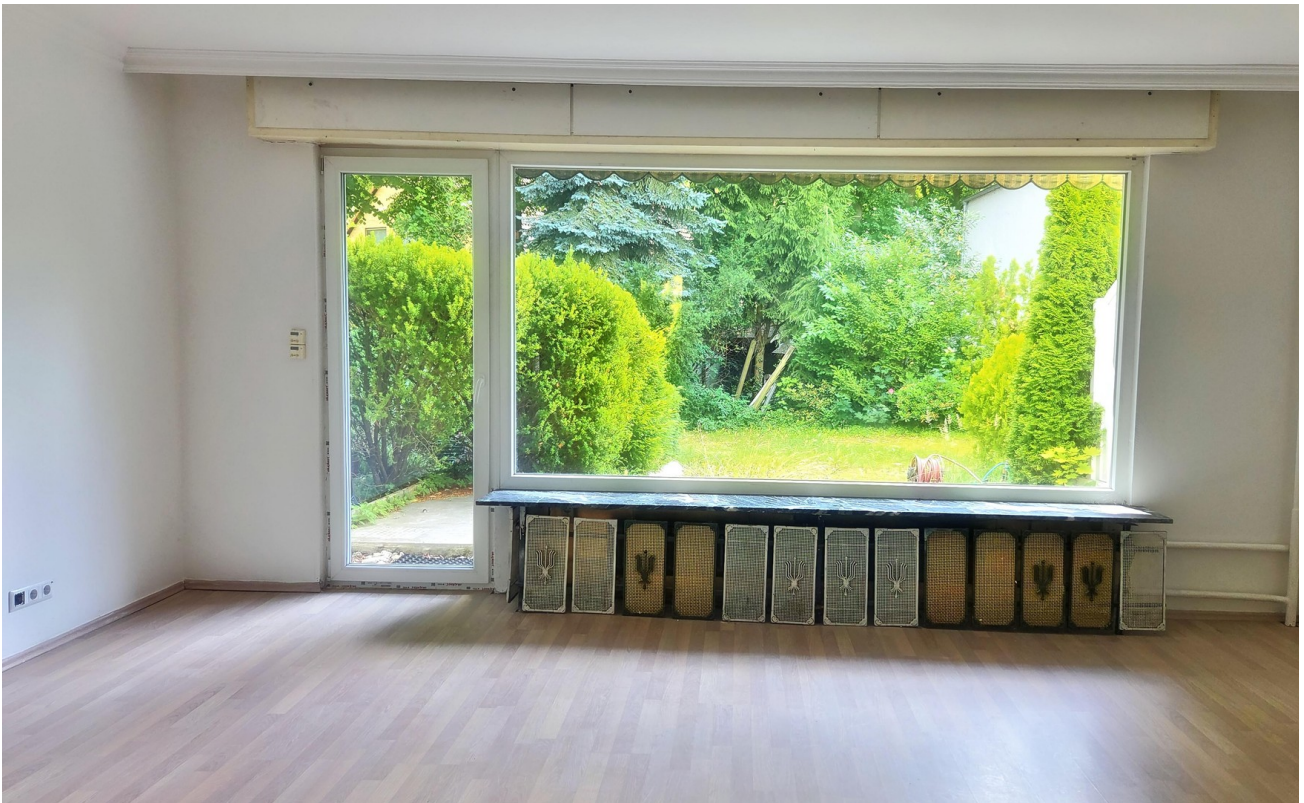
Wohnzimmer / Blick in Garten