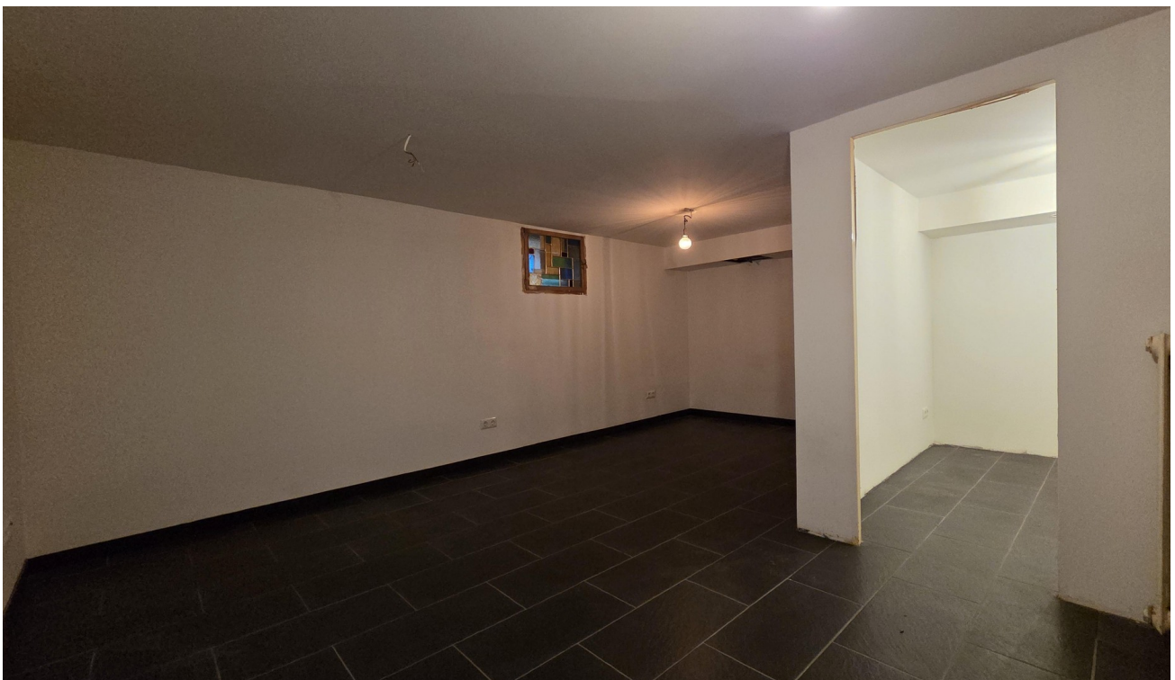
Hobbyraum / Keller