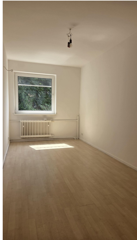
Blick ins zweite Schlafzimmer