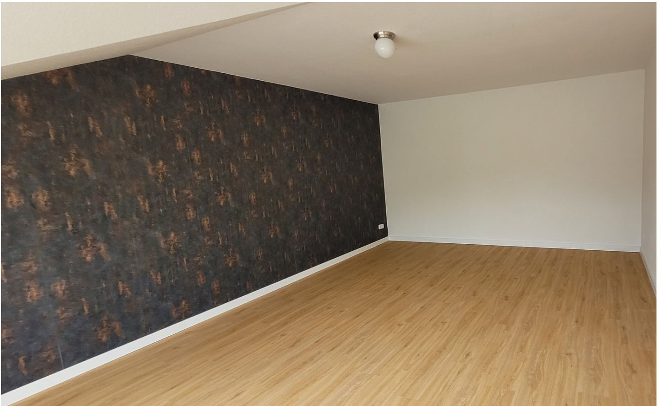
Wohnen / Essen_2