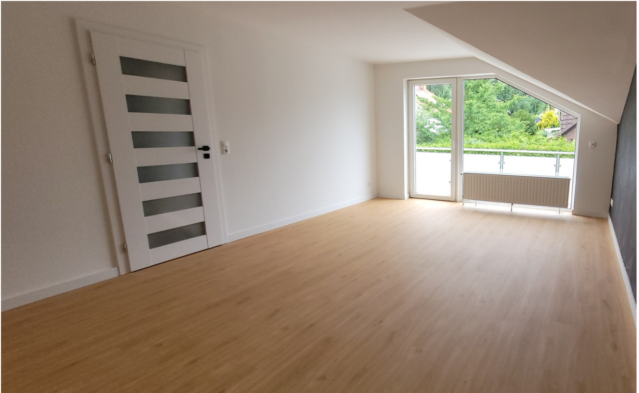
Wohnen / Essen_1