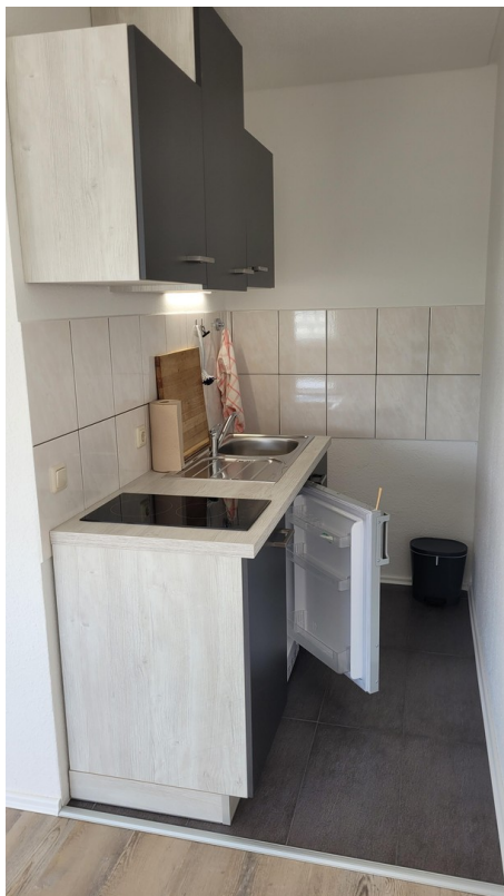
Küche m. Kochfeld u. Kühlschrank.