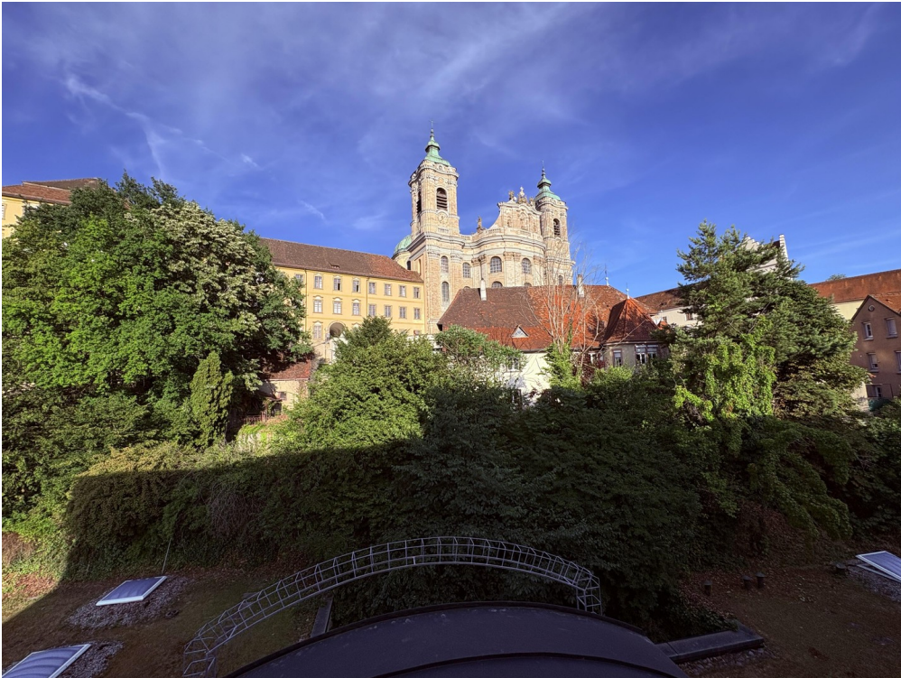
Blick auf Basilika Schlafzimmer