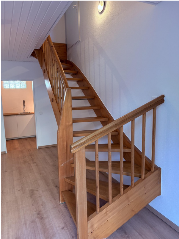
Treppenaufgang Obere Ebene