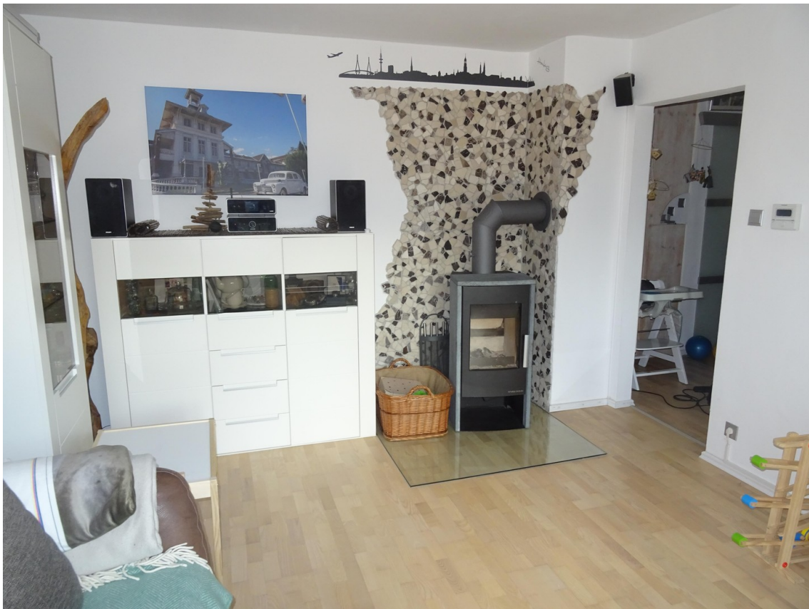
Wohnzimmer mit Kaminofen