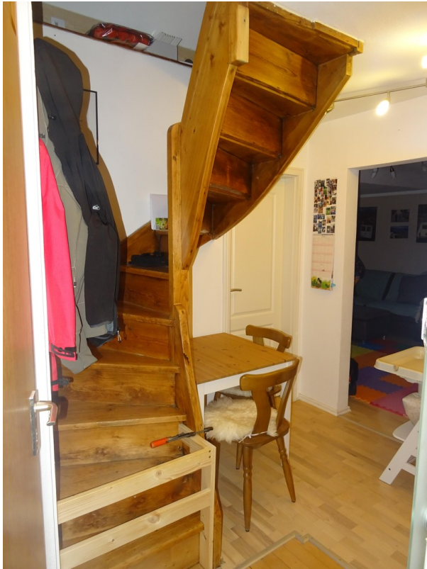
Eingang und Treppenbereich