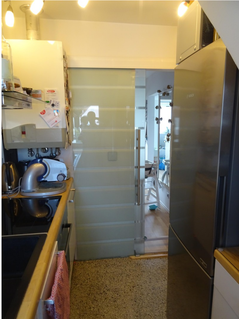
Küche zu Flur