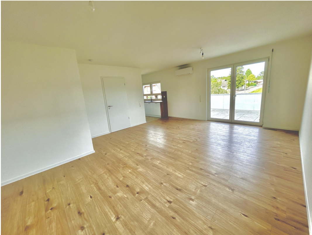
Wohn/Esszimmer: offen und hell