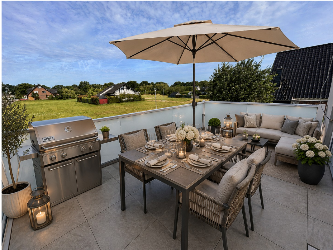
Balkon: virtuell möbliert