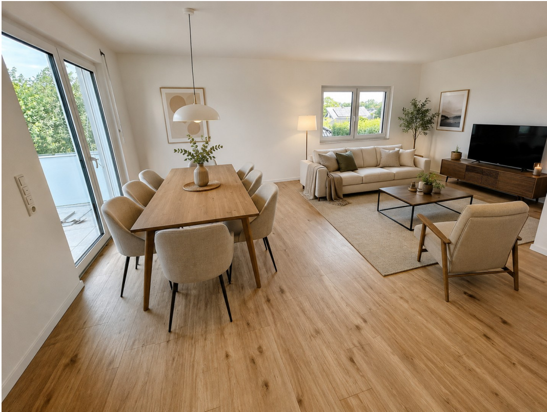
Wohnzimmer: virtuell möbliert