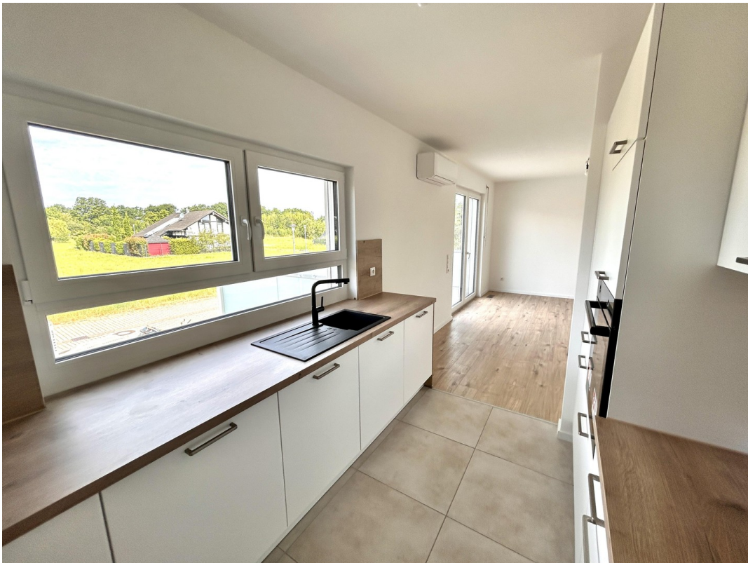
offene Küche + Blick ins Grüne