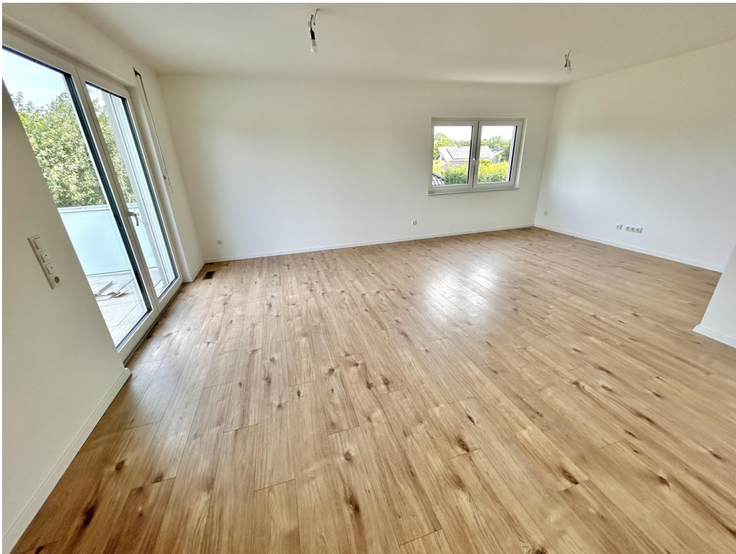
großzügig und lichtdurchflutet