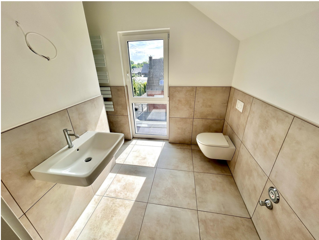
Bad DG: vollwertig + modern...