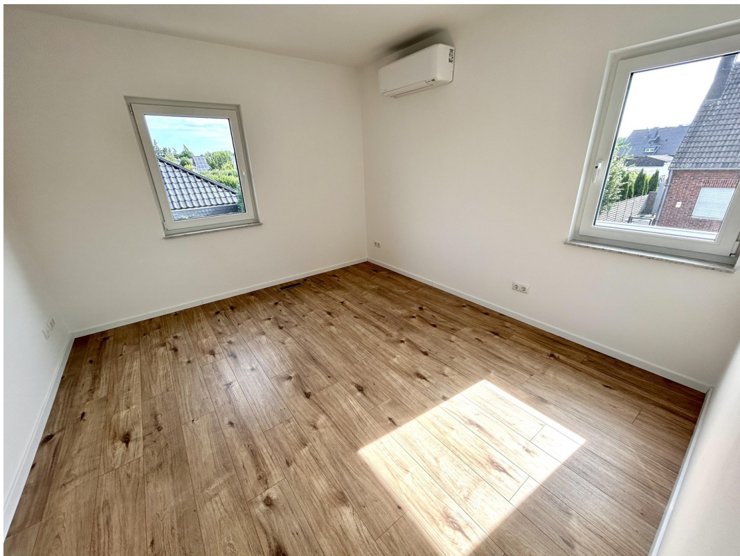
Schlafen, ruhig + hell