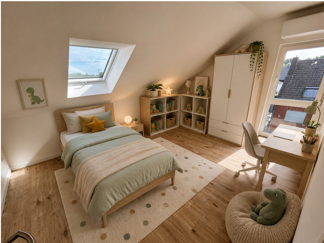
Kind 1: virtuell möbliert