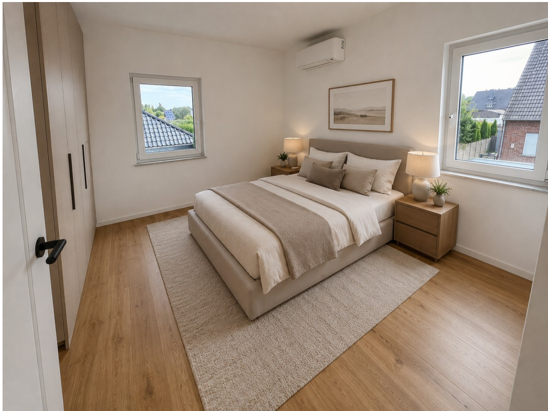
Schlafen: virtuell möbliert