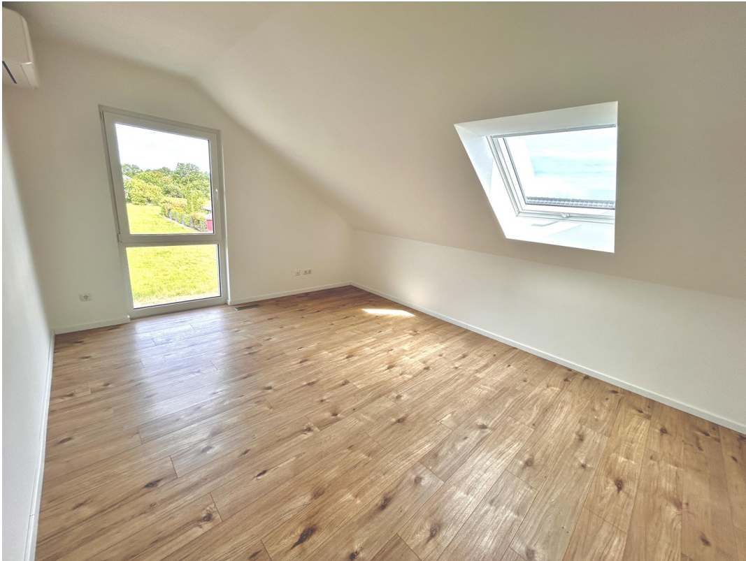
Kind 2: Dachfenster mit Rollo