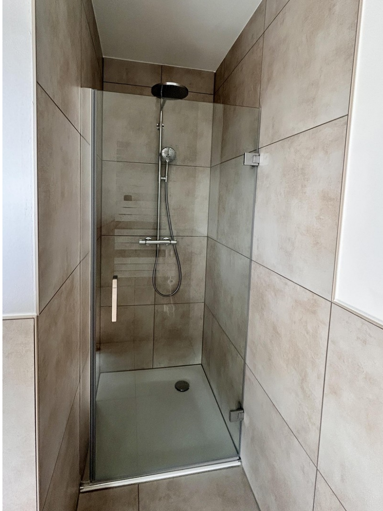
.. mit 2. Luxus-Regendusche