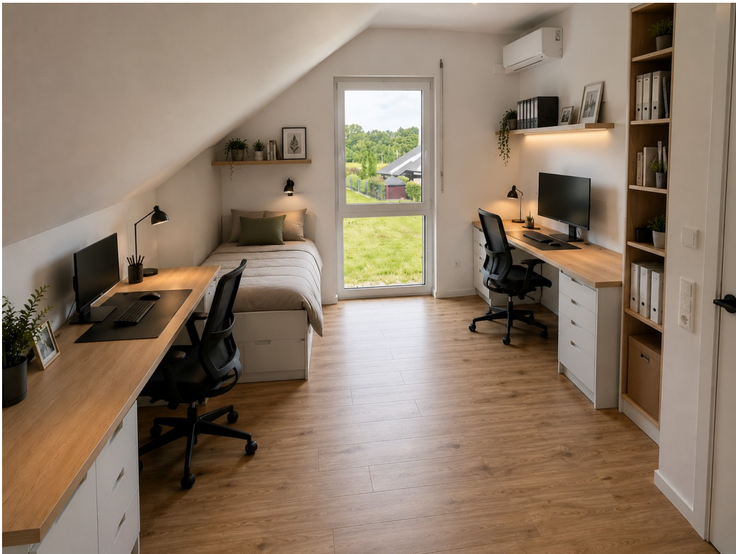
Büro/Kind 3: virtuell möbliert