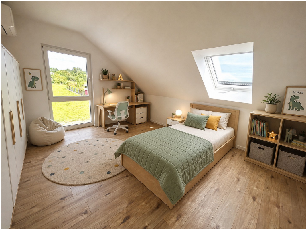
Kind 2: virtuell möbliert