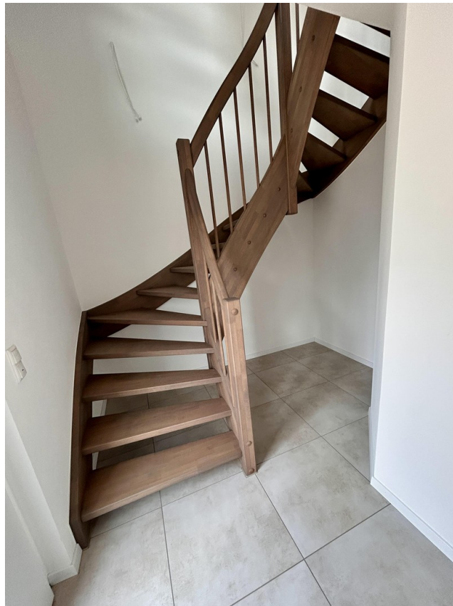
Eigener Eingang mit Garderobe