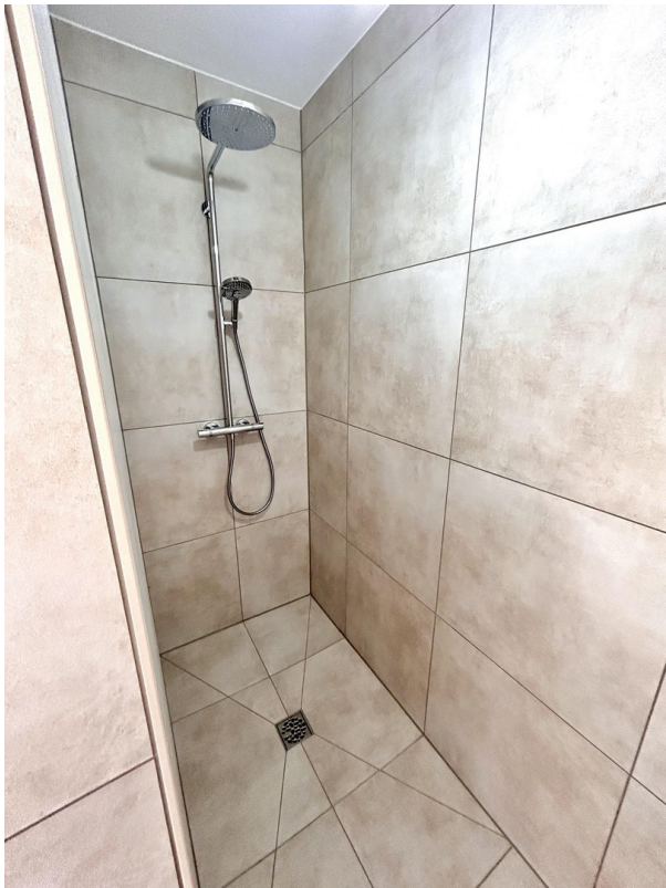
.. und Luxus-Regendusche