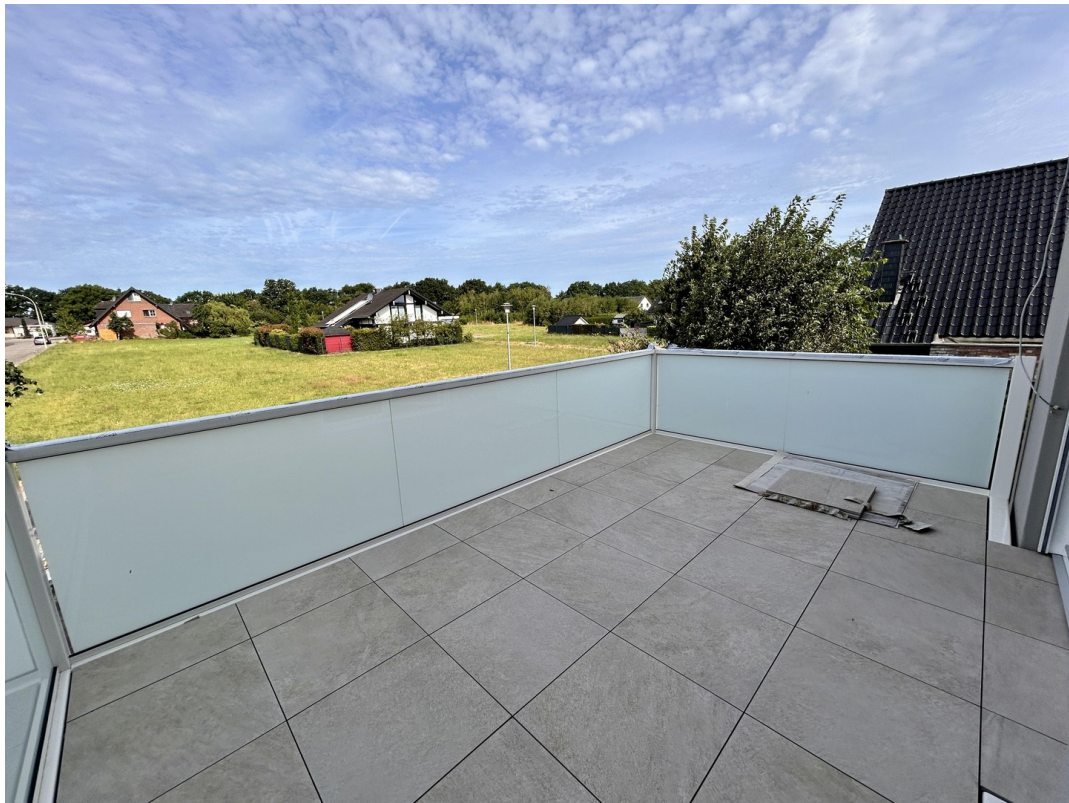
Balkon: mit malerische Wiesen