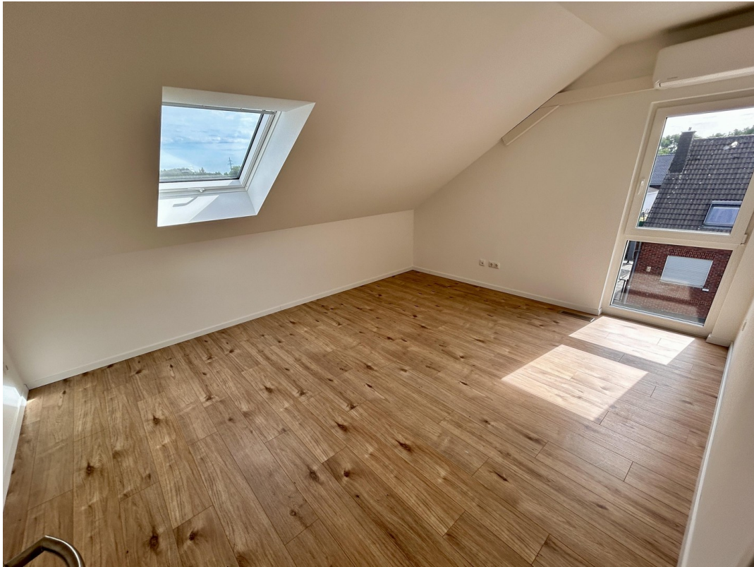
Kind 1: Dachfenster mit Rollo