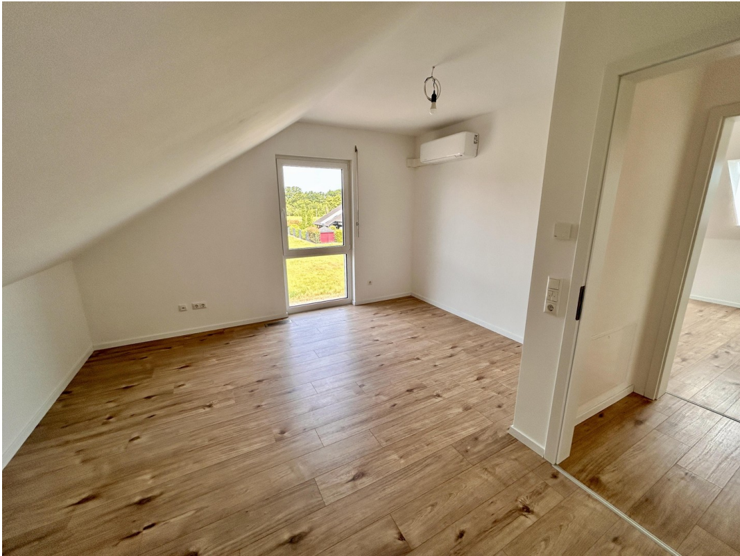
Büro/Kind 3 flexibel nutzbar