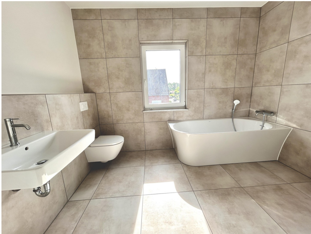
Bad mit Designwanne..