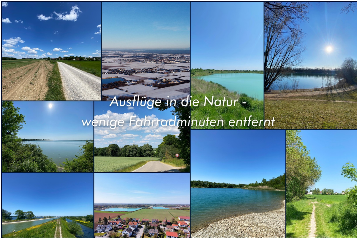
Ausflüge rund um die Whg