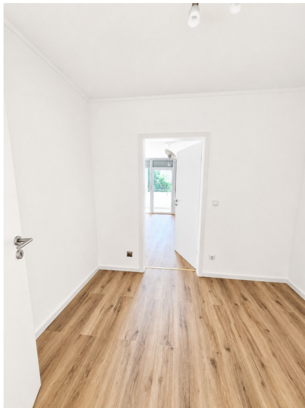
Blick ins Schlafzimmer