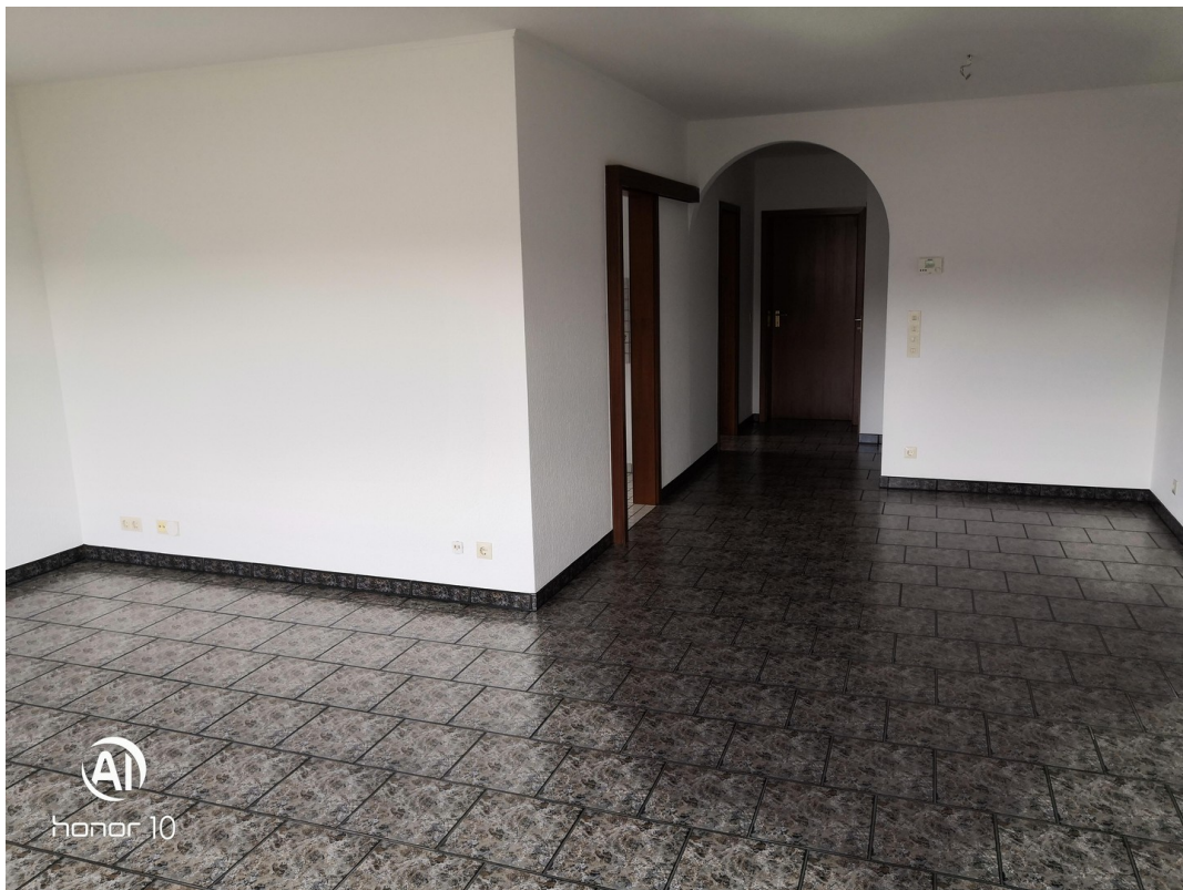
Wohnzimmer mit Essbereich