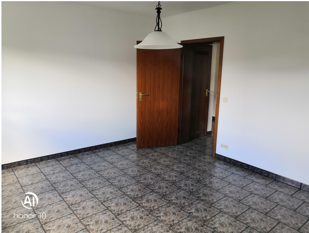
Schlafzimmer Blick zur Diele