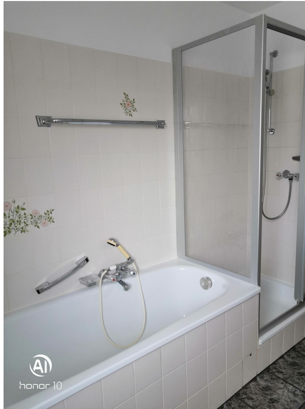
Badewanne und Dusche