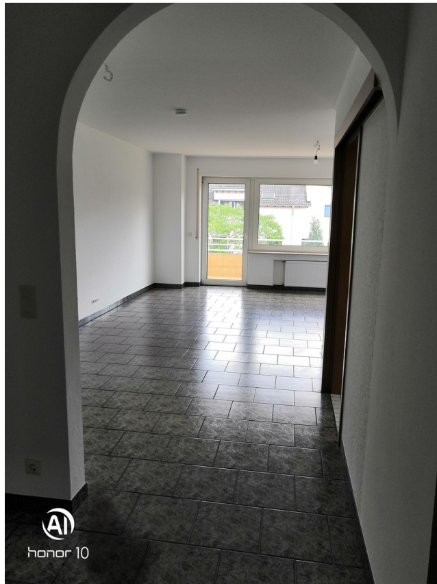
Wohnzimmer Blick aus Rundbogen