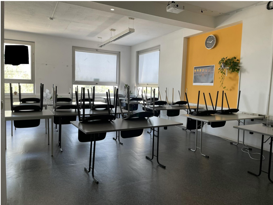
3. Raum / Schulung 1 / Bild 3