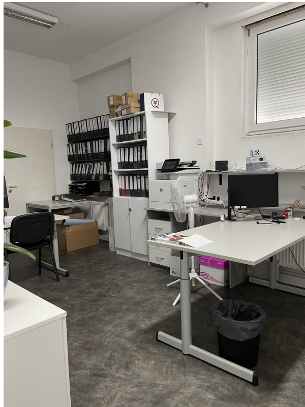
6. Raum / Büro 2 / Bild 1