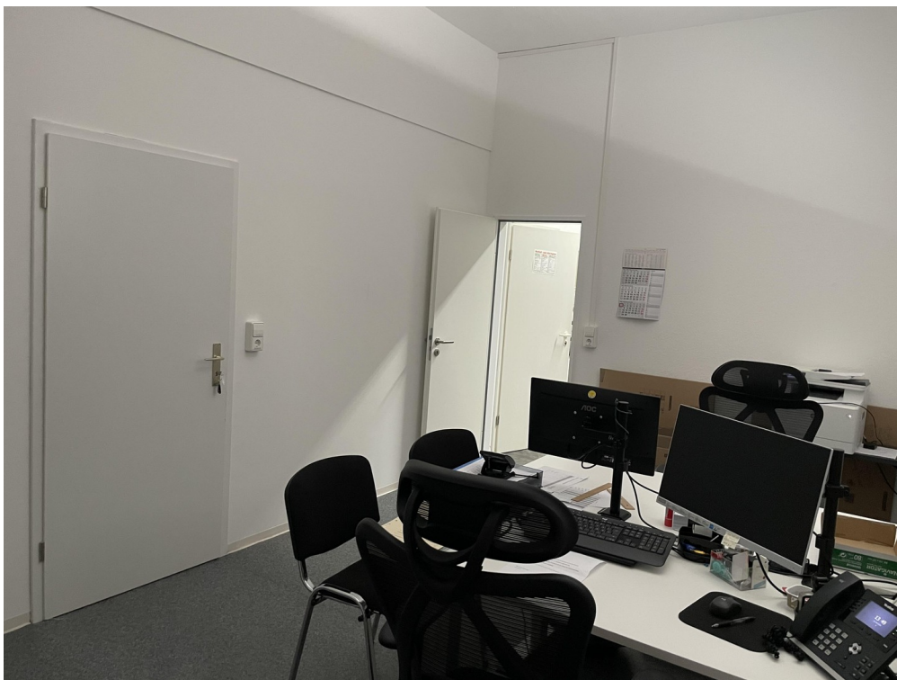
5. Raum / Anmeldung / Bild 1