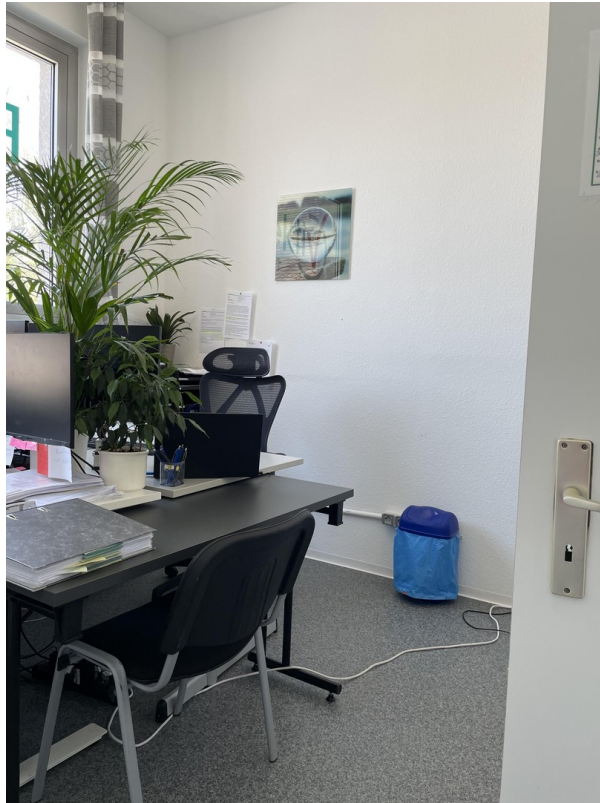
1. Raum / Büro 1 / Bild 2