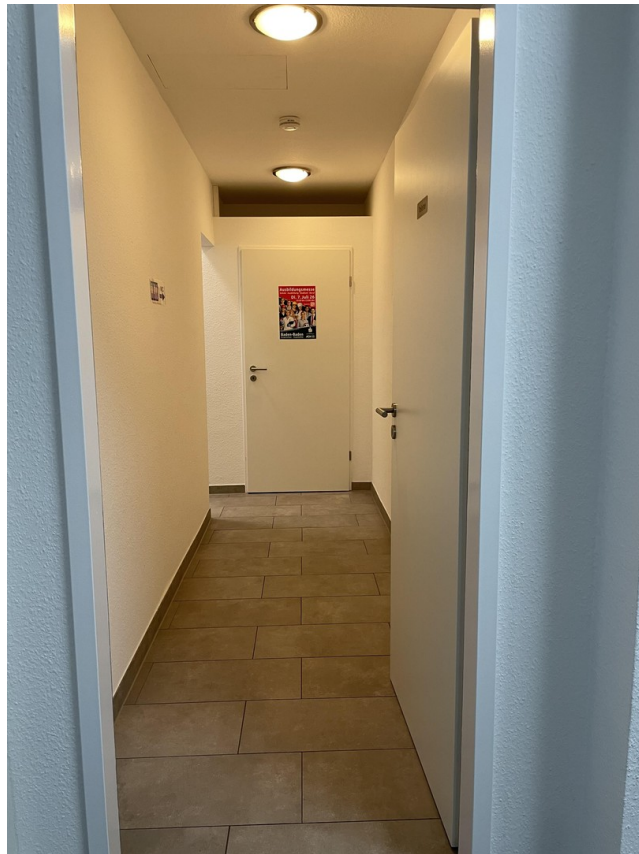
Toiletteneingang / Flur 2