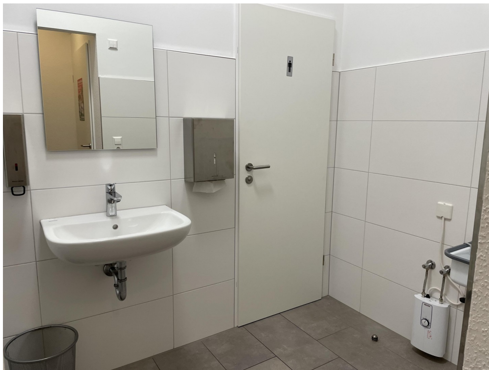
Toilettenbereich / Vorraum