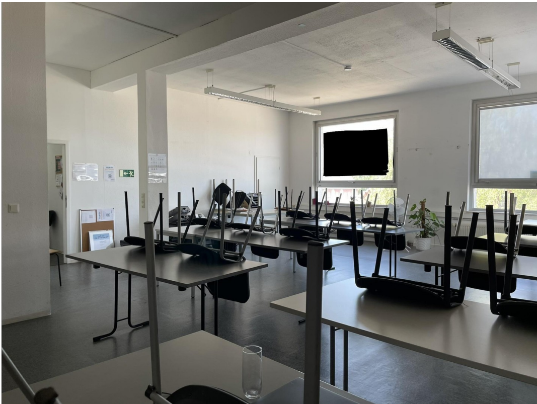
3. Raum / Schulung 1 / Bild 1