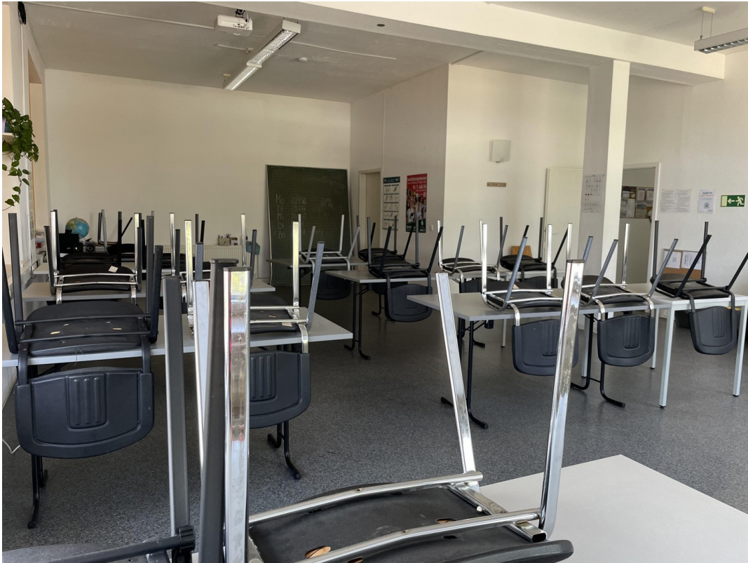
3. Raum / Schulung 1 / Bild 2