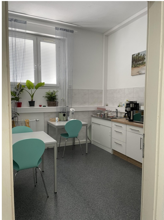
4. Raum / Personal