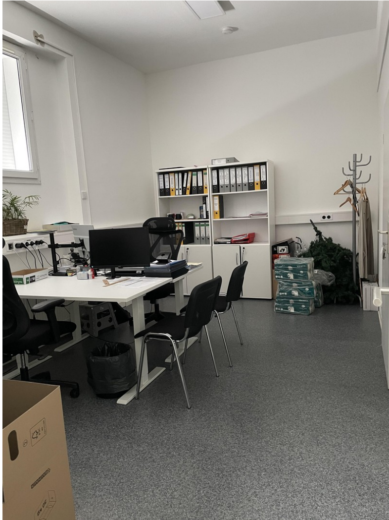
6. Raum / Büro 2 / Bild 2