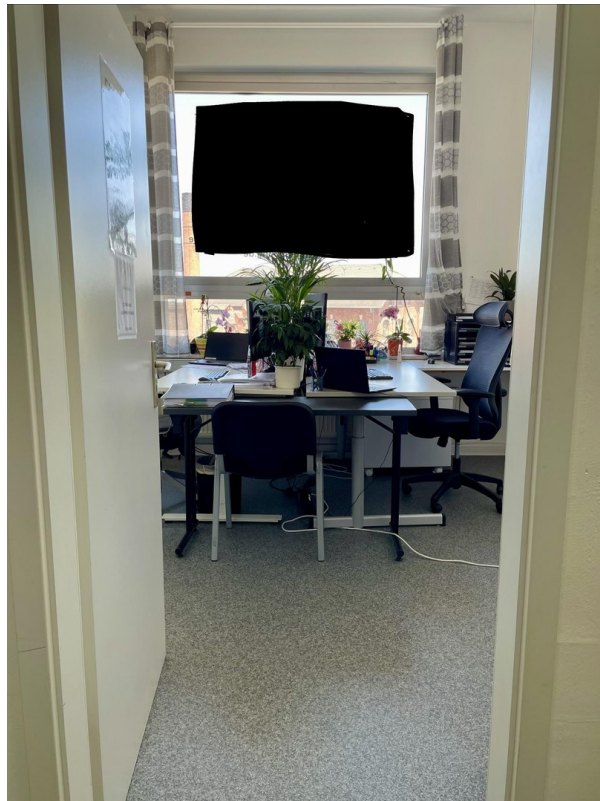
1. Raum / Büro 1 / Bild 1