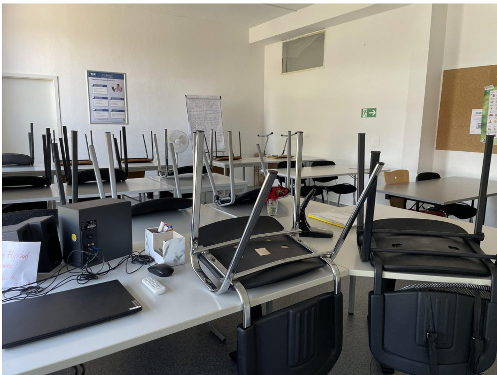
2. Raum / Schulung 2 / Bild 1