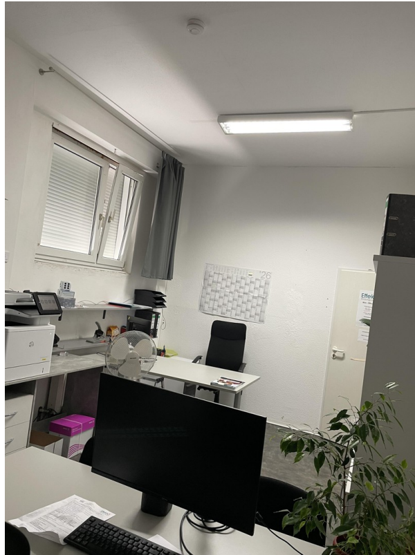
5. Raum / Anmeldung / Bild 2