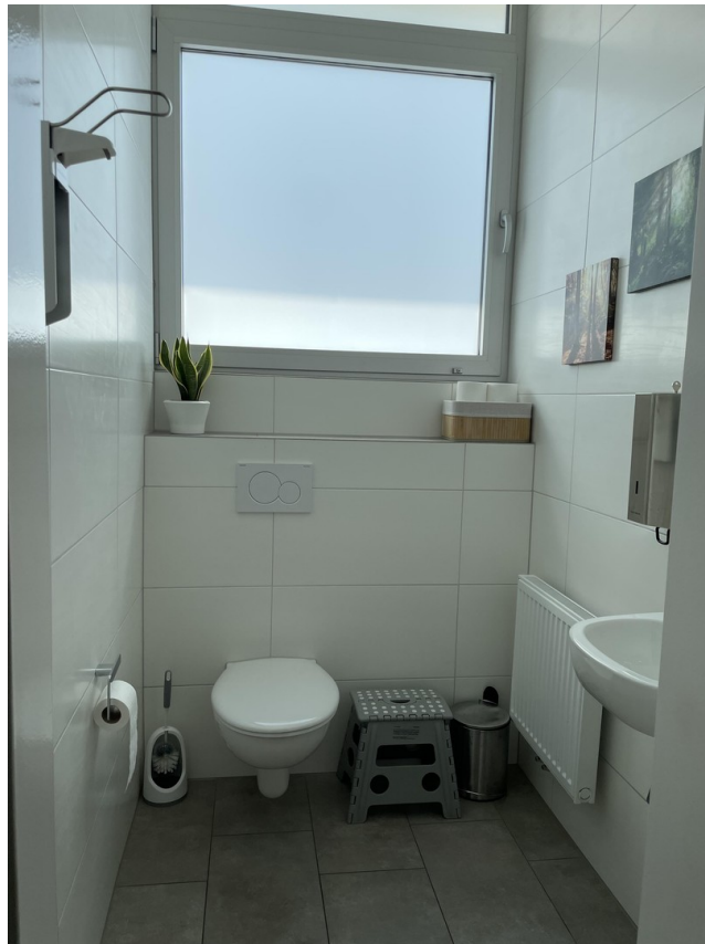
Toilettenbereich / WC-Damen