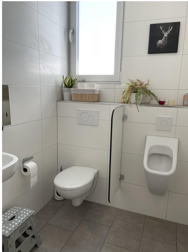
Toilettenbereich / WC-Herren