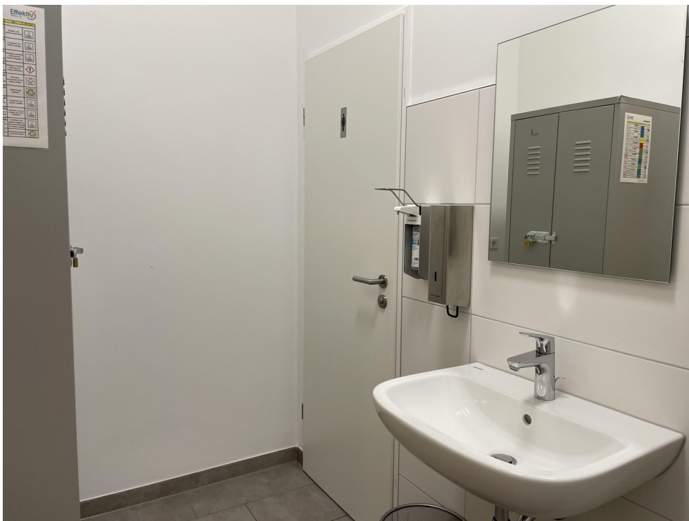
Toilettenbereich / Vorraum