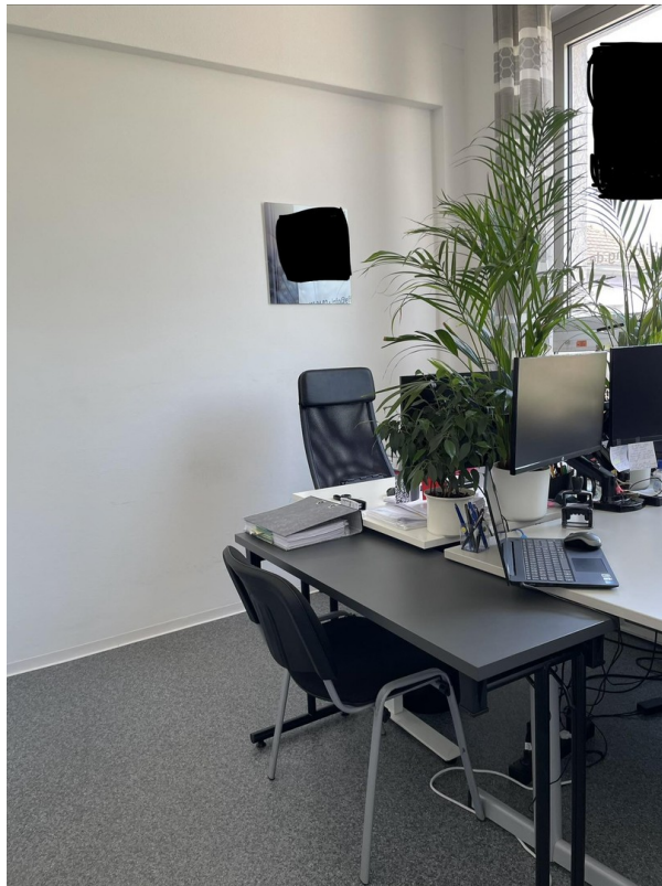
1. Raum / Büro 1 / Bild 3