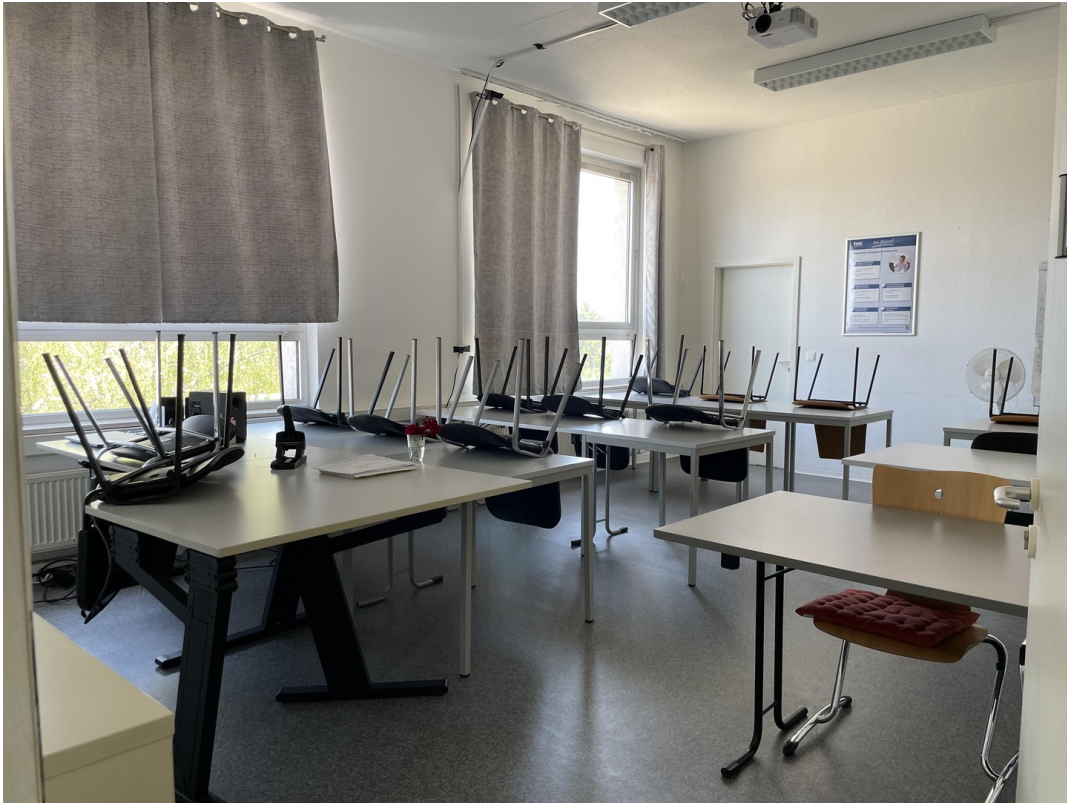
2. Raum / Schulung 2 / Bild 2