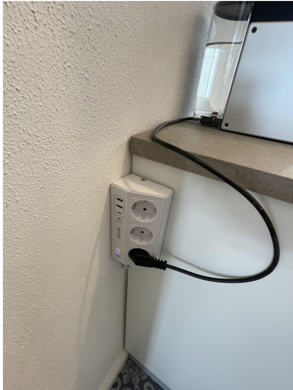
Stromanschluss mit USB