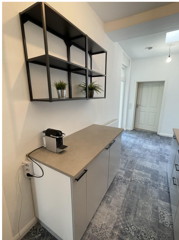
Einbauküche mit Sideboard und