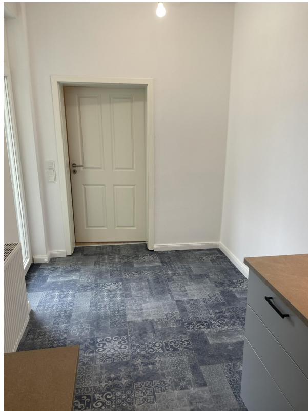
Platz für Küchentisch