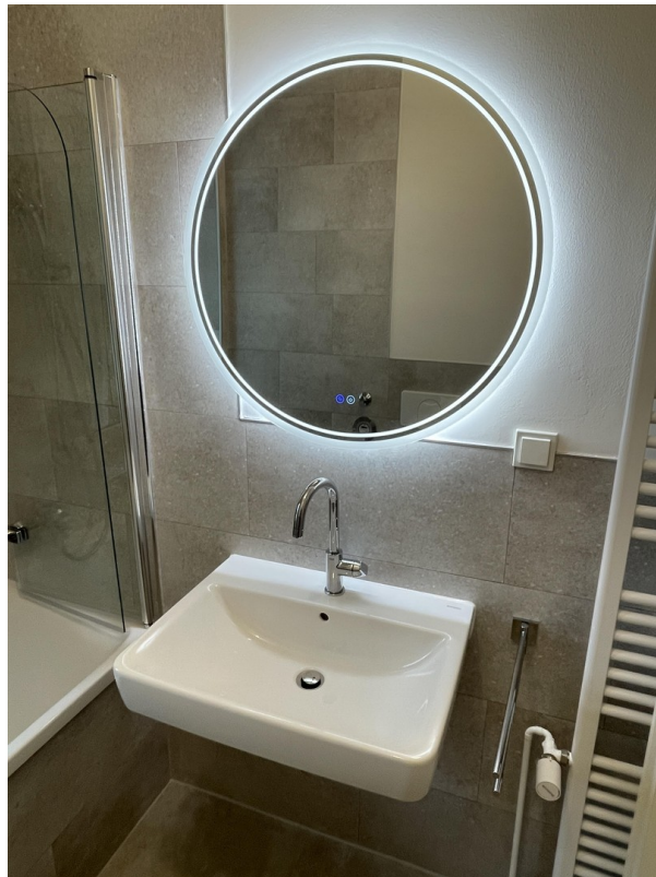
Bad mit LED Spiegel, dimmbar