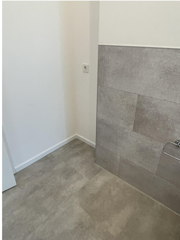
Platz für Waschmaschine