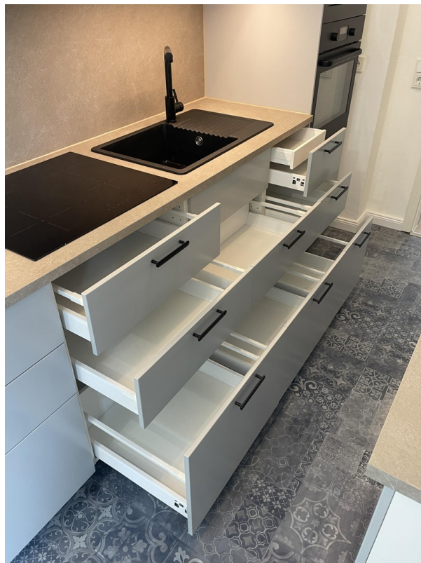
viele ausziehbare Fächer