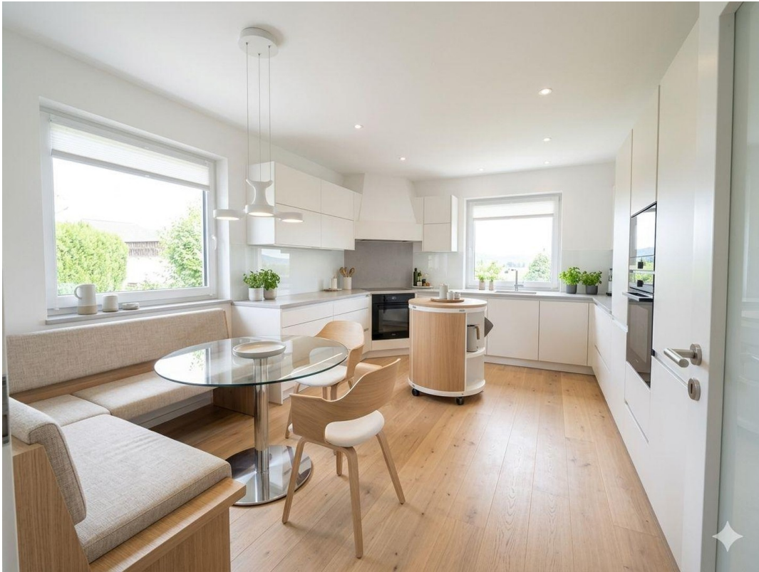
KI generiertes Beispiel