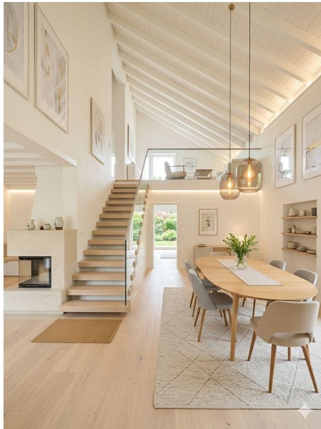
KI generiertes Beispiel