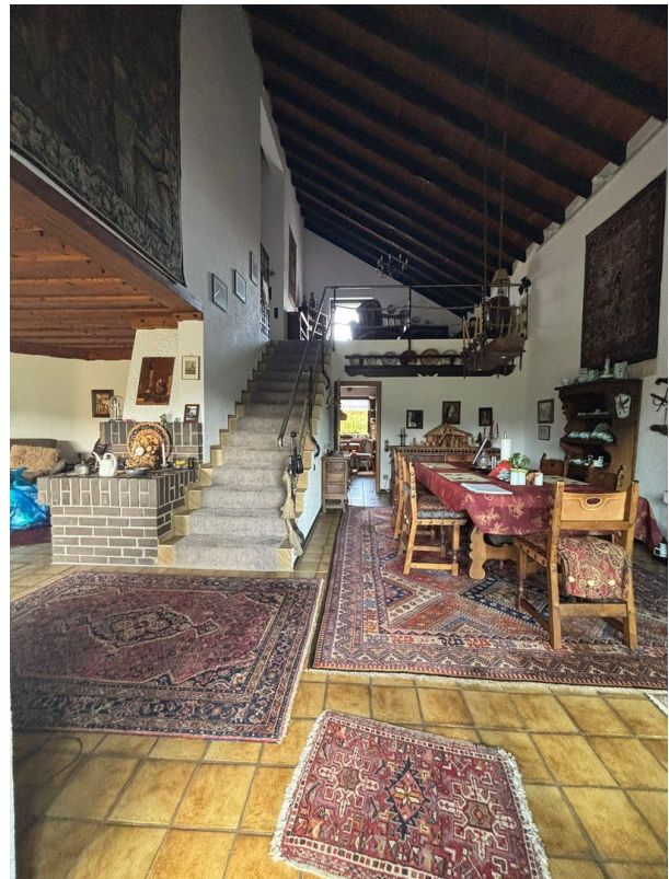
Essen & Galerie