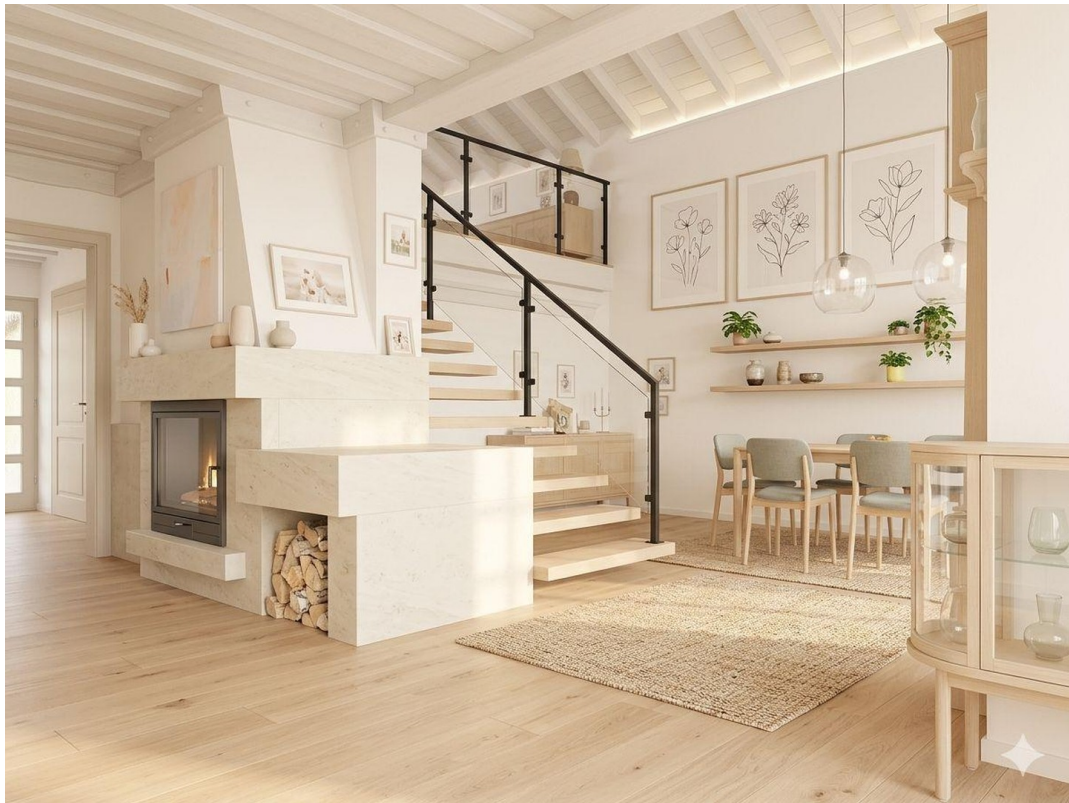
KI generiertes Beispiel