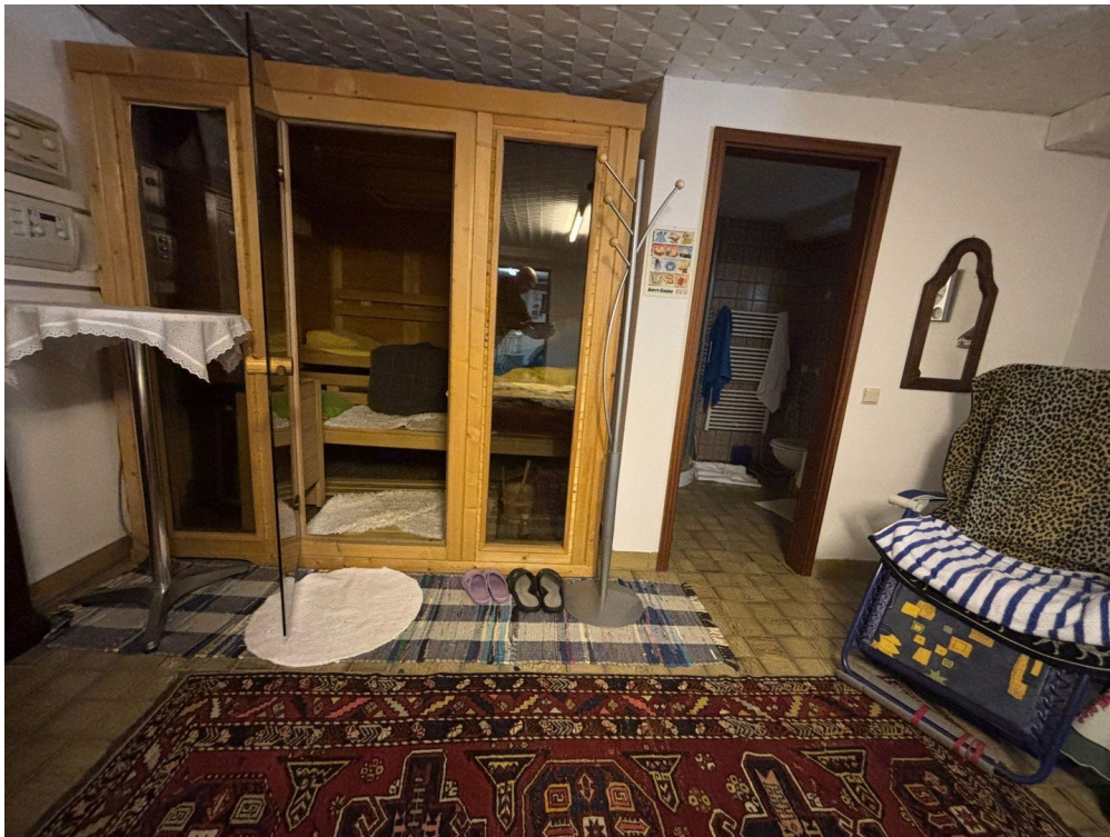
Sauna mit Duschbad