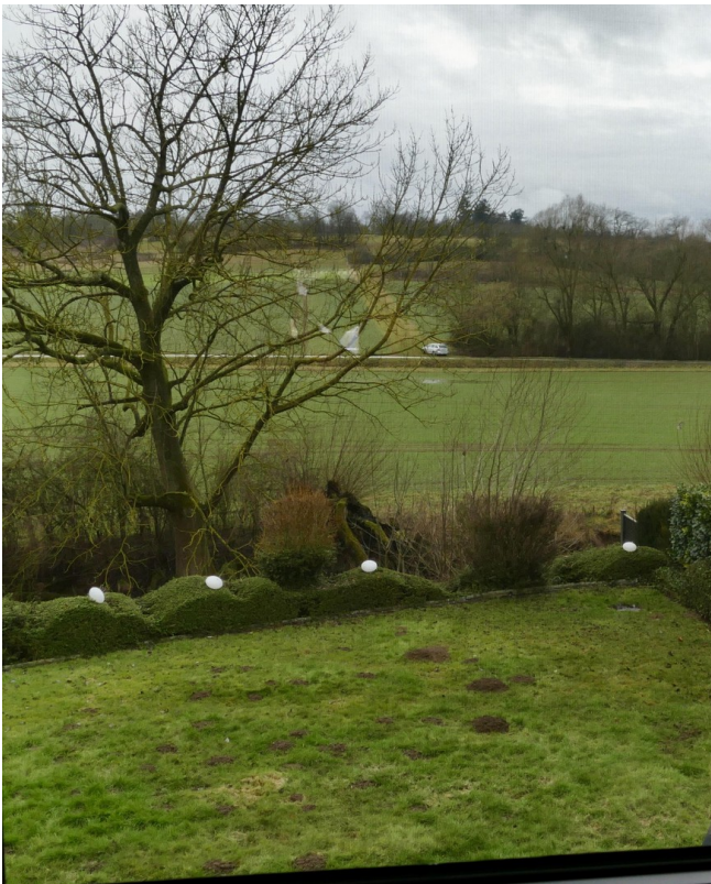
Blick in das Naturschutzgebiet