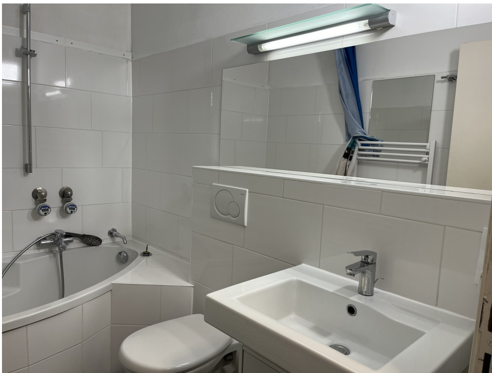
Bad - Waschbecken, WC