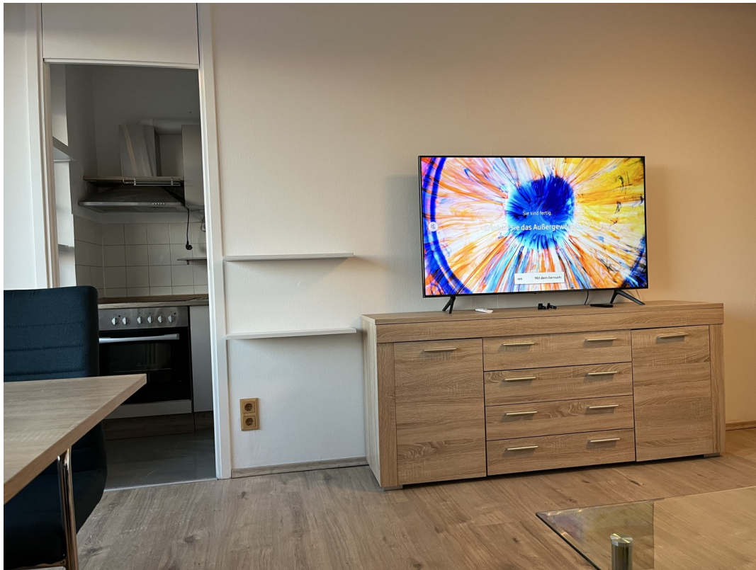
Wohnzimmer mit Eingang Küche