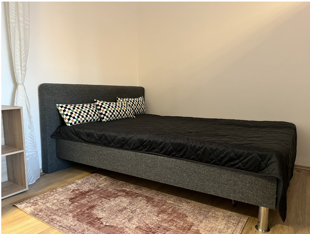
Schlafbereich mit Doppelbett