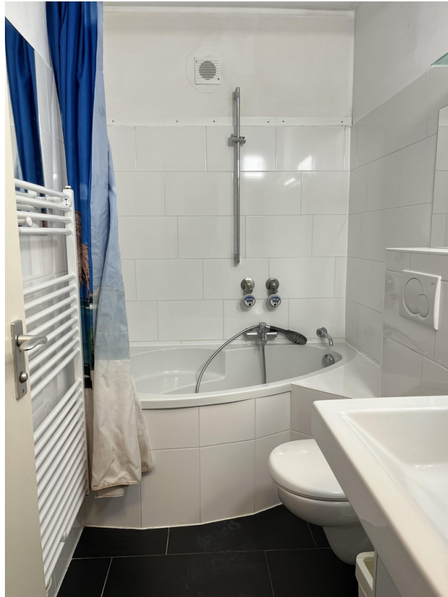
Bad - Duschbadewanne