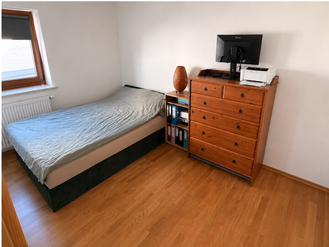
Arbeiten / Kind / Ankleide