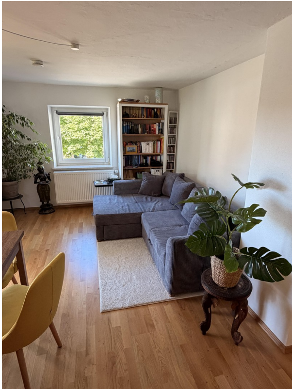
Wohne / Essen