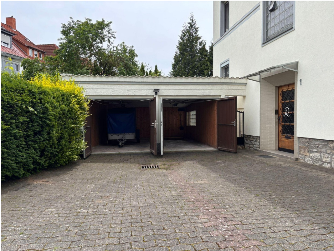
Doppelgarage mit Stellplatz