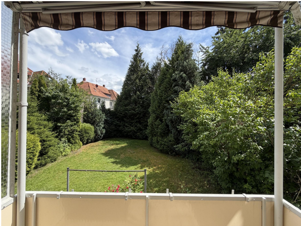
Südbalkon-Blick in Garten