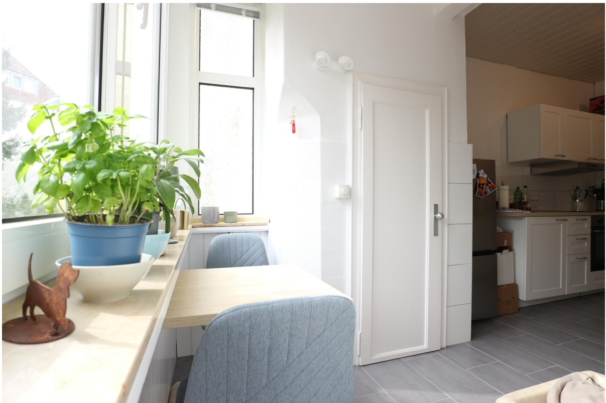
Küche mit Speisekammer