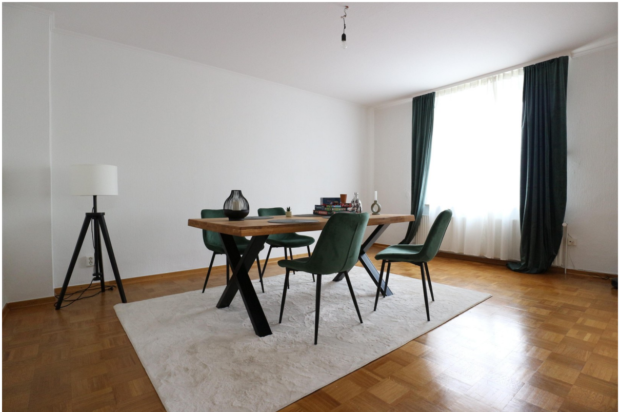
Raum 2 (Einrichtungsbsp.)