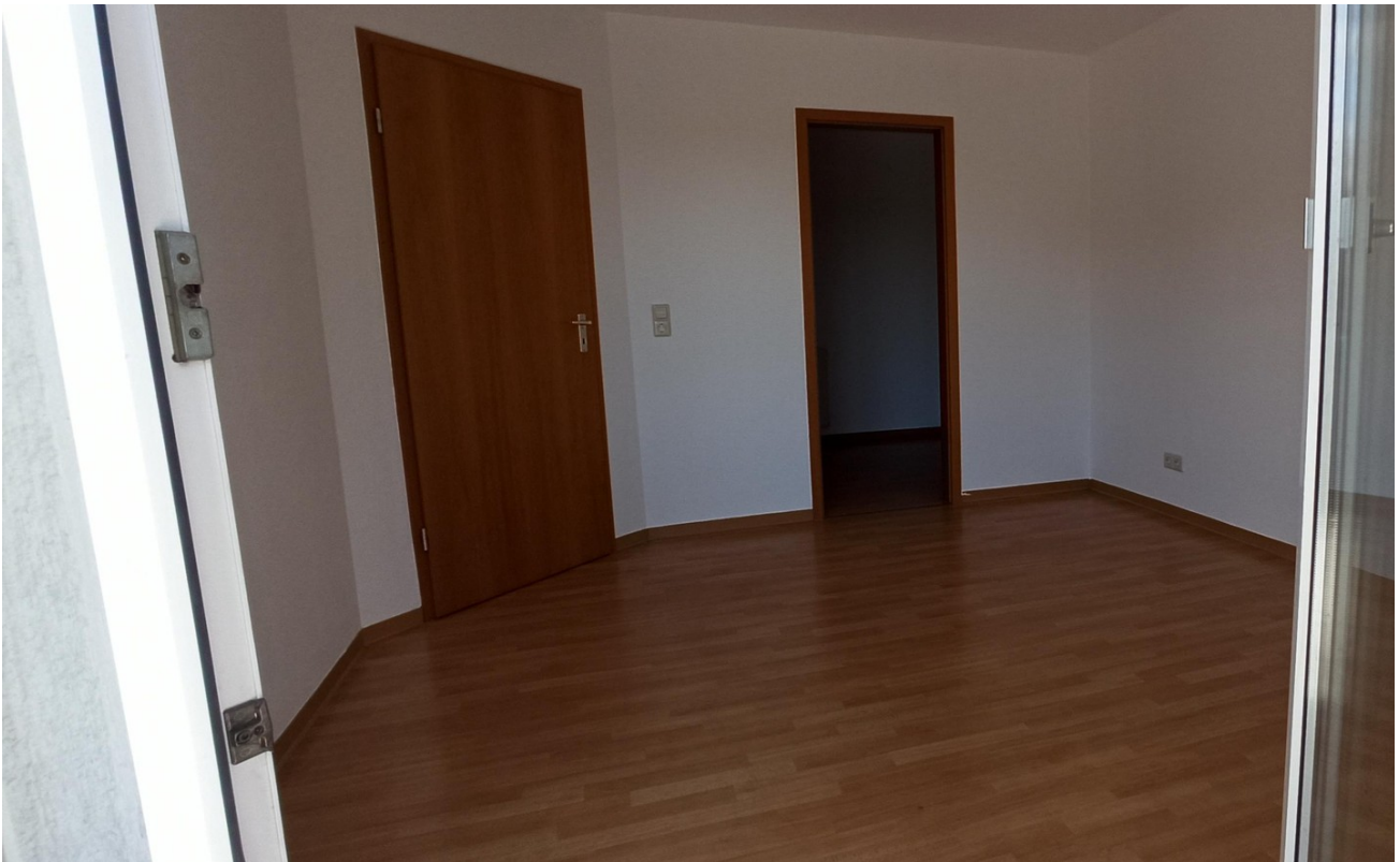
Schlafen mit Ankleide