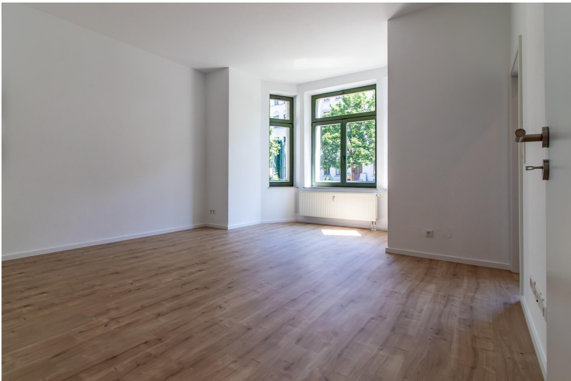
Wohnzimmer mit Erker