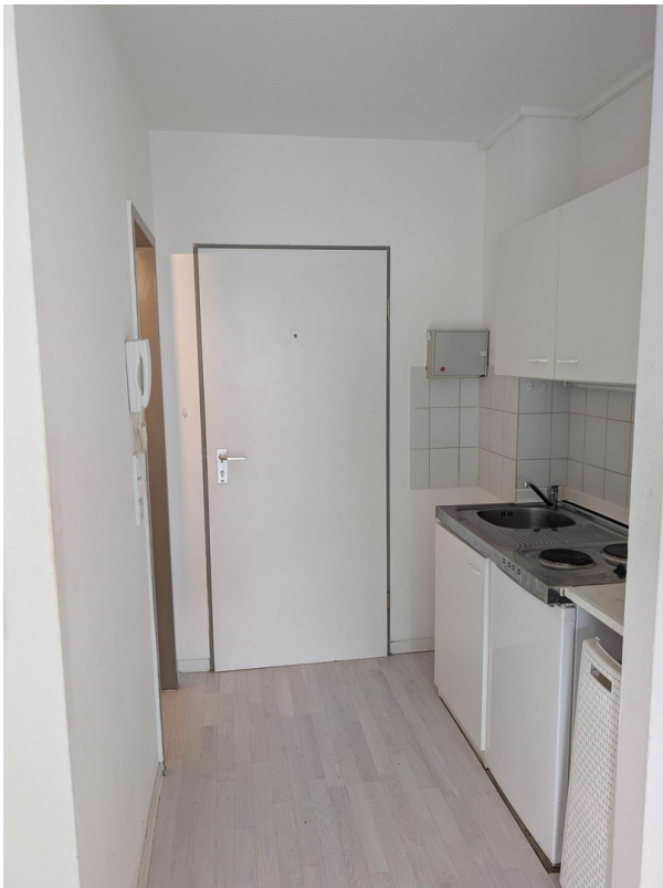
Eingangsbereich mit Küche