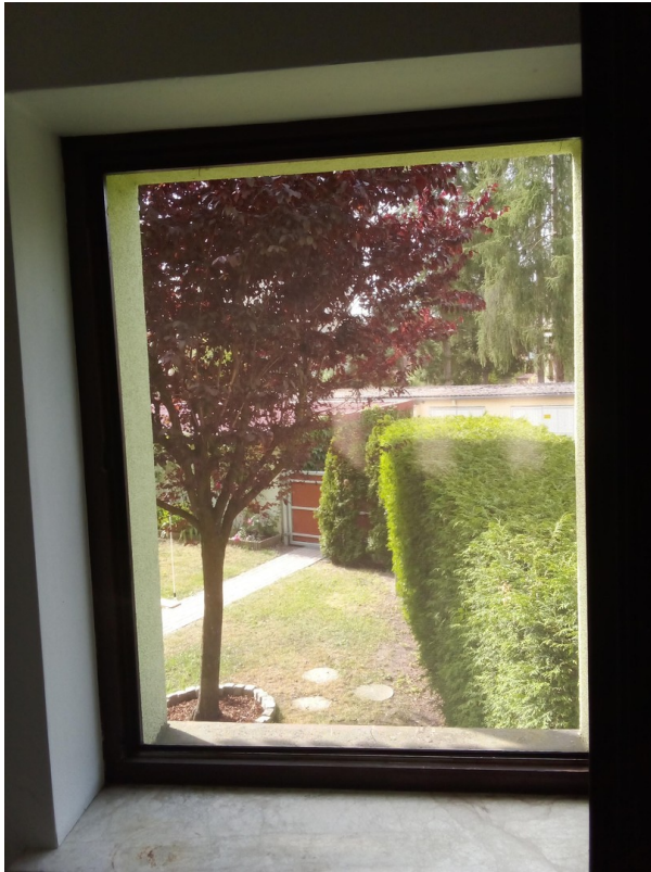
Ausblick vom Schlafzimmer