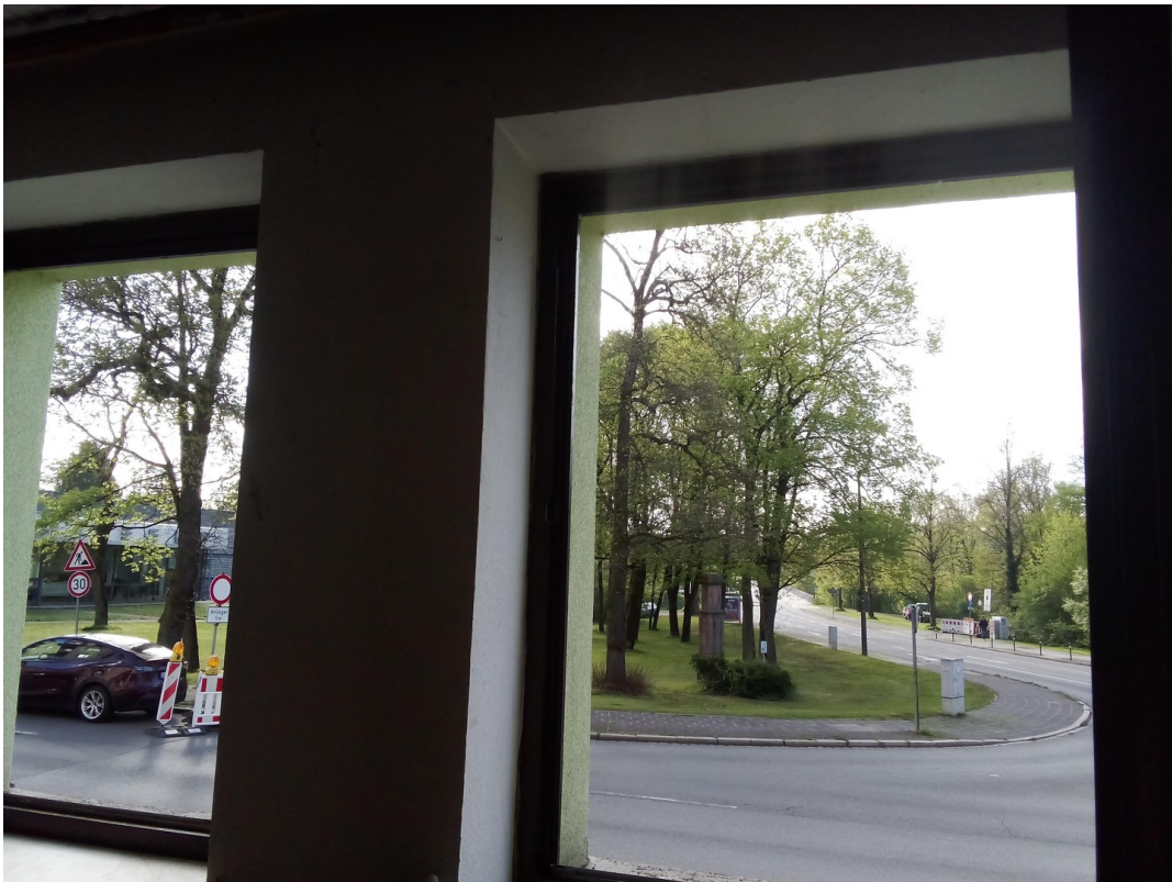
Ausblick vom Wohnzimmer