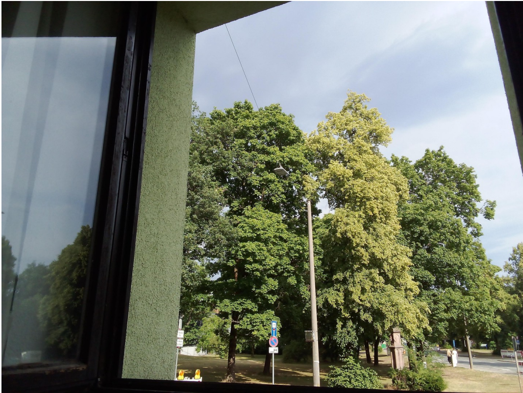
Ausblick vom Wohnzimmer