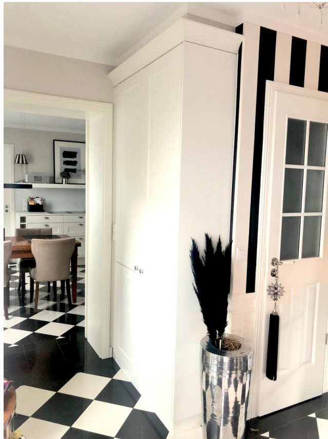
Garderobe / Gästebad