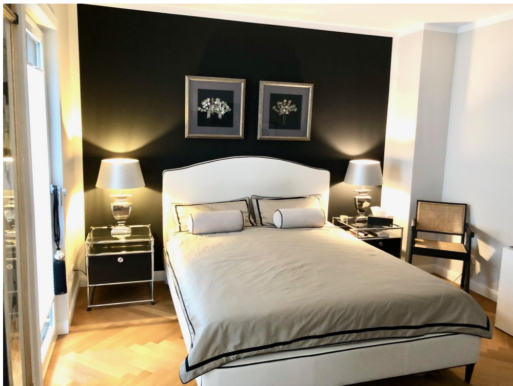
großes Zimmer OG