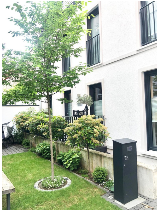
Terrasse EG / Innenhof