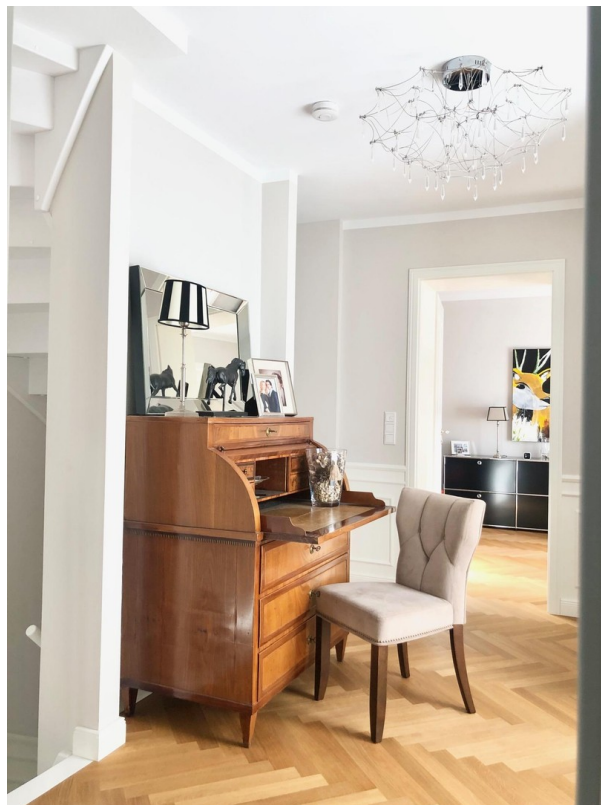
große Diele OG