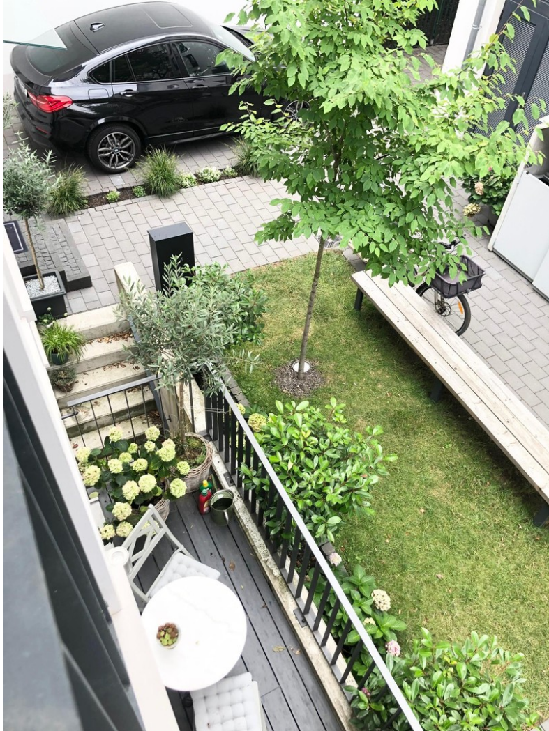
Blick auf Innenhof