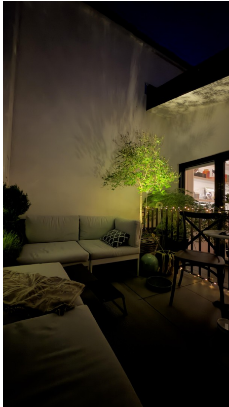
Terrasse DG beleuchtet