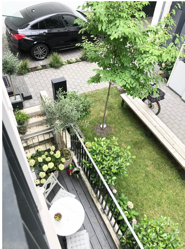
Blick auf den Innenhof