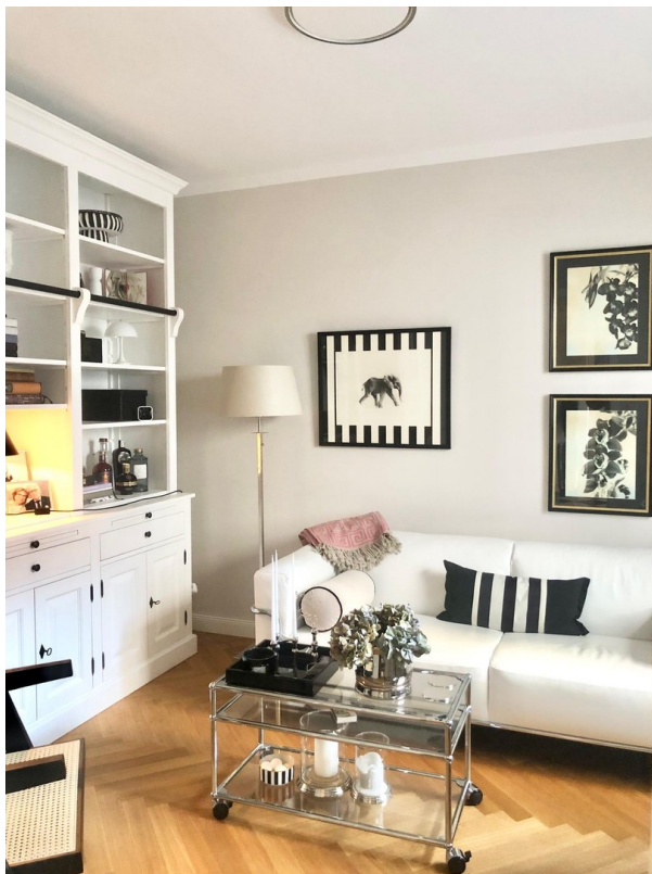
Zimmer im EG