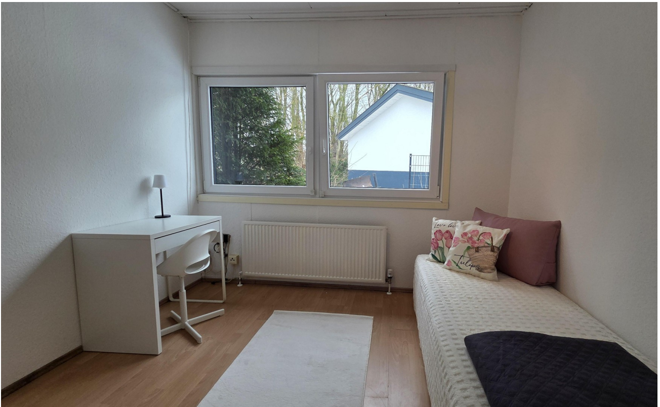
Gäste- oder Arbeitszimmer