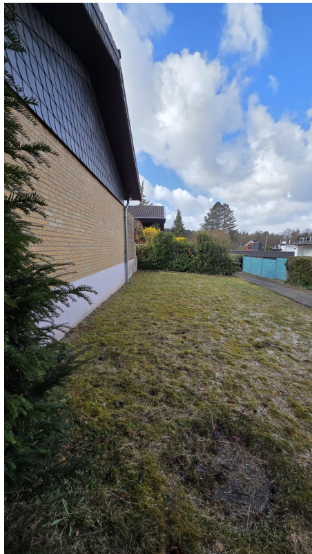
Rasenfläche hinter dem Haus