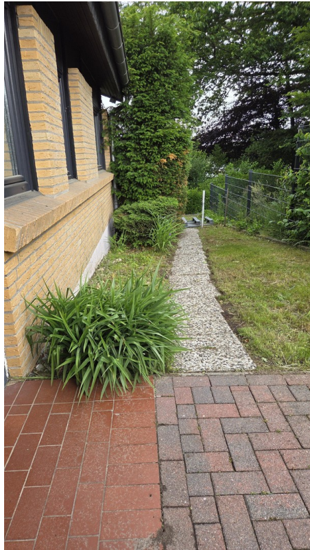
Weg von Haustür zur Rückseite