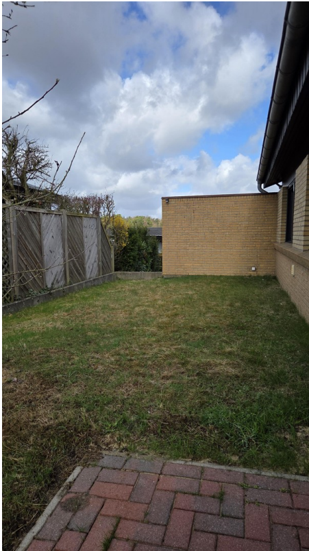
Gartenzugang vom Wohnzimmer au