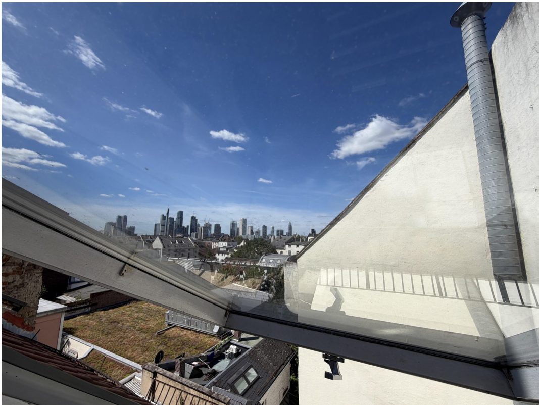
Ausblick aus dem Badezimmer