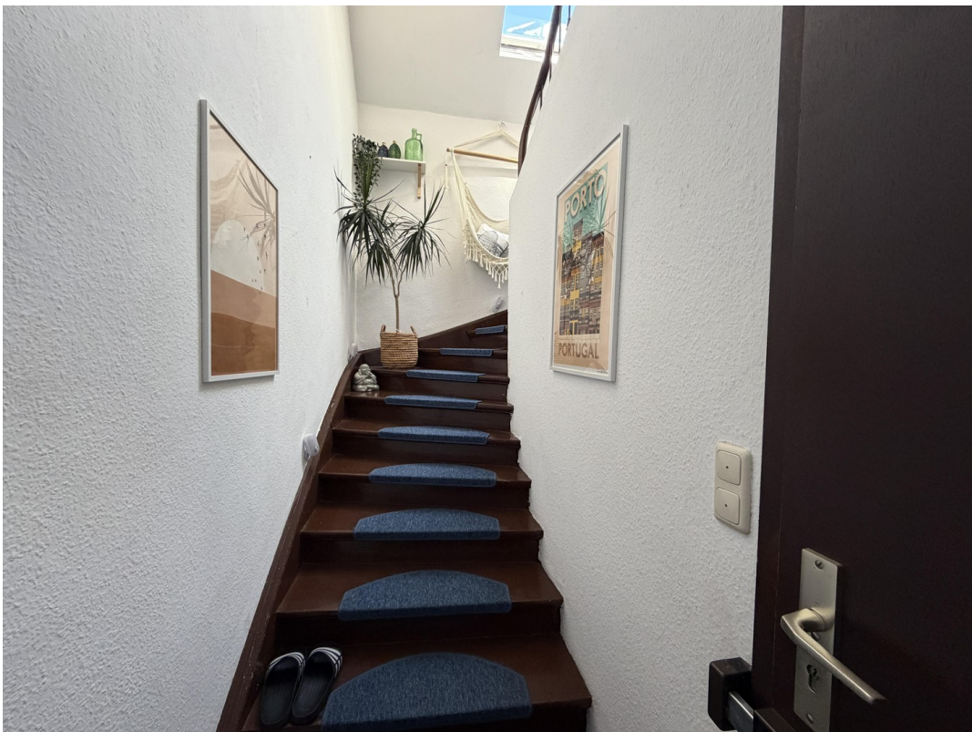
Eingangsbereich zur Wohnung