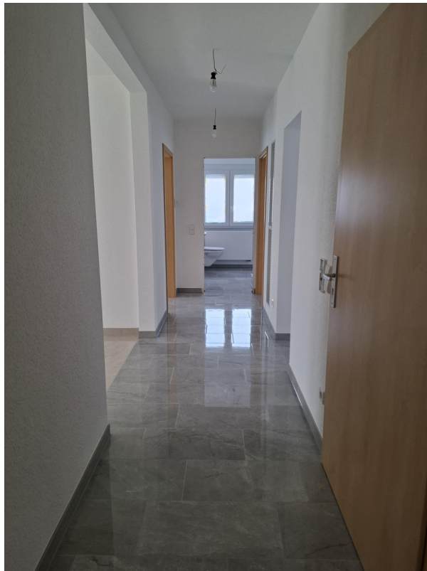
Flur Richtung Bad