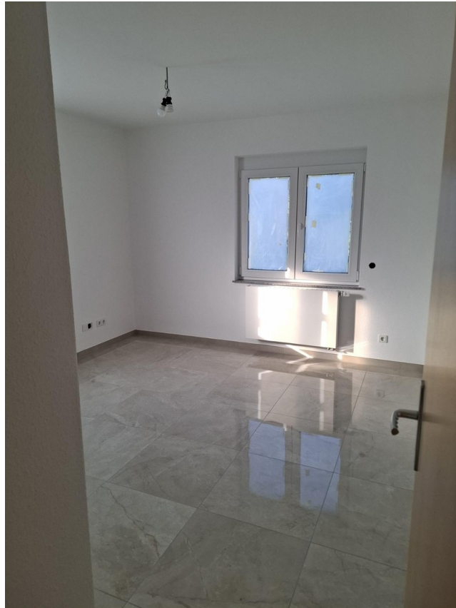
Kind / Büro