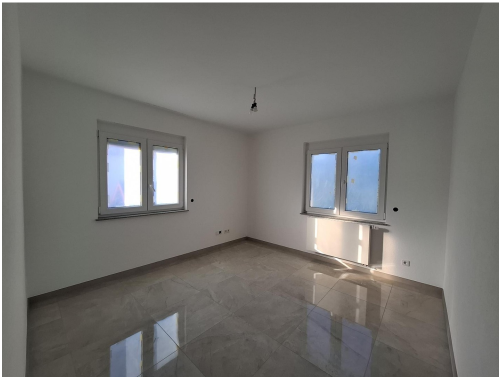
Kind / Büro