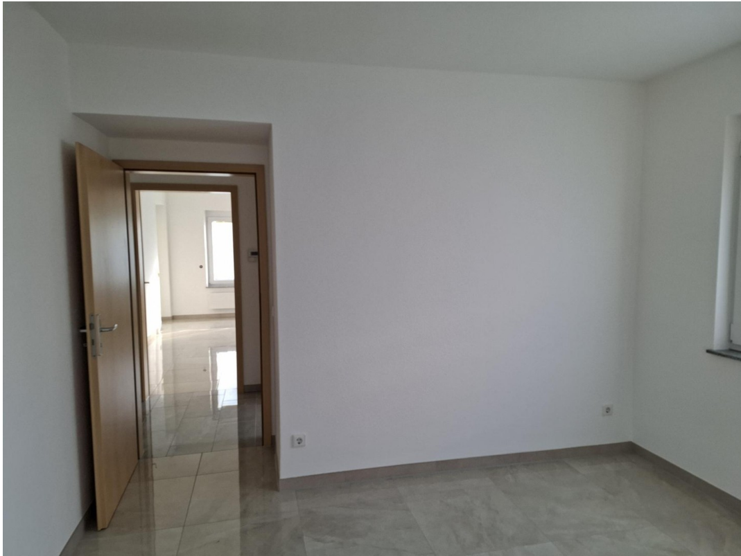
Kind / Büro