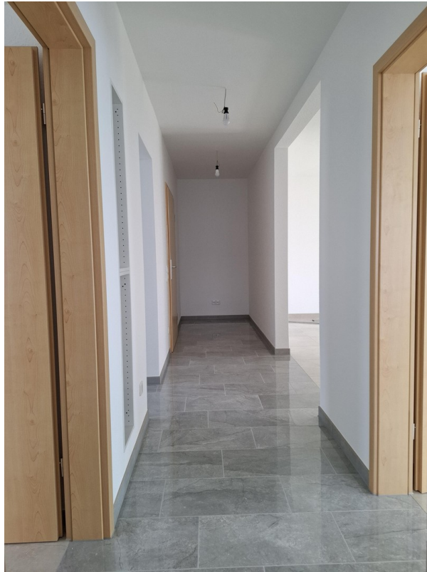
Flur Richtung Wohnungstür