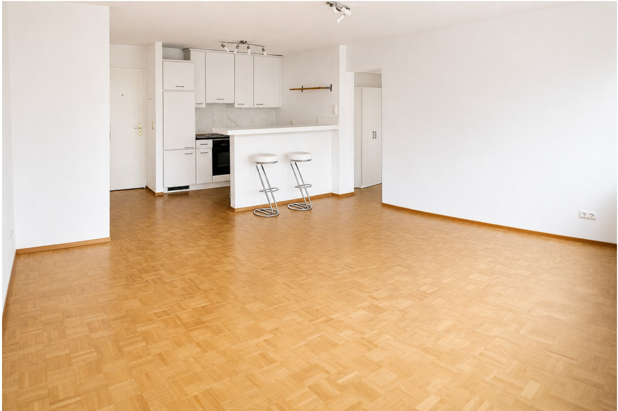
Wohnzimmer Beispiel Küche Weiß