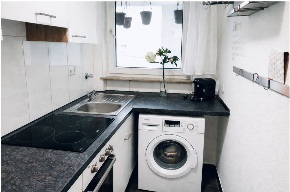
Küche mit neuem Ceranfeld