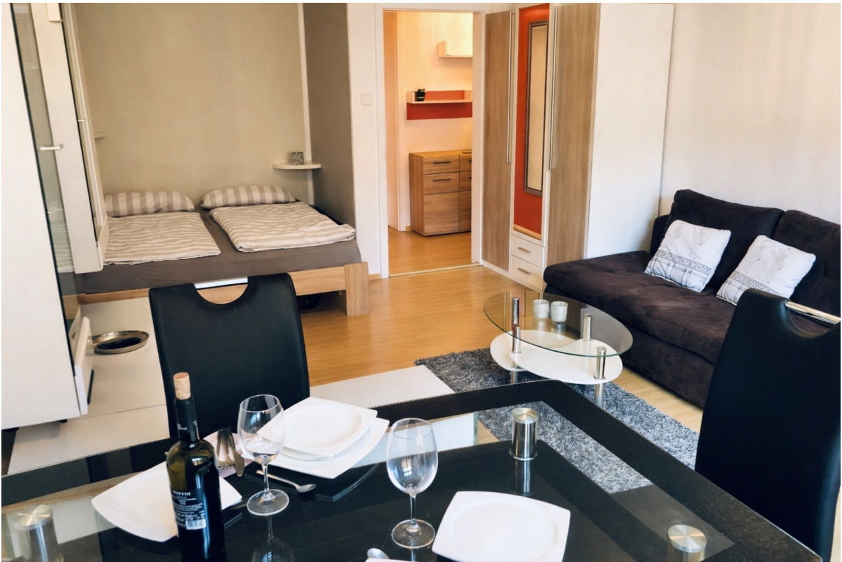
Wohnbereich mit Schlafnische