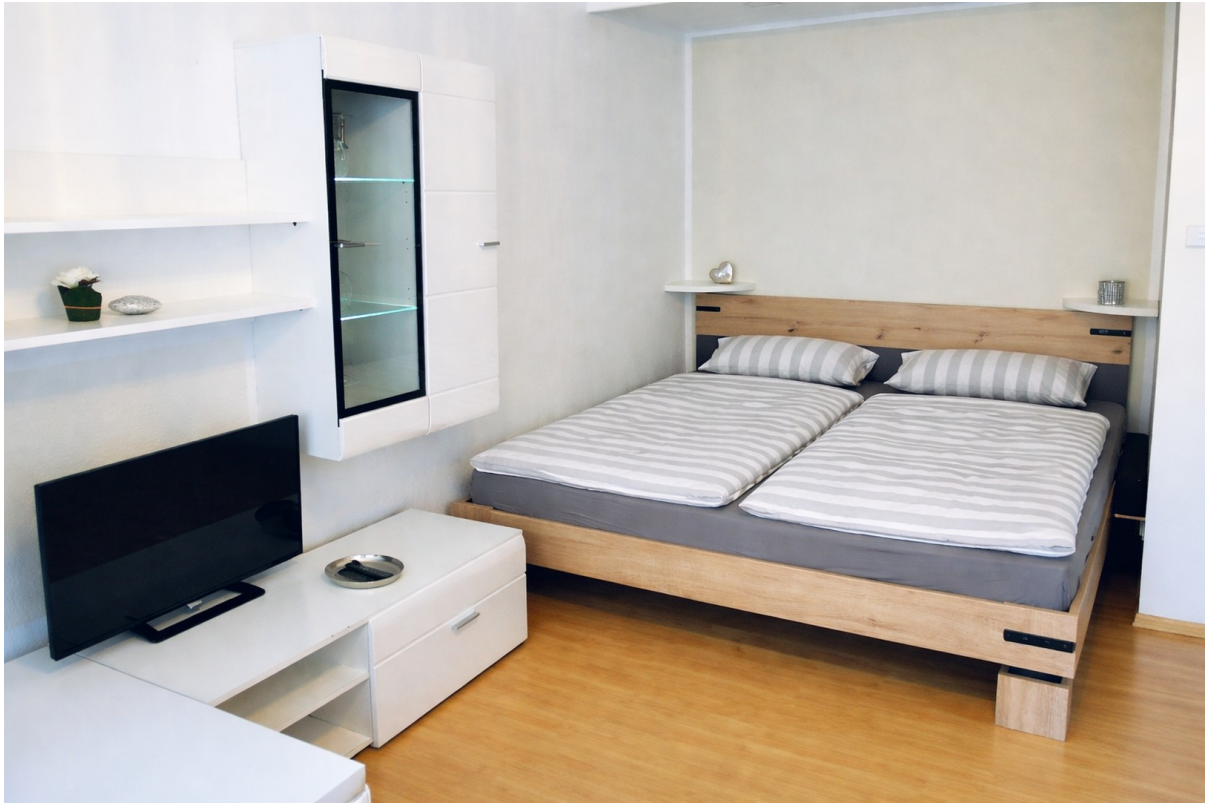
Schlafbereich mit neuem Bett