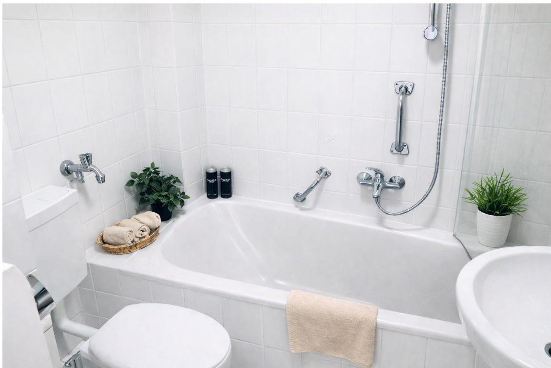
Bad Beispiel weiß streichen