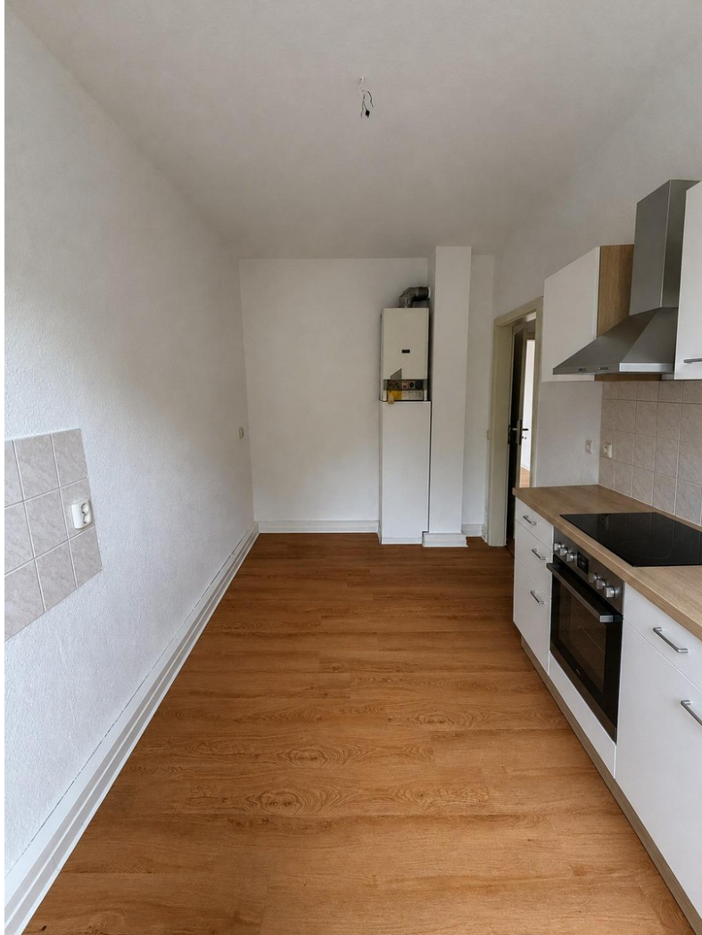
Ihre neue Küche Foto 2