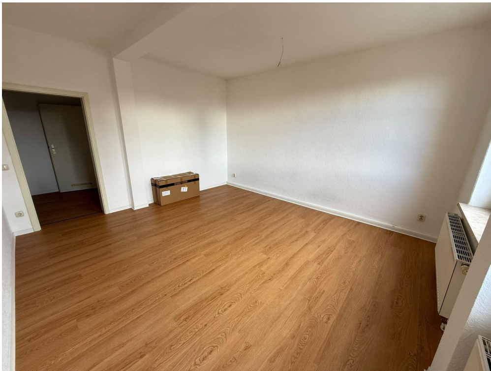
Zimmer 1 Foto 2