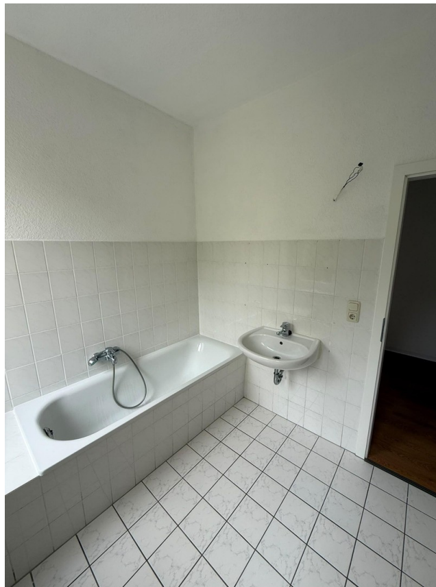
Bad Foto 2