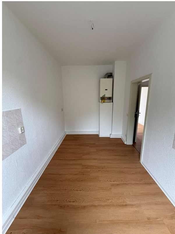
Küche Foto 2