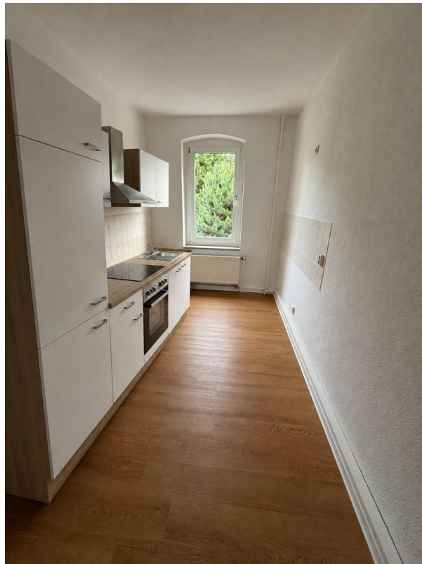
Ihre neue Küche