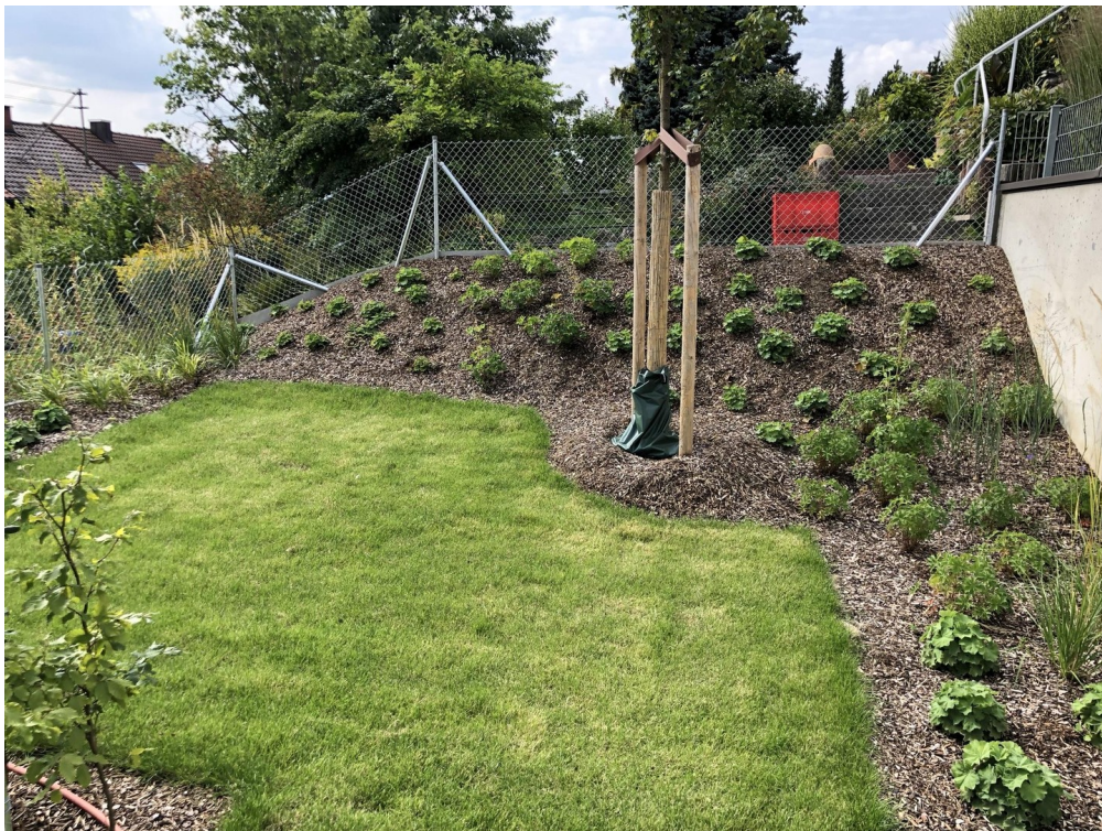
Ausblick ins Grüne