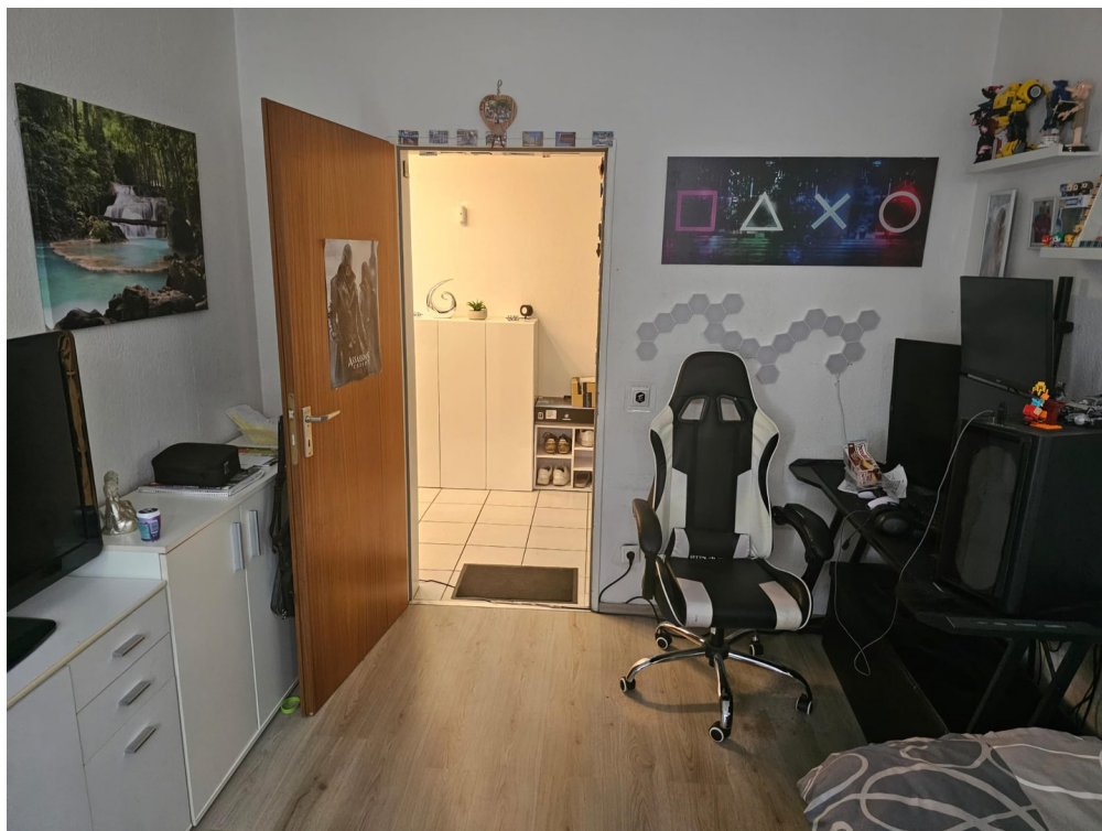
Kinderzimmer 1 von 2