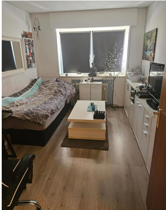
Kinderzimmer 2 von 2