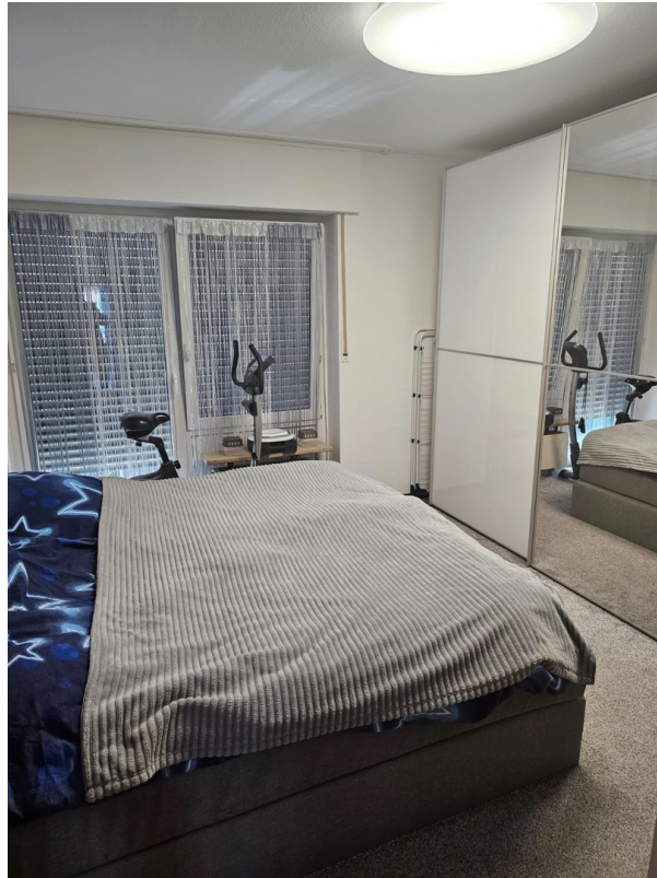
Schlafzimmer 2 von 2