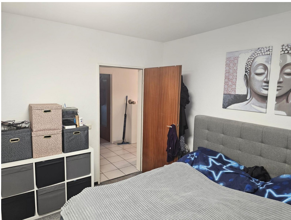
Schlafzimmer 1 von 2