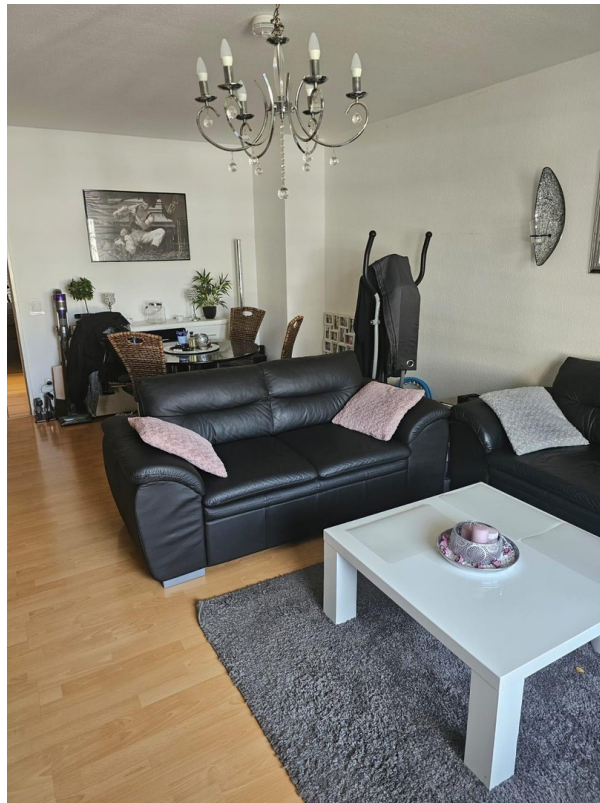
Wohnzimmer 2 von 2