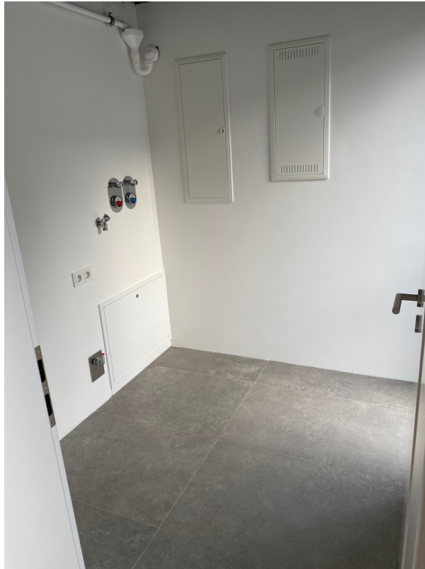
Abstellraum / HWR