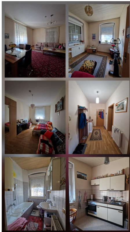
Bewohnter Zustand Heute