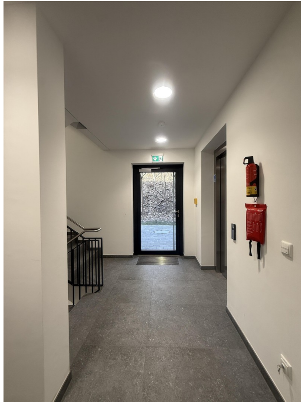
Hauseingang Eingang mit Aufzug