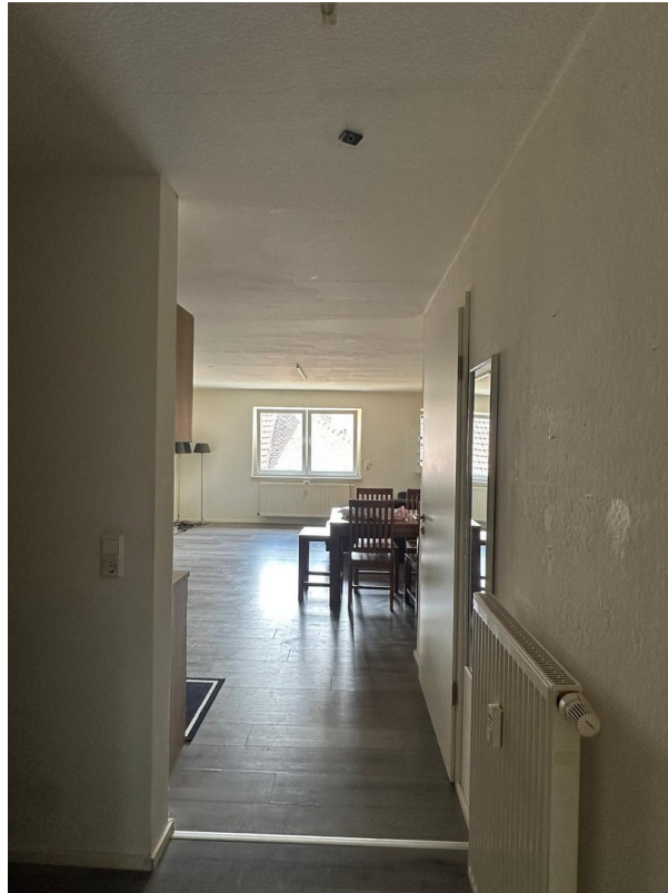
Ansicht Wohnbereich Flur