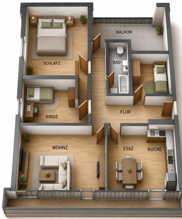
mit KI erstellt