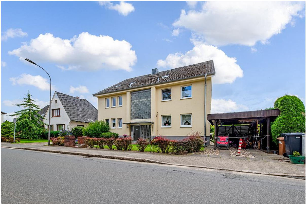
Ansicht von der Straße