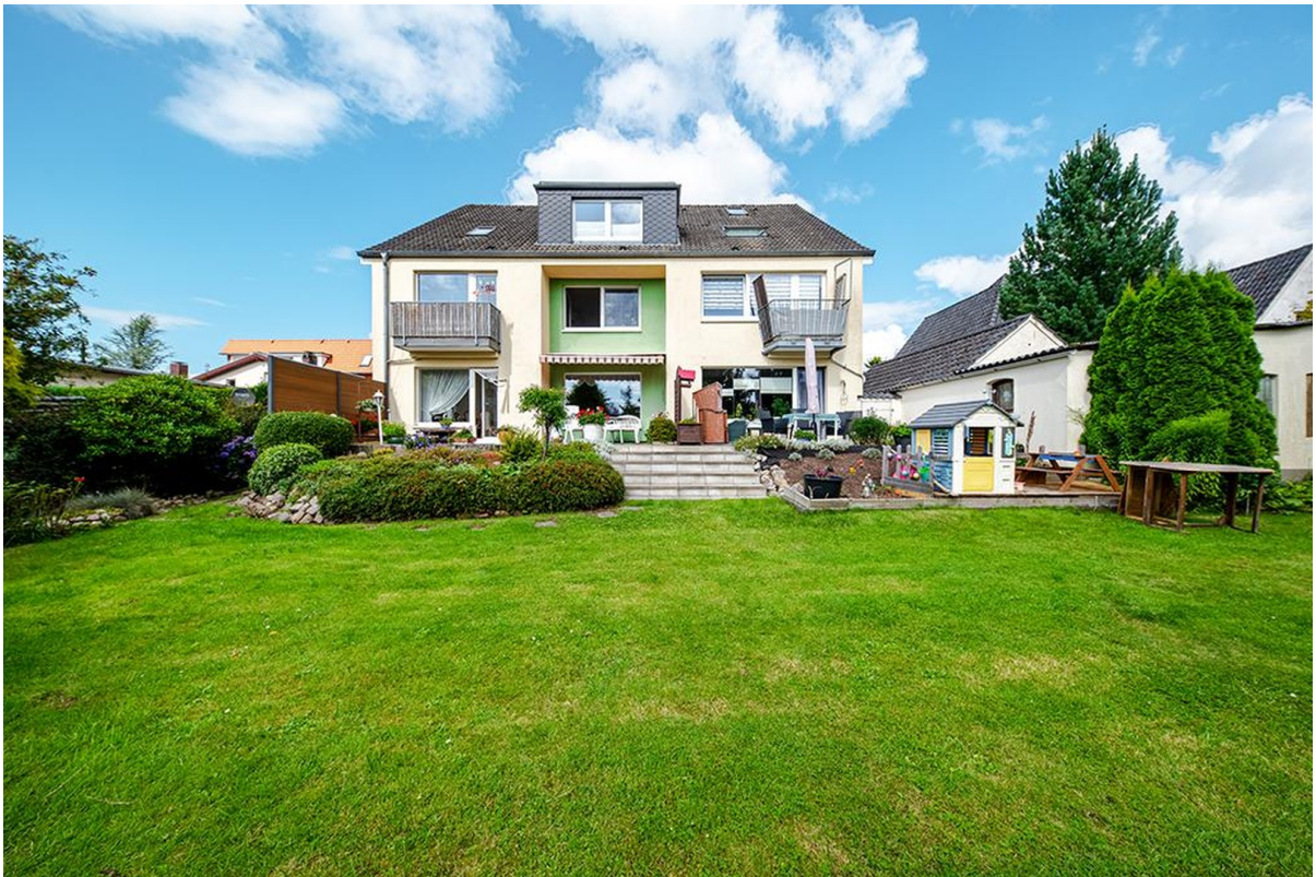
Blick aus dem Garten