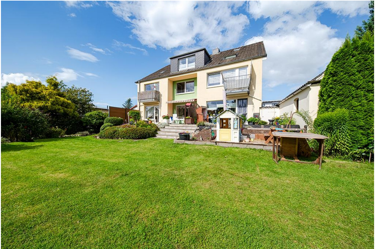
Blick aus dem Garten