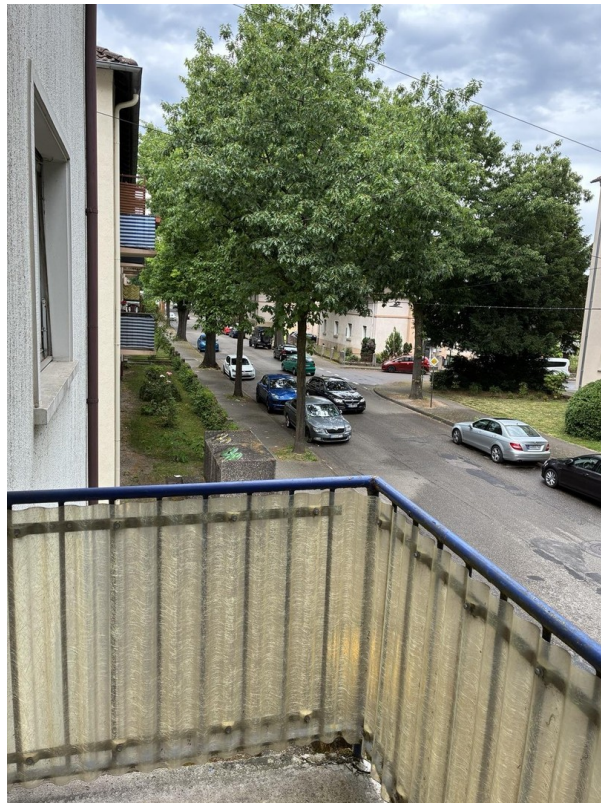
Balkon / Ausblick