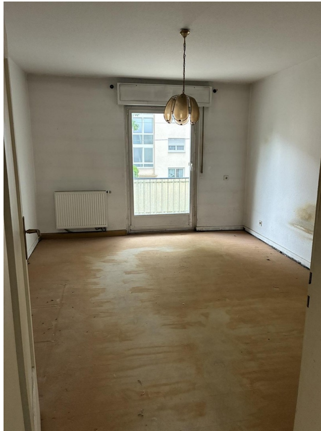
Ist-Zustand Wohnzimmer mit Bal