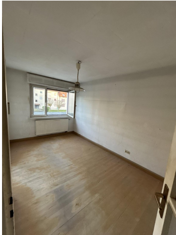
Ist-Zustand Zimmer 3