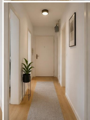
Visualisierung Bad und Flur