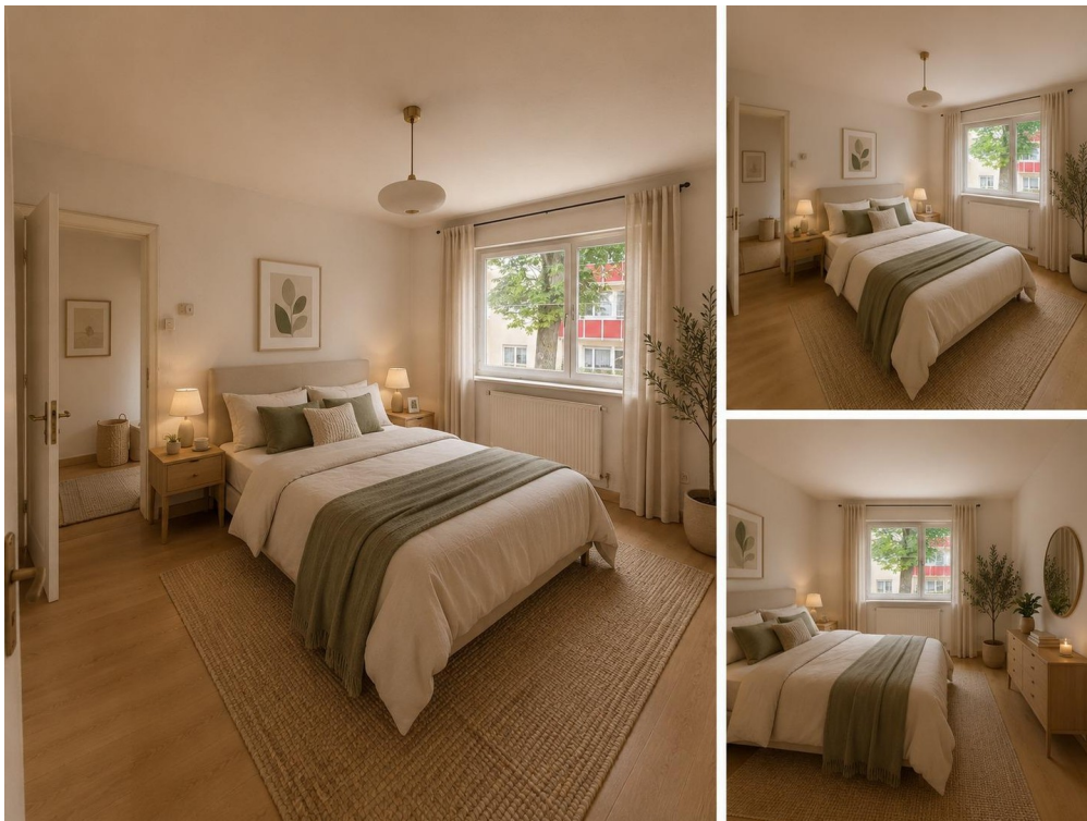
Visualisierung weiteres Zimmer