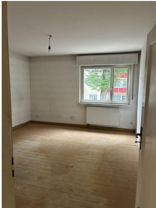
Ist-Zustand Zimmer 2