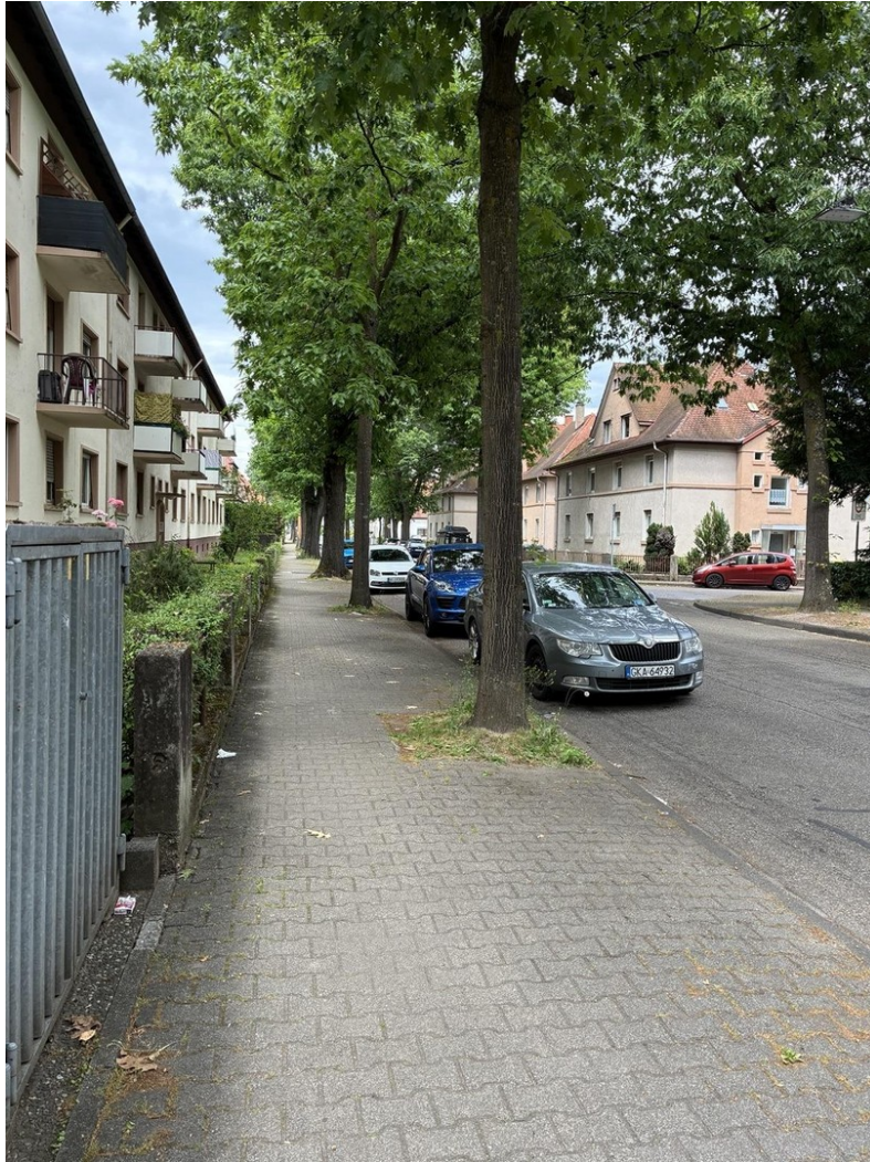
Straße / Umfeld