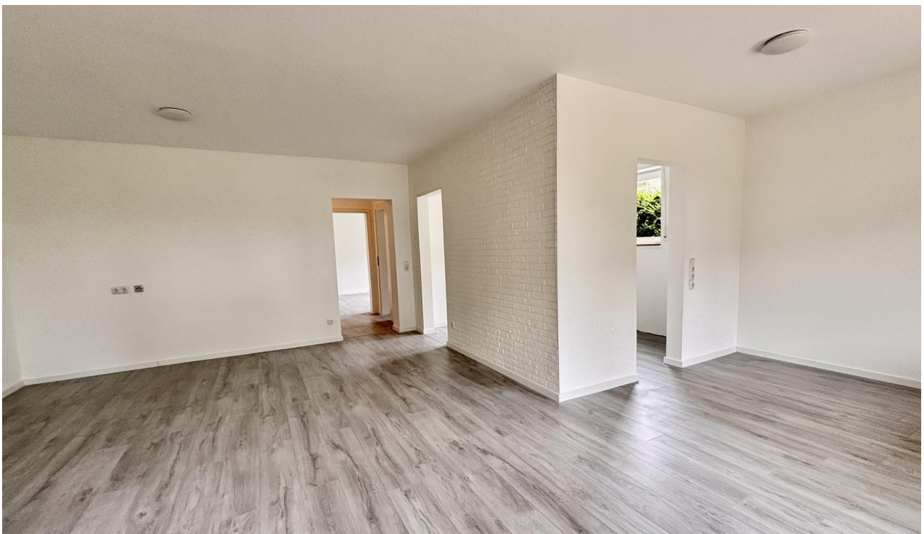
Wohnzimmer und Esszimmer