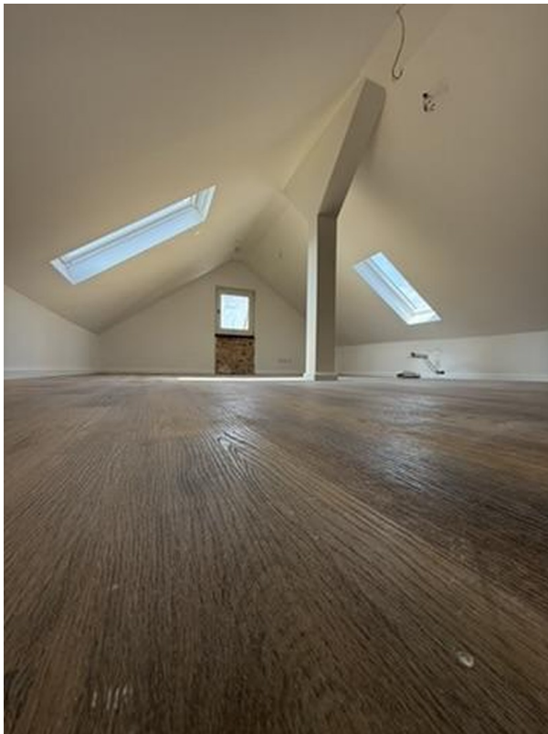
Die Fläche im Dachspitz