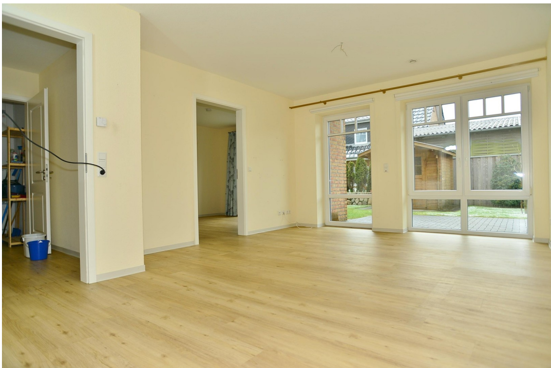
Wohnzimmer ähnliche Wohnung