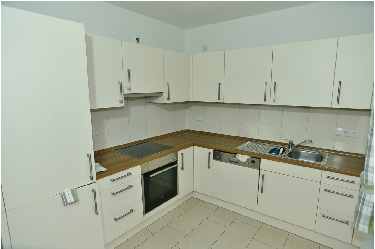
Küche ähnliche Wohnung