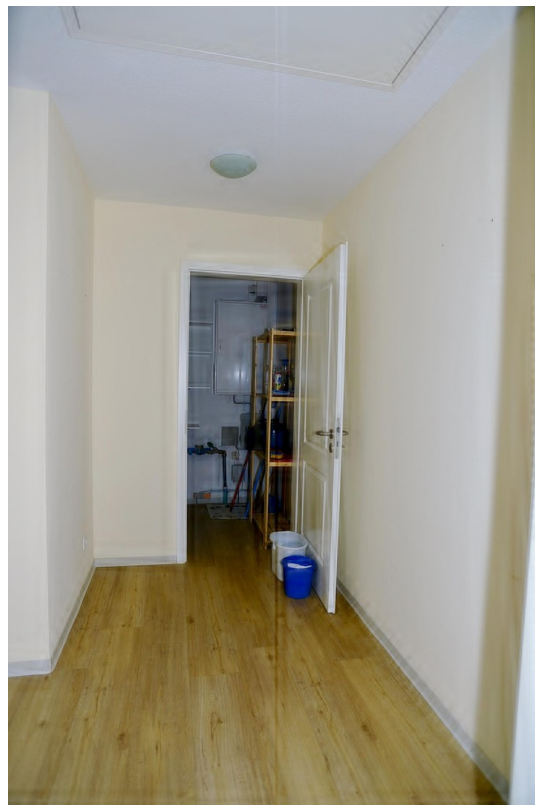
Flur HWR ähnliche Wohnung