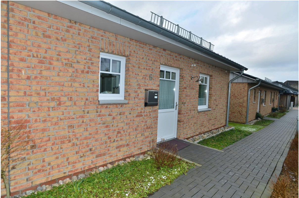
Zugang zu den Häusern