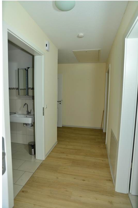
Flur ähnliche Wohnung