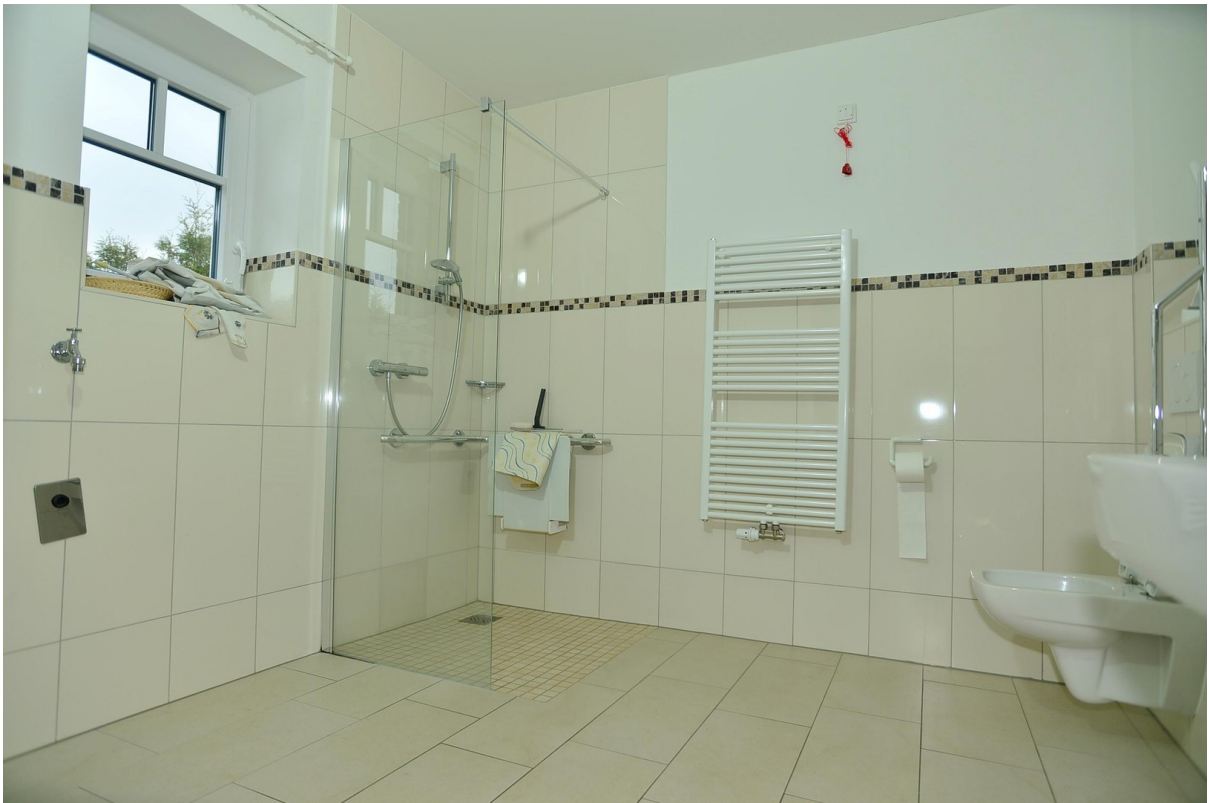
Bad ähnliche Wohnung