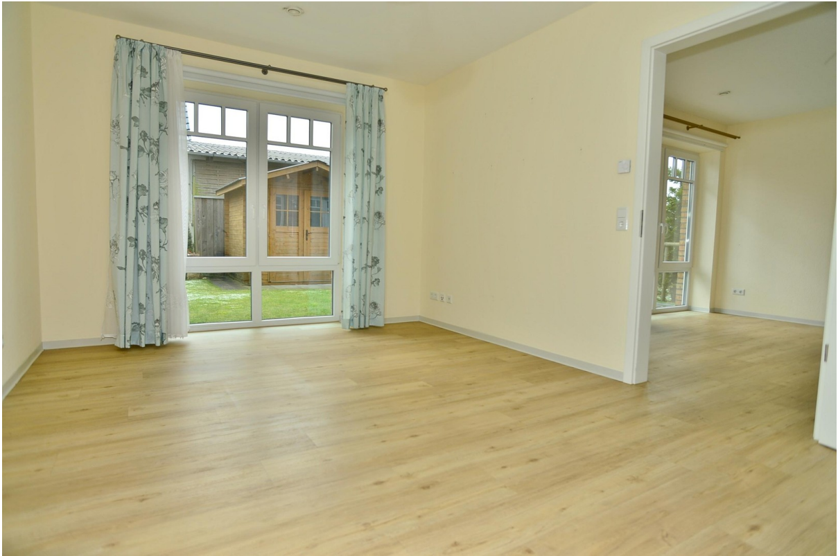
Zimmer ähnliche Wohnung