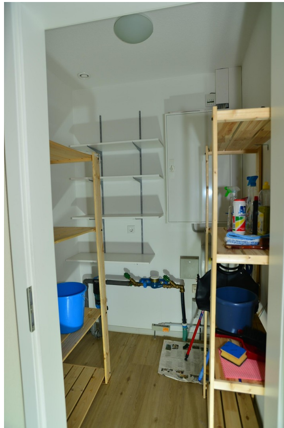
HWR ähnliche Wohnung