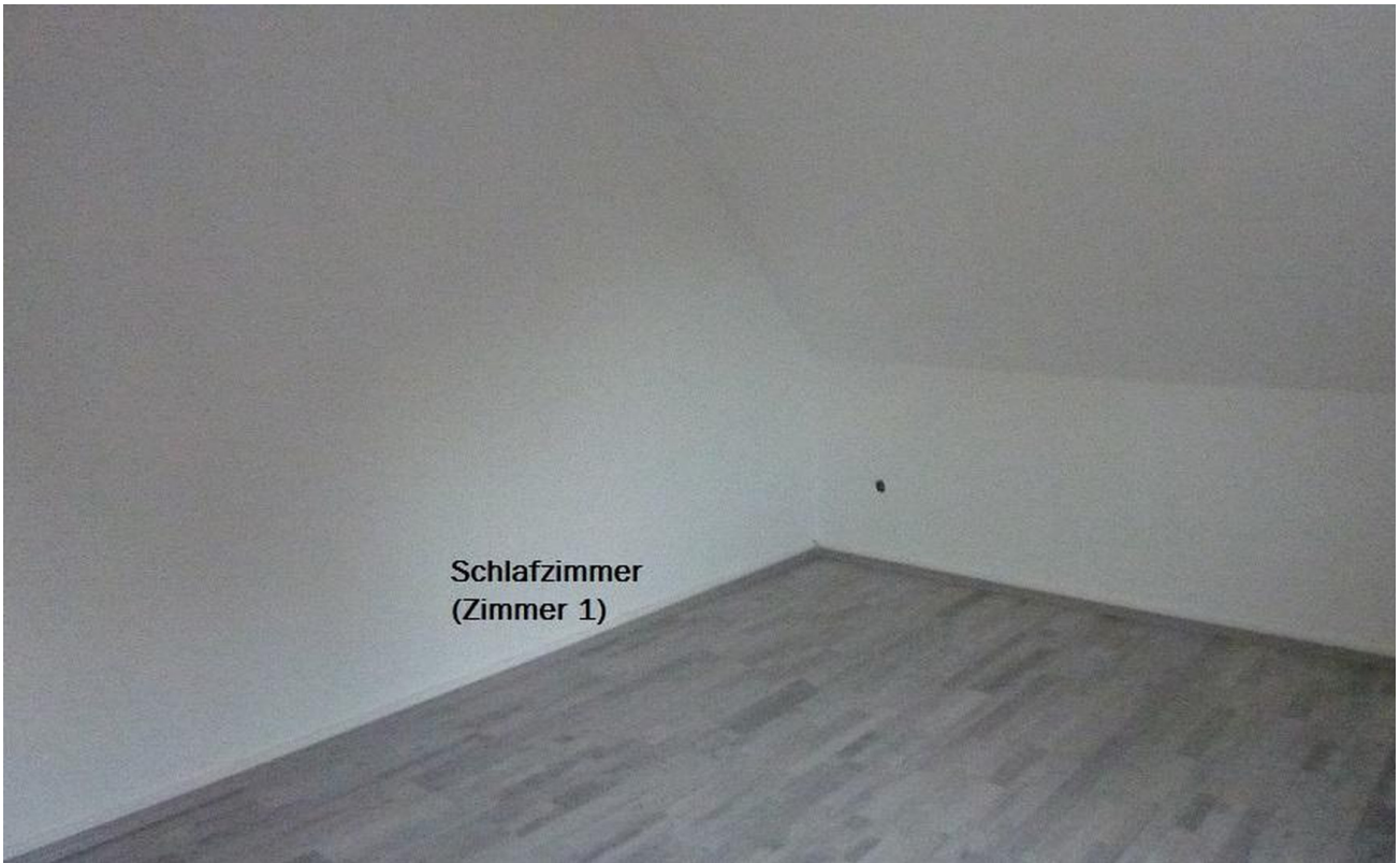
Schlafzimmer (Zimmer 1)