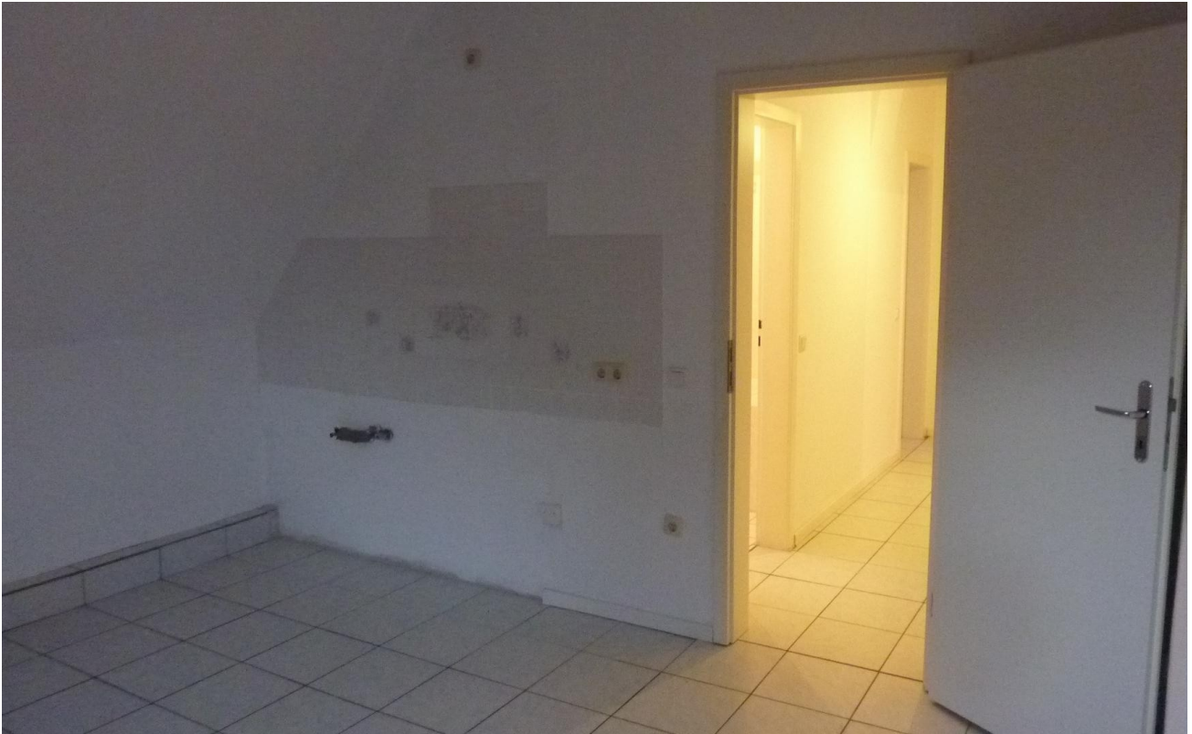
Küche Blick zur Diele