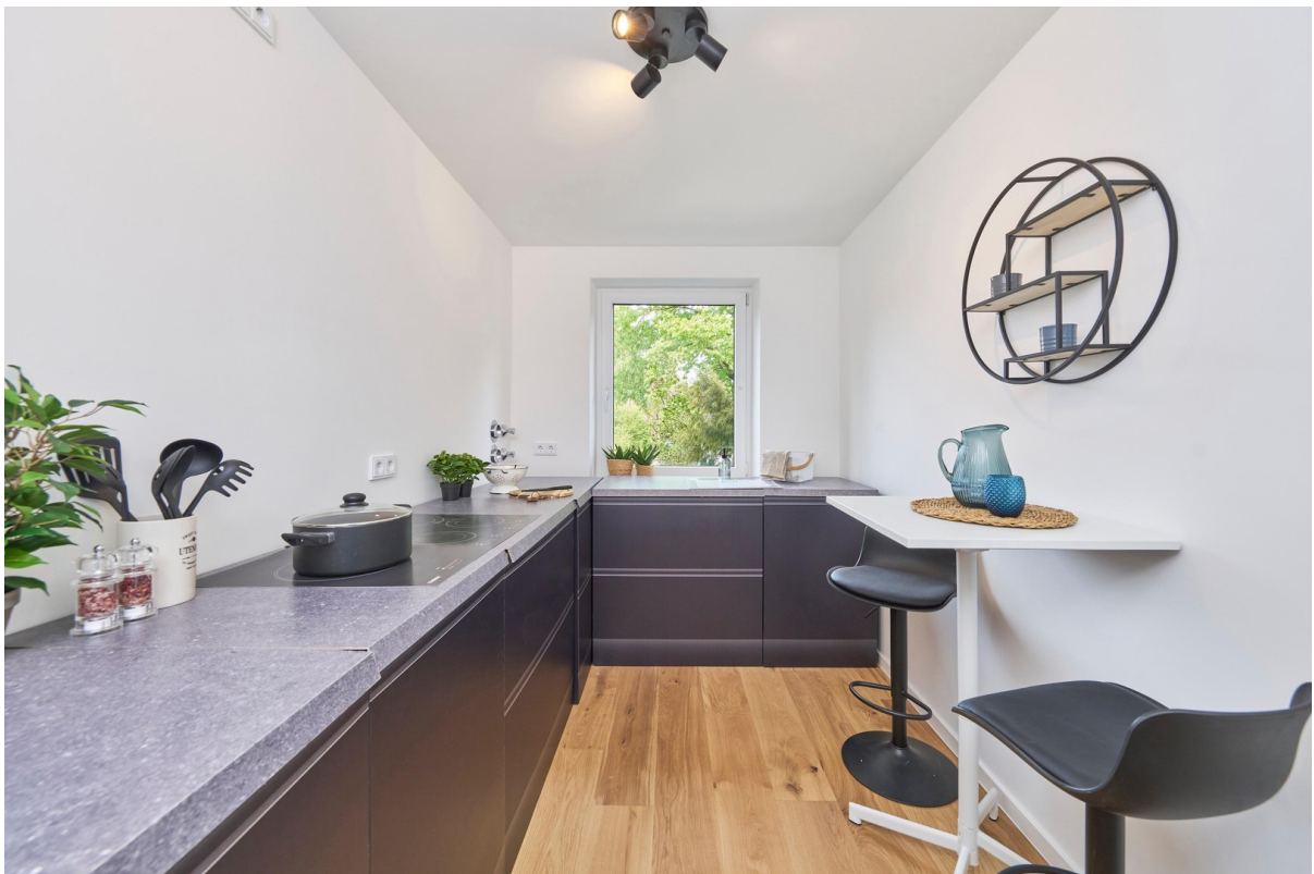
Reale Fotos - keine KI