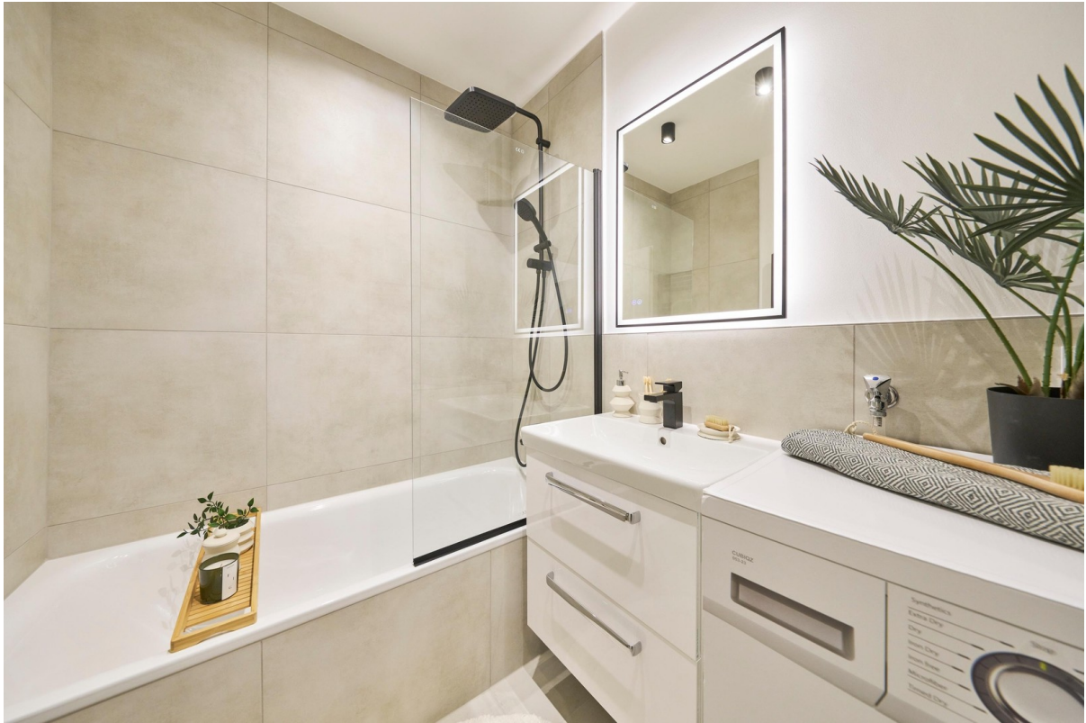
Reale Fotos - keine KI