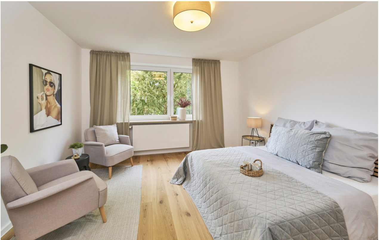
Reale Fotos - keine KI