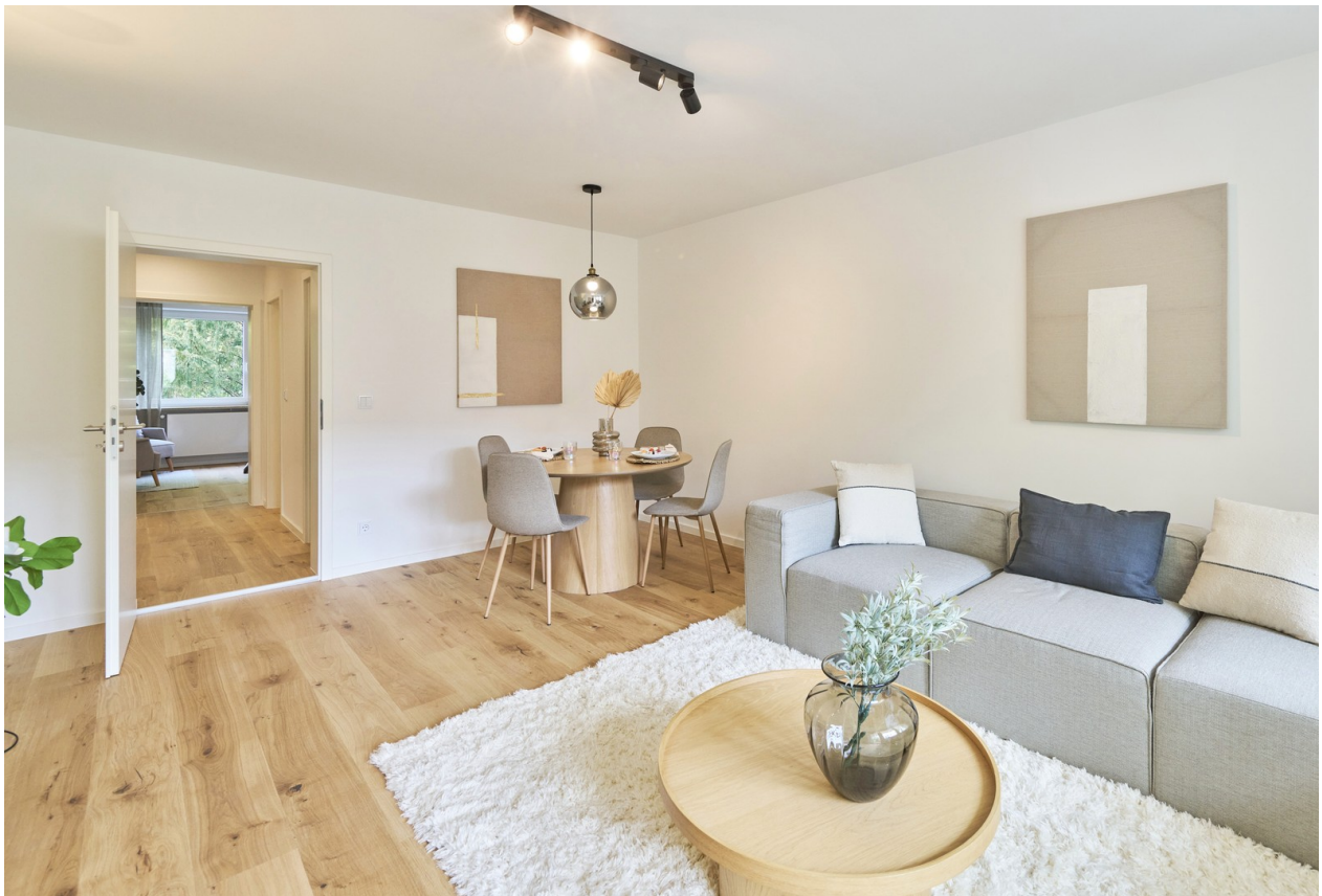
Reale Fotos - keine KI