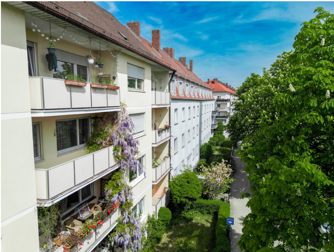
Reale Fotos - keine KI