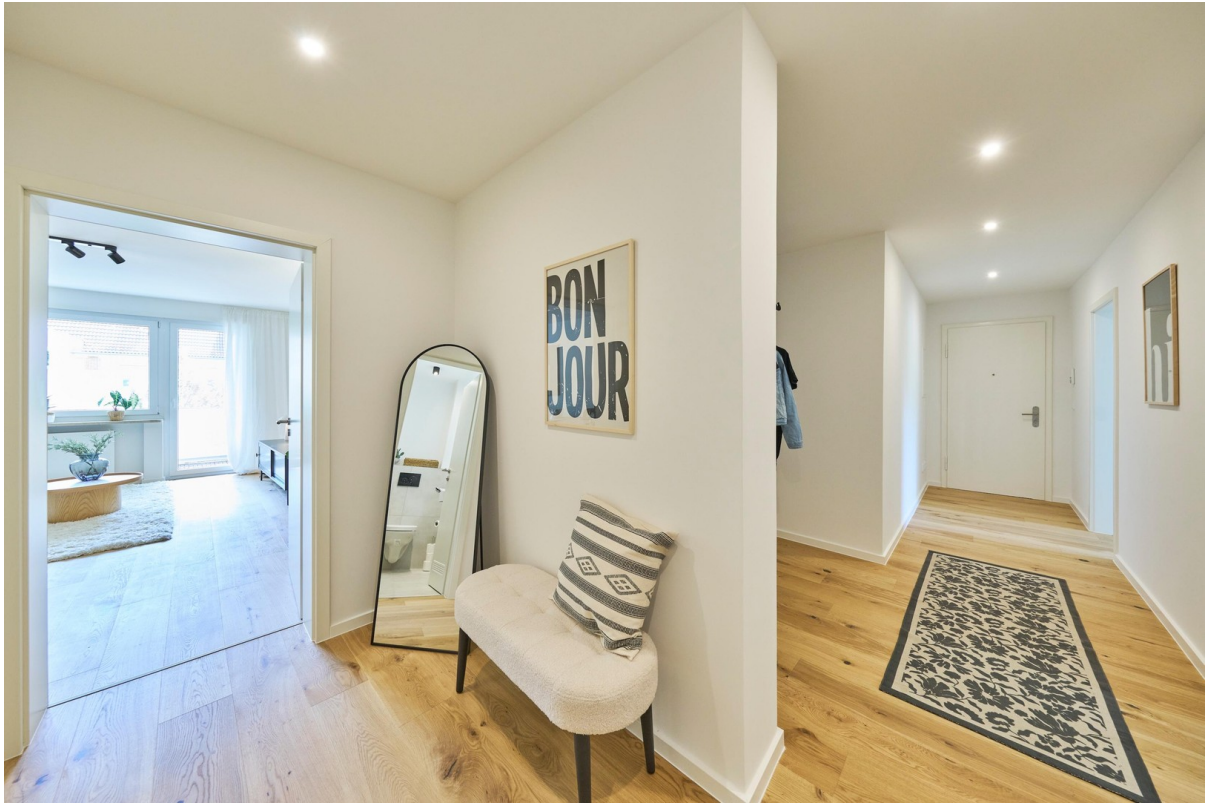
Reale Fotos - keine KI