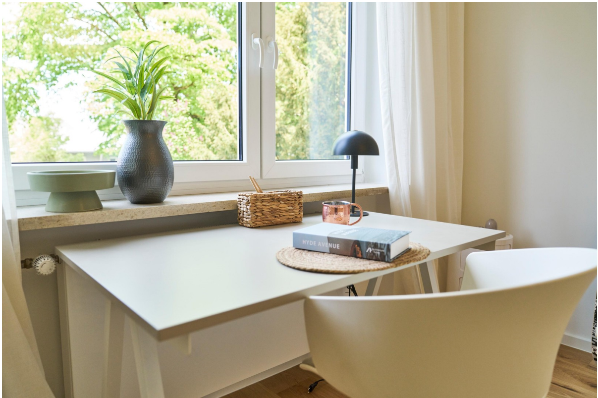
Reale Fotos - keine KI