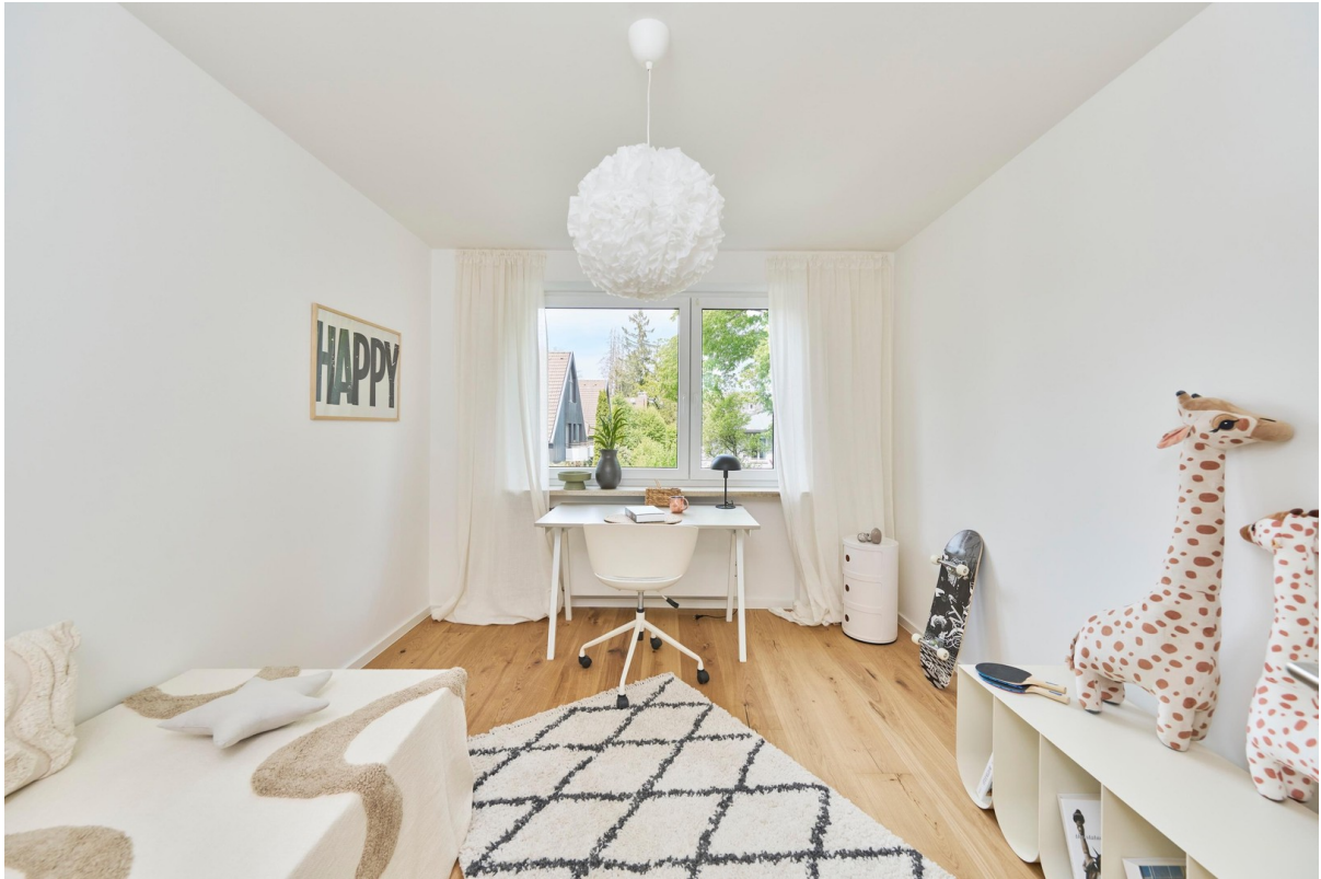
Reale Fotos - keine KI