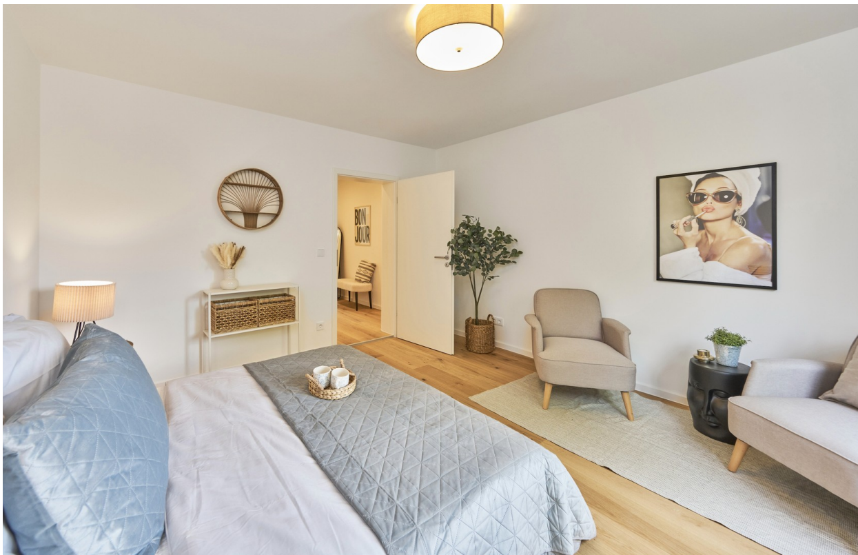
Reale Fotos - keine KI