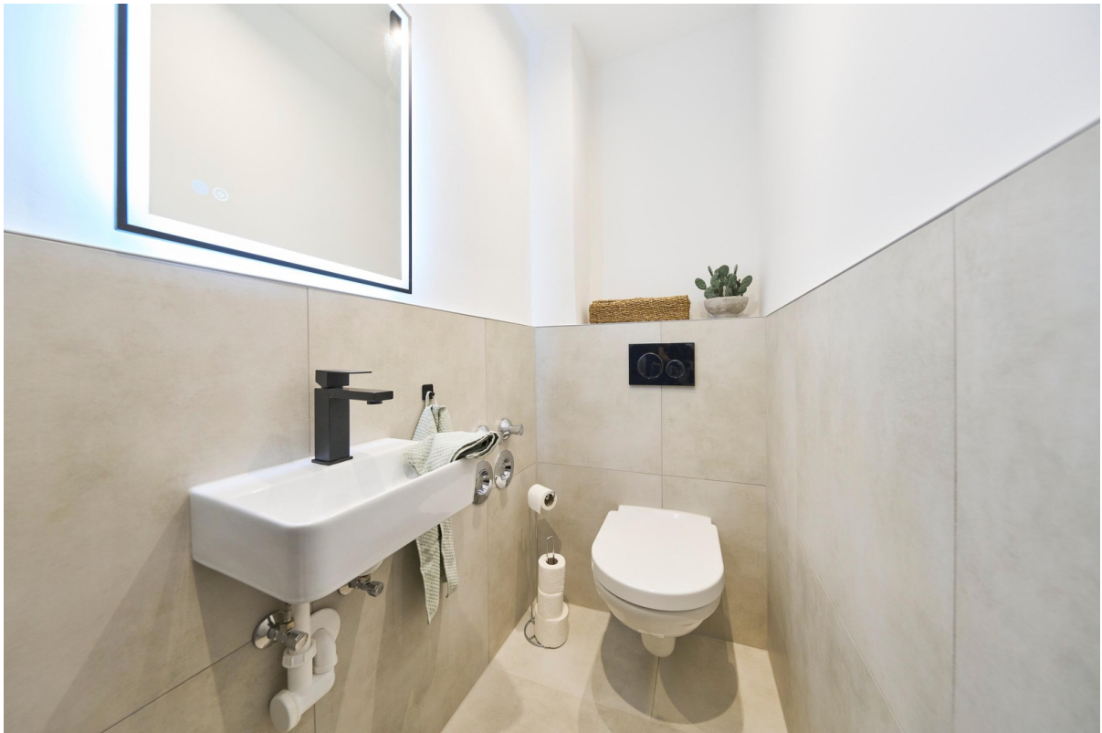
Reale Fotos - keine KI