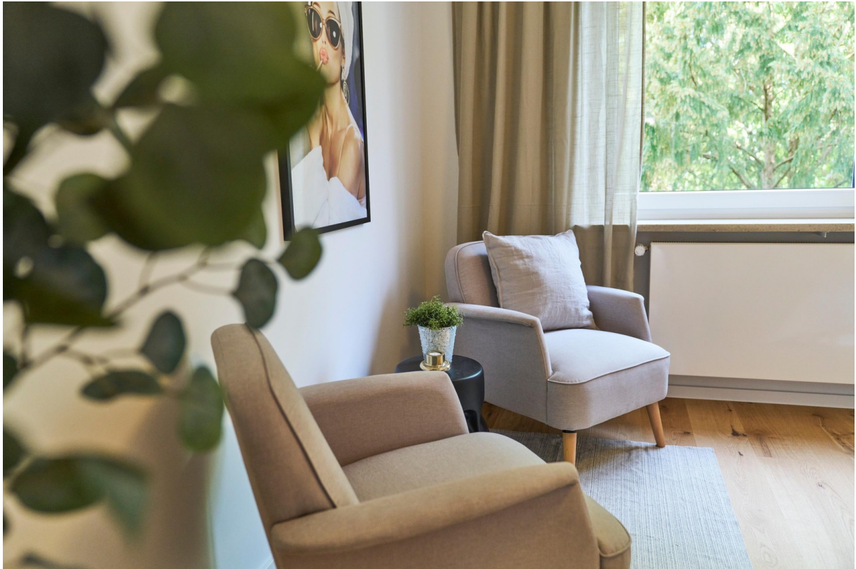
Reale Fotos - keine KI