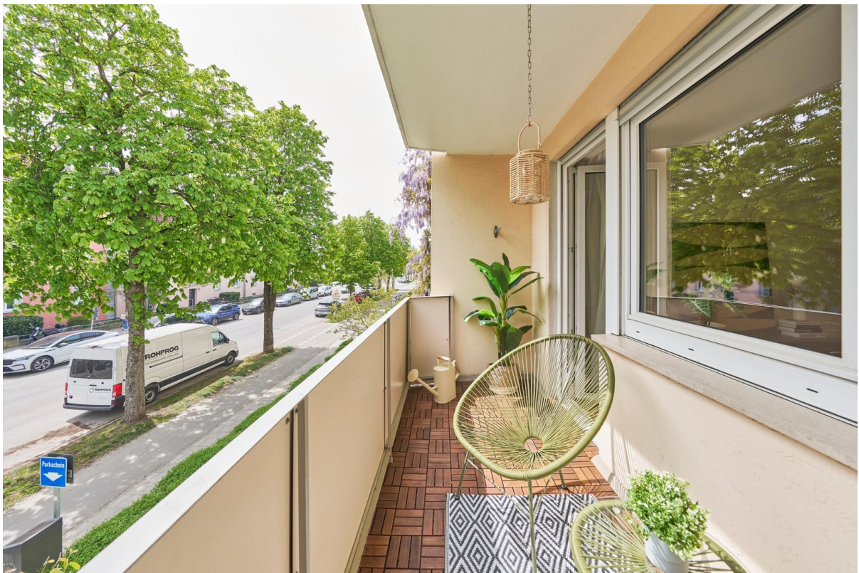
Reale Fotos - keine KI