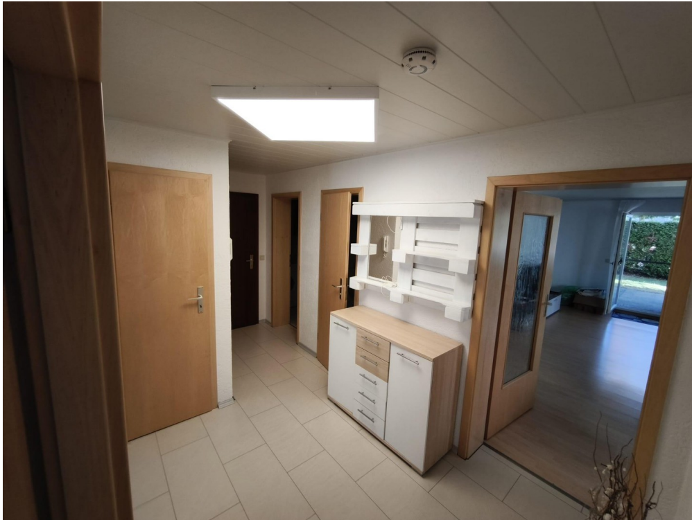
Flur zu Bad/WC/WZ