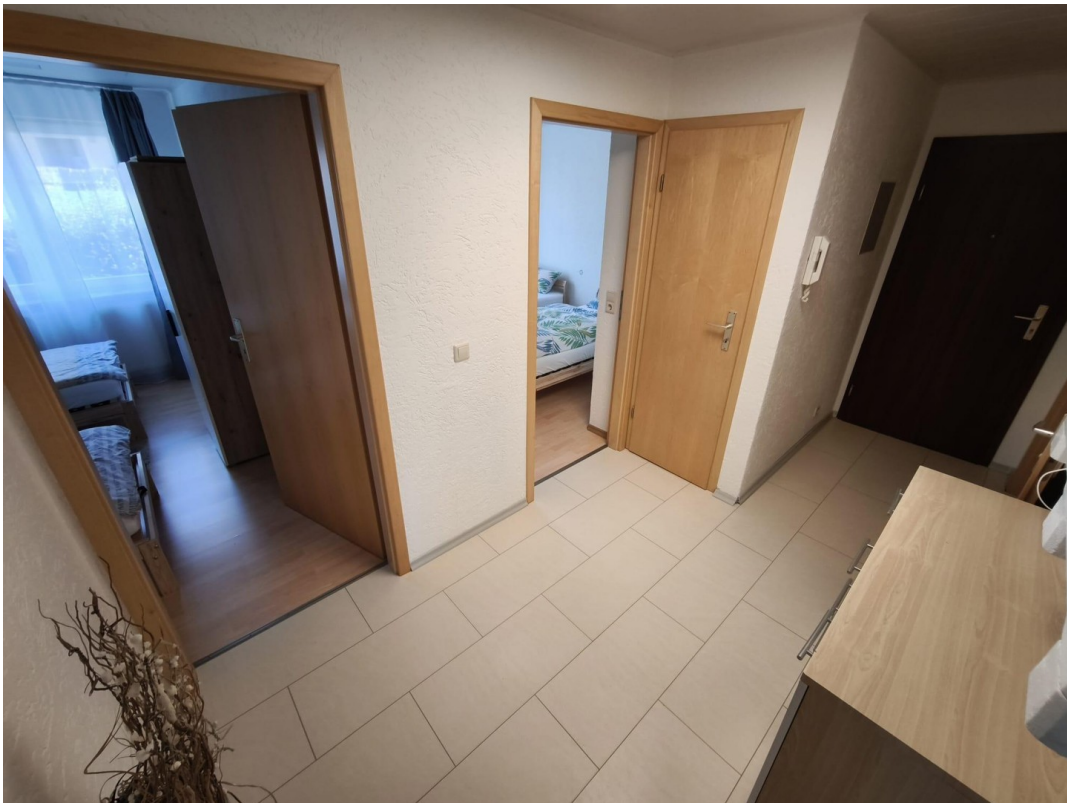
Flur zu Schlafräume