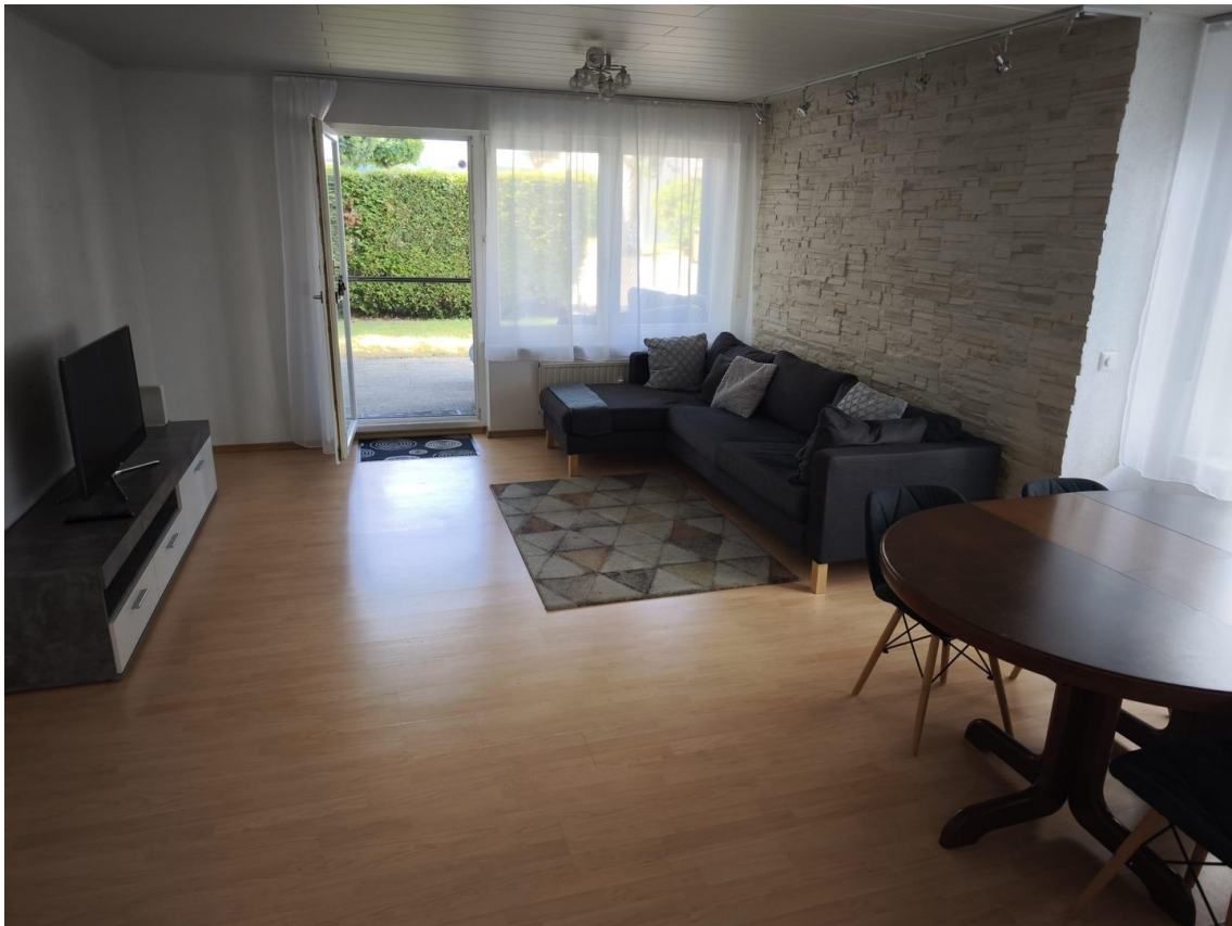
Essecke mit Wohnzimmer