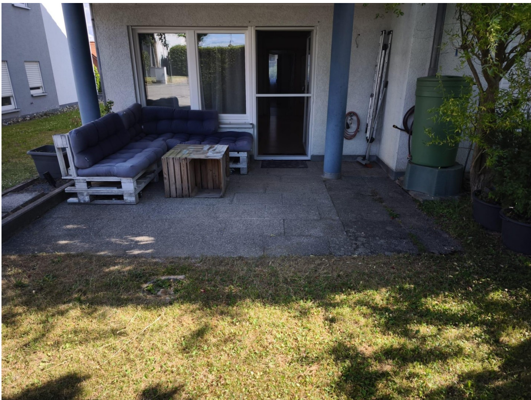
Garten mit Terrasse