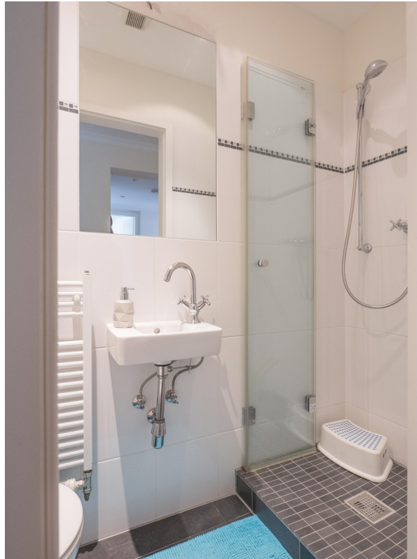
Gästebad mit Dusche