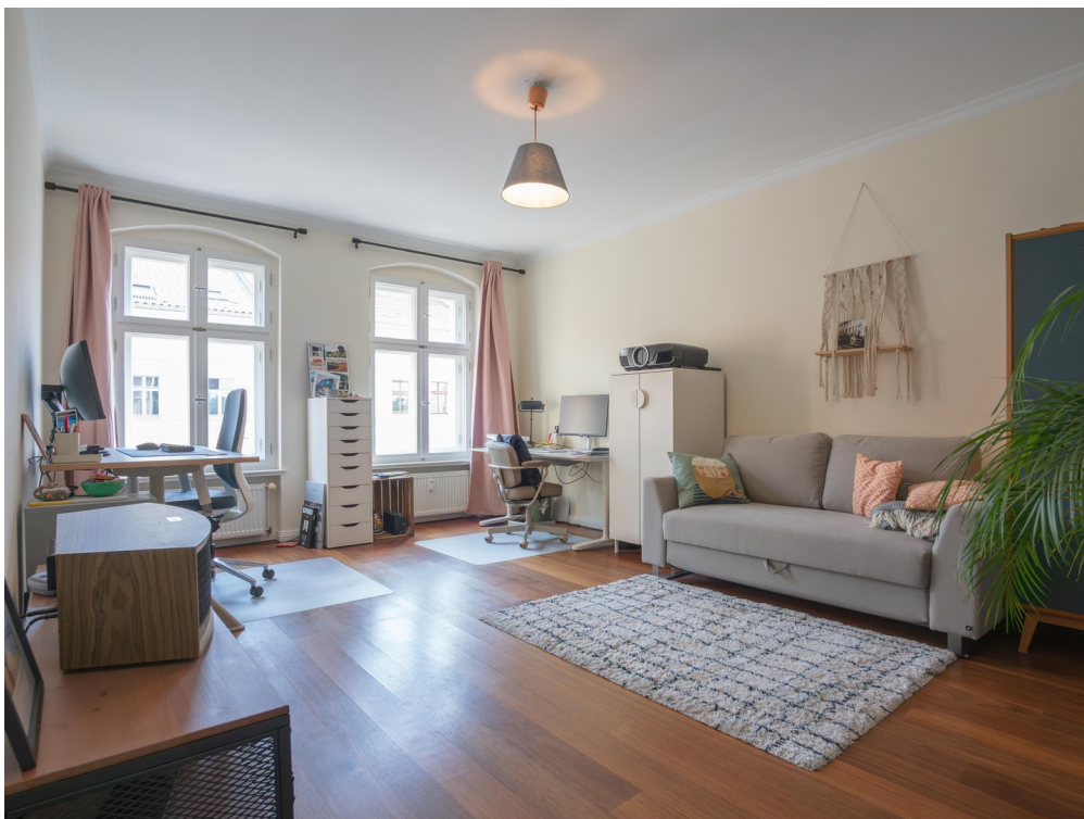
Schlaf / Arbeitszimmer