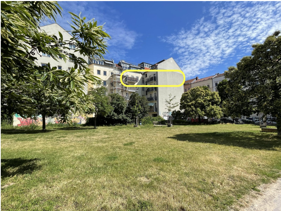
Grünfläche mit seittl. Fassade