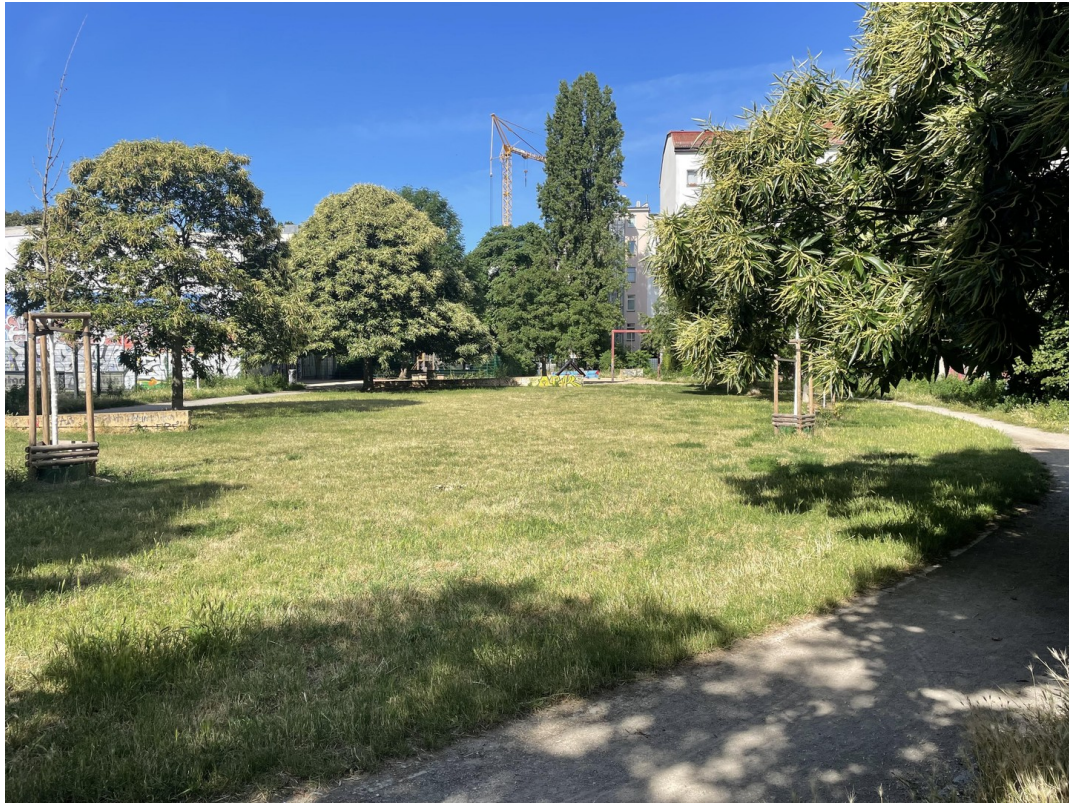
Grünfläche neben dem Objekt