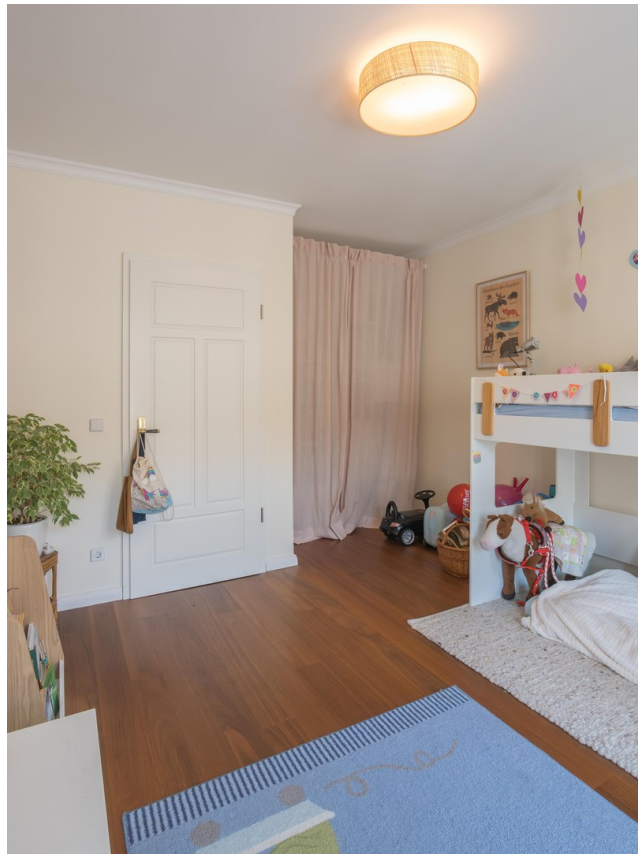
Kinder / Arbeitszimmer