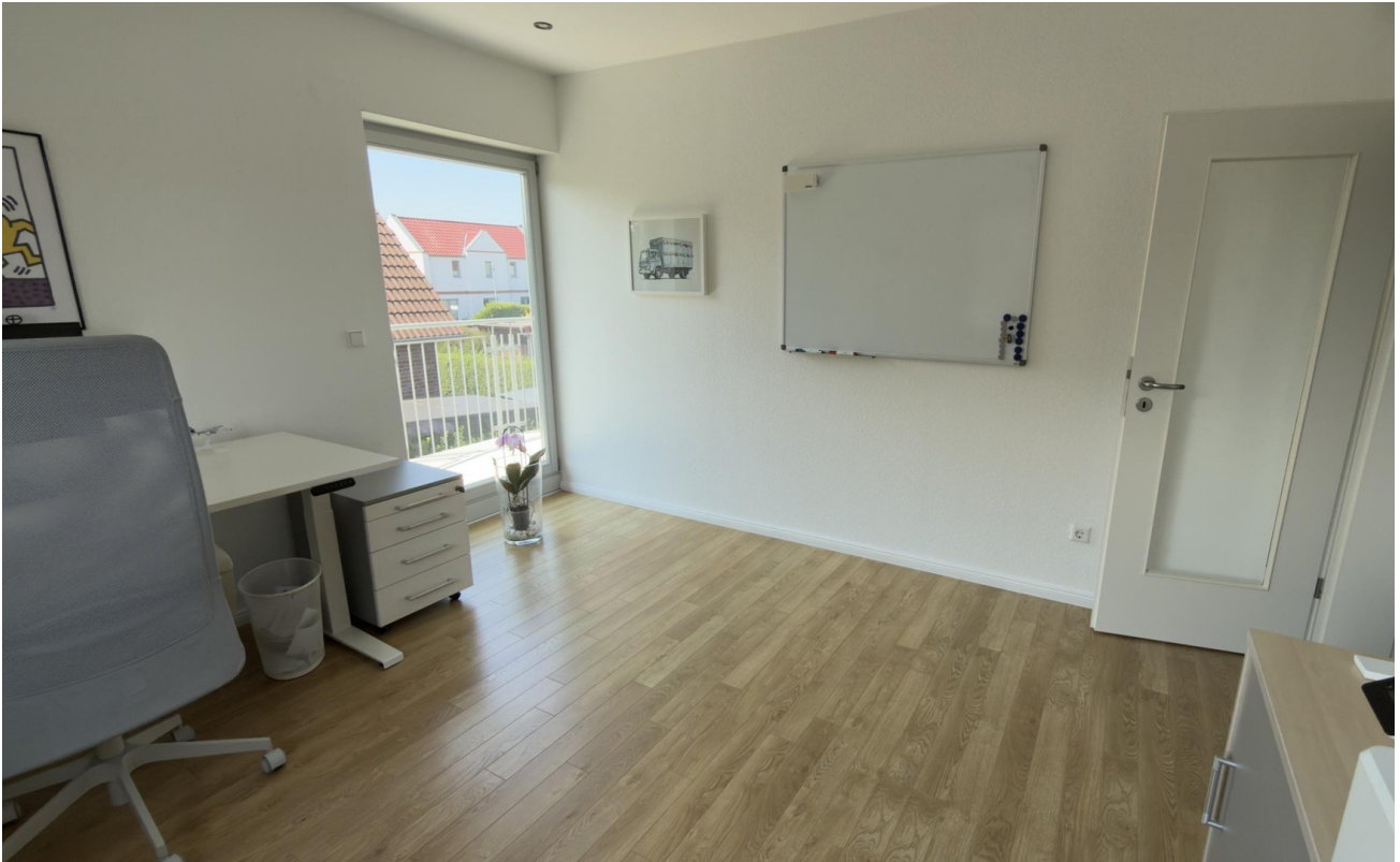
Arbeitszimmer (Kind 210) OG