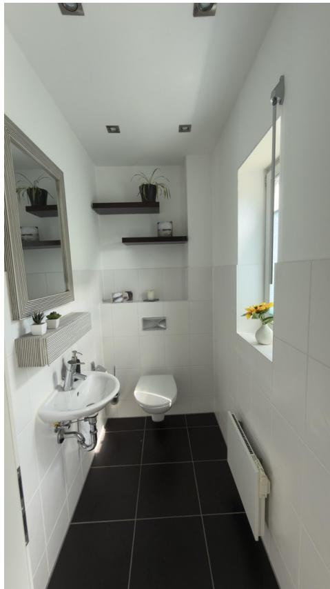
WC im EG