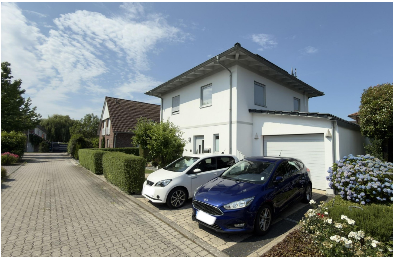
Ostseite von privatem Stichweg