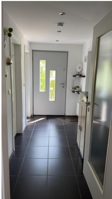
Flur / Eingangsbereich EG