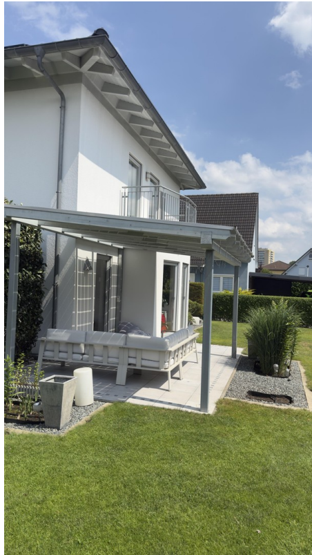
Terrasse, Sicht von Westen