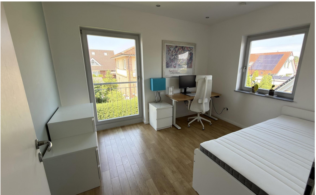
Arbeiten (214) OG