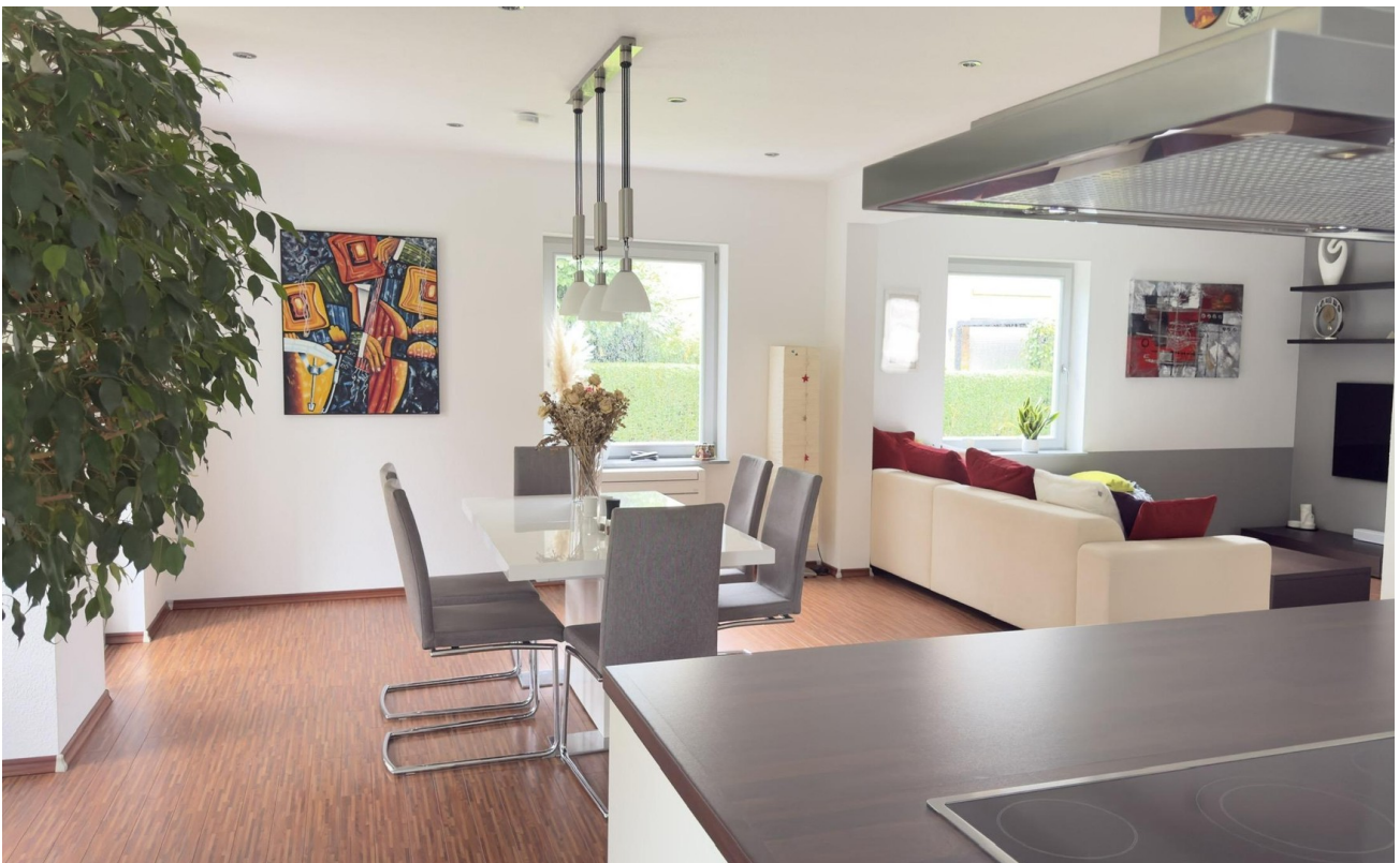
Essen / Wohnen