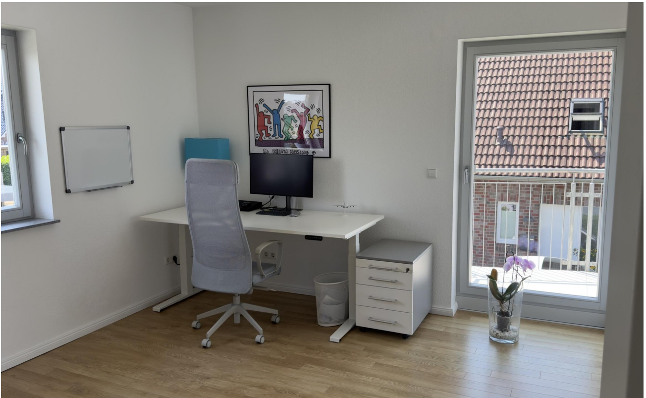
Arbeitszimmer (Kind 210) OG