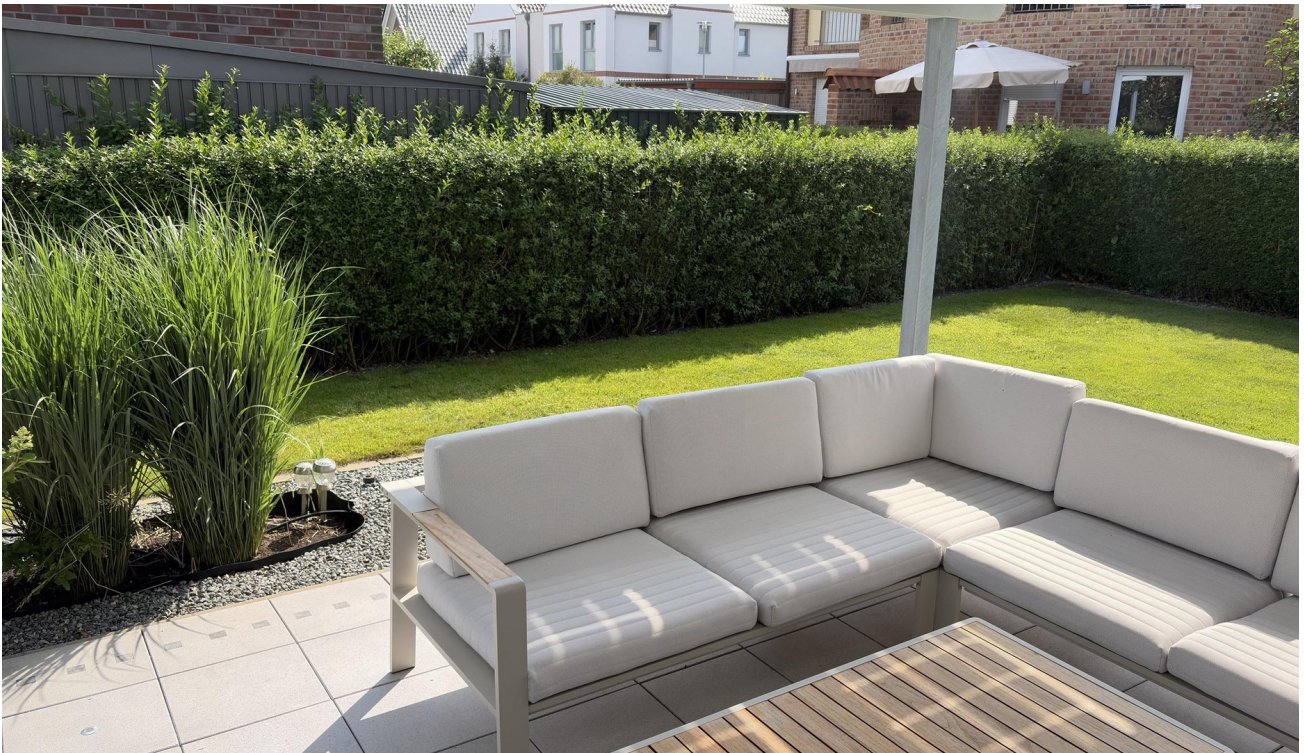
Blick auf Terrasse