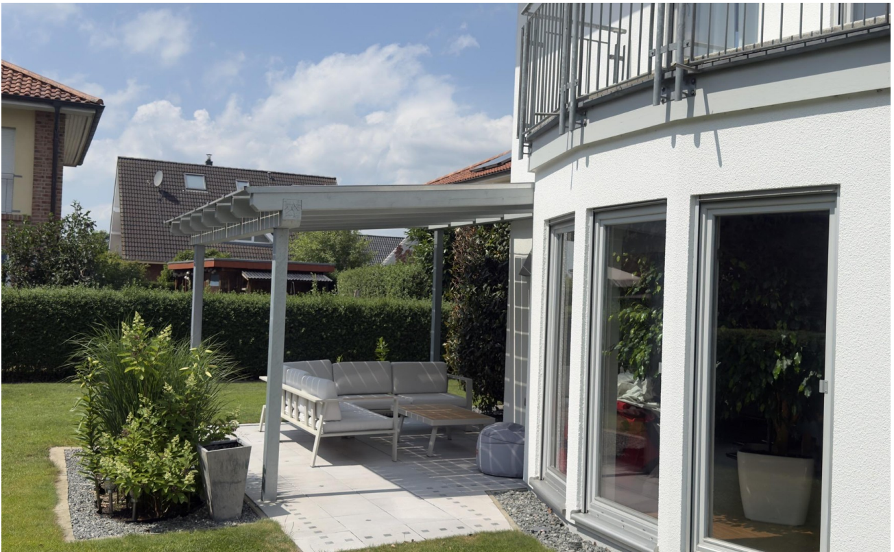
Südansicht mit Terrasse