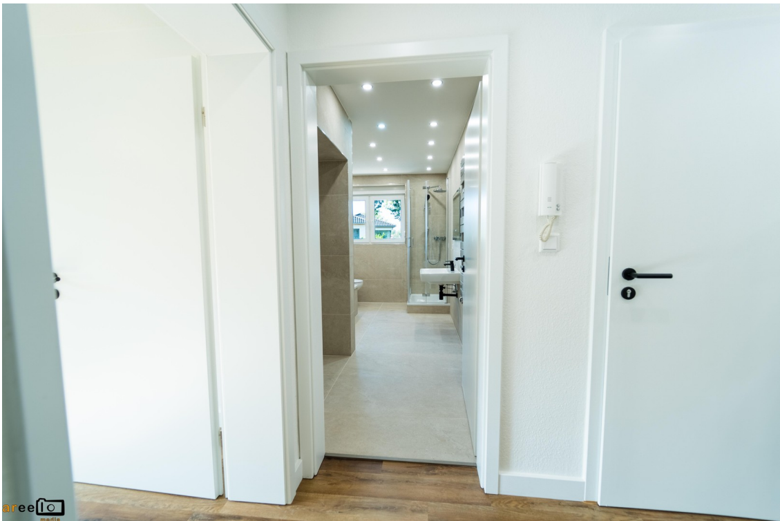
Badezimmer (Blick aus Flur)